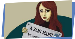
Acte Per Sant Jordi, parlem de dones

Activitat gratuïta. Reserva d'entrades al web del centre cívic o presencialment.