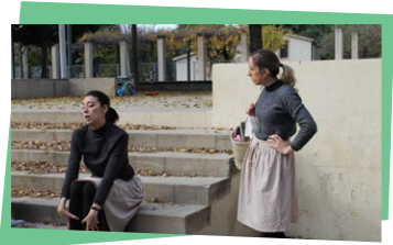
Itinerari teatralitzat Herstory. Quan elles prenen la veu

Organitza: Pantalla Barcelona i Auditori Sant Martí. Activitat gratuïta. No cal reserva prèvia.