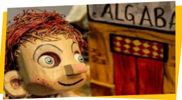
Espectacle familiar La família de les germanes Algaba

Accessibilitat física, bucle magnètic i servei traducció de llengua de signes amb reserva previa.