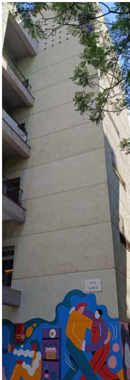
Fotografia: Josep M. Trias i Peix