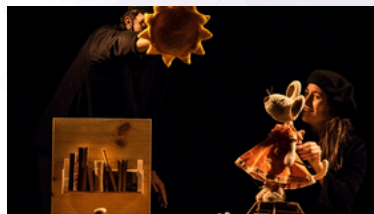
La rateta Martina i el ratolí Serafí

Cal inscriure's al casal de referència, com a màxim, el 22 de novembre.