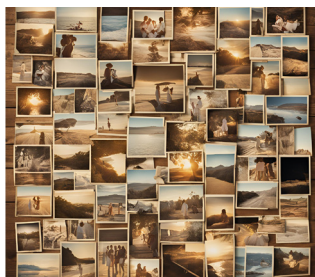
Imatge creada amb IA

A càrrec d'Adela Bacardit, autora de l'exposició "Nostàlgia dislocada".