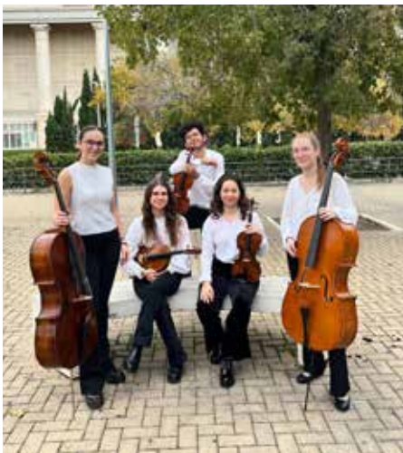
Fotografia: Quintet de Falla