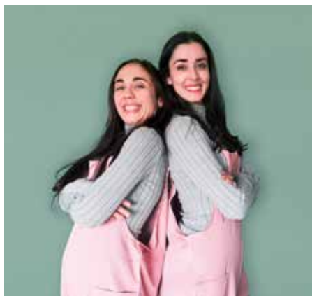
Fotografia: Niñas buenas

"Niñas buenas" és un espectacle d'improvisació teatral per a adults. Un viatge còmic a través del procés terapèutic de dues actrius que lluiten per superar la Síndrome de la Nena Bona. A través de l'humor i la improvisació, trencaran els estereotips i les expectatives socials sobre el comportament "correcte" de les dones, demostrant que la bondat no ha de ser sinònim de complaença. Un espectacle que t'anima a riure, reflexionar i alliberar-te de les normes imposades. La llibertat també pot ser divertida!