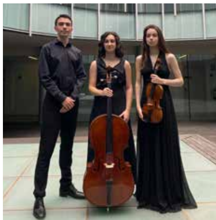
Fotografia: Trio Aurió

Becats per la Fundació de Música Ferrer-Salat