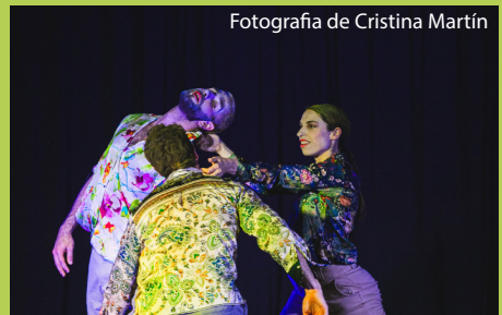
Imatge de 'Brevis' de Homeland Dance Company