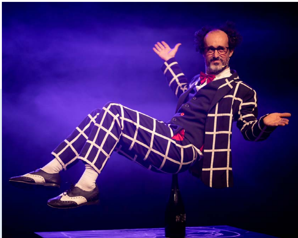
Fotografia de l'Ateneu Popular 9Barris

Entrada lliure. Pots assegurar la teva plaça amb inscripció prèvia.