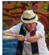
Contes beduïns Cia Bufanúvols

Per a un beduí un bon consell val més que un camell.