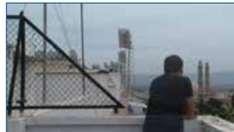
Jo he habitat l’absència dues vegades