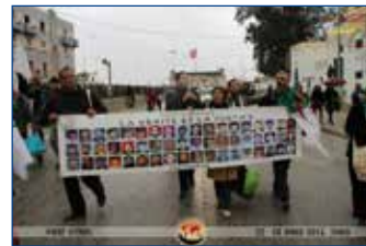
Exposició “Memorial d’Algèria”

- Taula temàtica de títols al voltant d'Algèria.