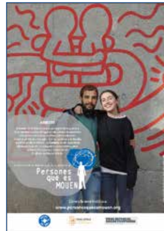
Exposició “Persones que es mouen”

* El divendres 29 de novembre, de 9.30 a 12 h , els alumnes de 4t de primària de l' Escola Rius i Taulet faran una visita guiada a l'exposició, dins del Projecte APS (Aprentatge i Serveis) Ni Tòpics ni típics, Centres Educatius Interculturals 2019. Aquest projecte antirumors treballa la convivència intercultural i el coneixement de “l'altre” amb alumnes de 1r a 4t de primària dels centres que hi vulguin participar.