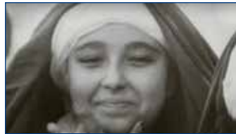
La Zerda ou les chants de l'oubli Escrita i dirigida per Assia Djebar