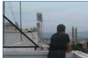
Jo he habitat l'absència dues vegades