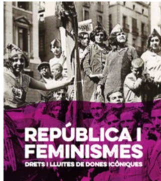
Josep Maria Sagarra Arxiu Fotogràfic de Barcelona

Ho organitza: Biblioteca Montserrat Abelló.