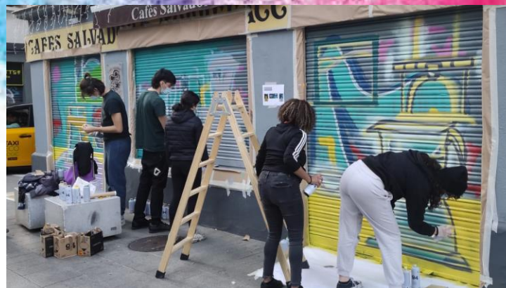
Projecte Persianes Vives #BSaB Barceloneta, PDC, Dte.