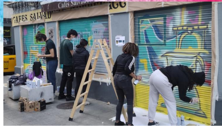
Projecte Persianes Vives #BSaB Barceloneta, PDC, Dte.