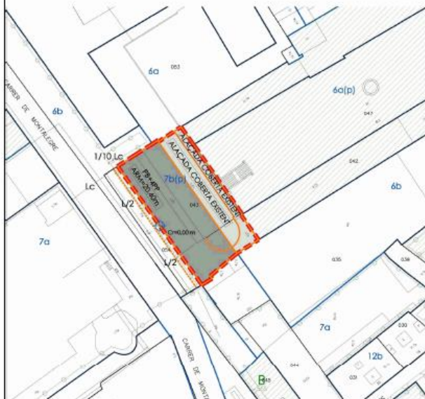
PLANEJAMENT PROPOSAT. ORDENACIÓ PLANTA