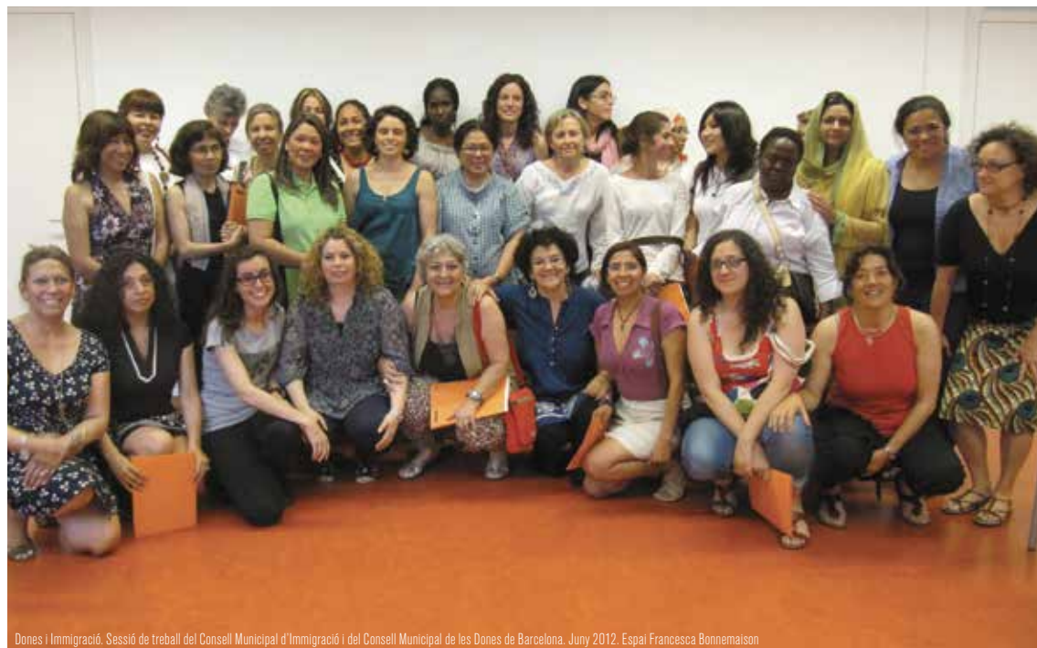
Dones i Immigració. Sessió de treball del Consell Municipal d'Immigració i del Consell Municipal de les Dones de Barcelona, Juny 2012. Espai Francesca Bonnemaison