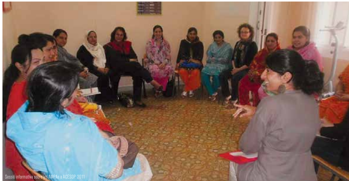
Sessió informativa sobre les AMPAs a ACESOP, 2011