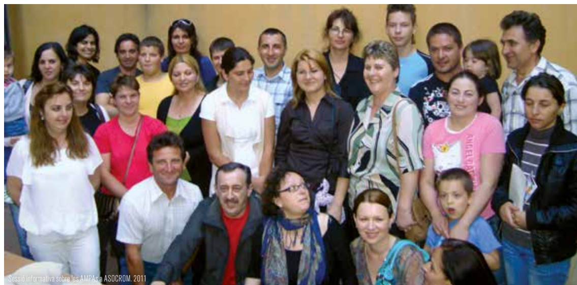
Sessió informativa sobre les AMPAs a ASOCROM, 2011