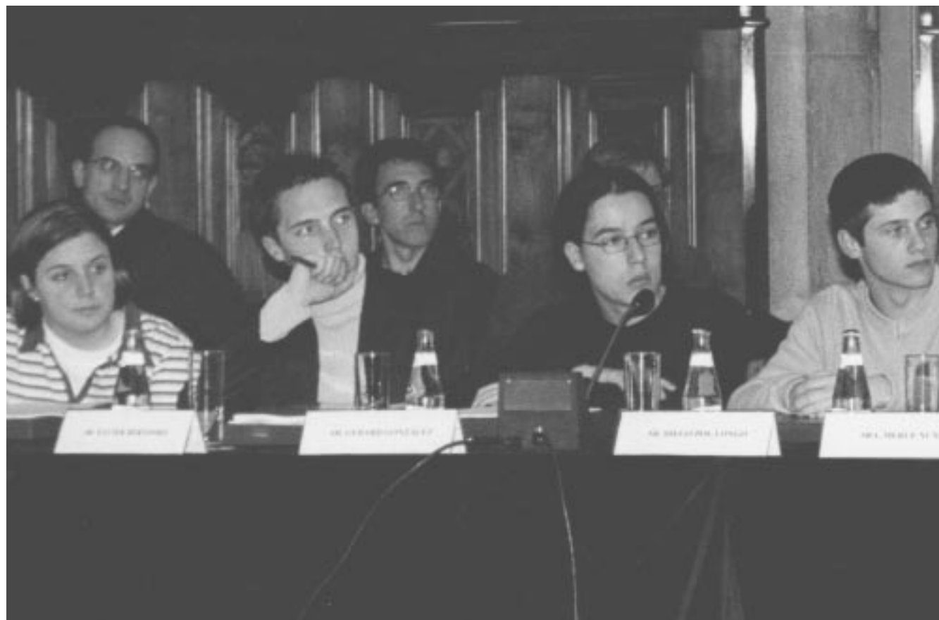
Representants de l'alumnat en el Consell Escolar Municipal

Amb una important participació, de cent cinquanta alumnes, majoritàriament representants dels consells escolars