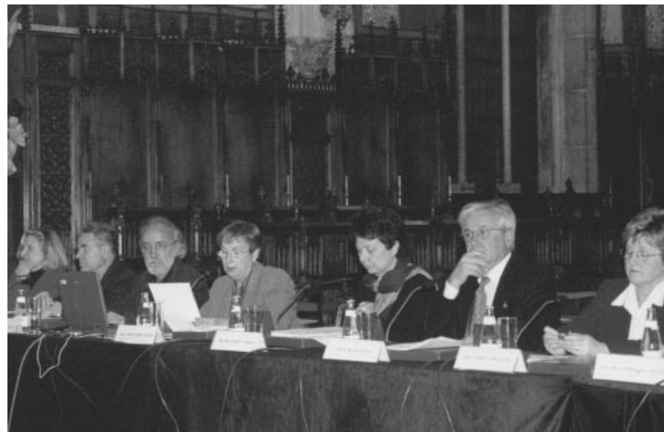
Presentació de l'Informe al plenari del Consell Escolar Municipal

"La construcció d'equipaments escolars habitualment va per darrere de l'arribada de població i de les noves actuacions urbanístiques."