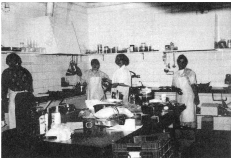
Cuina del Centre Solidari del Casc Antic.