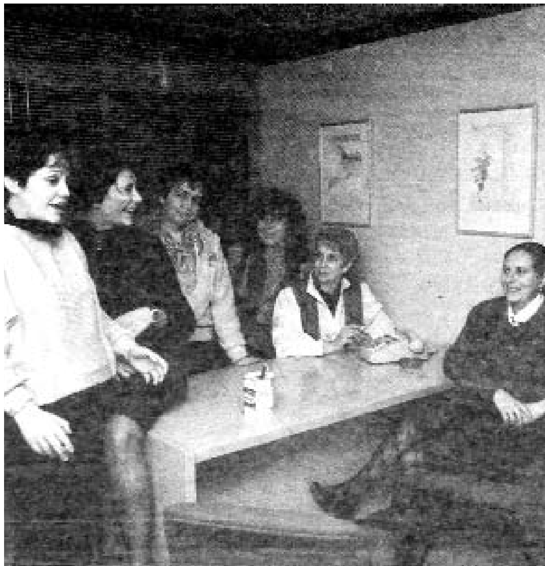
L'equip del nou centre de planificació familiar. Ciutat Vella. Full informatiu del districte. Març de 1986