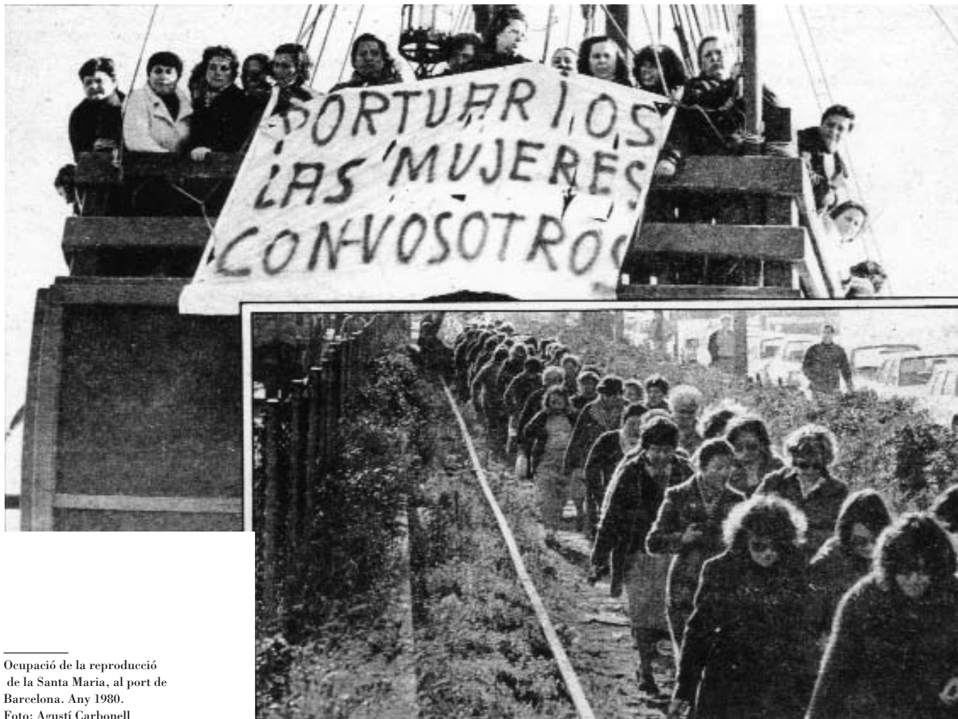
Ocupació de la reproducció de la Santa Maria, al port de Barcelona. Any 1980.