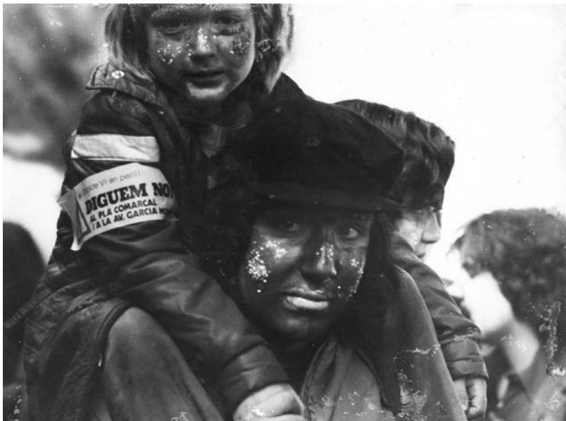
“Diguem no al Pla Comarcal i a l’avinguda García Morato”