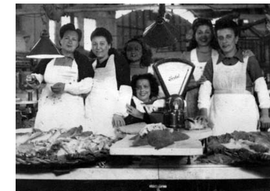
Peixateres al mercat del Ninot.

La noció de qualificació professional té molt a veure amb el sexe de la treballadora o treballador. Al llarg de la història, la tipificació sexual de les categories professionals ha estat molt vinculada al control dels processos de formació i aprenentatge d'empreses o d'associacions d'homes i de l'exclusió de les dones (Mayordomo, 2004).