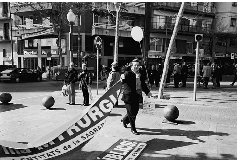
Reivindicació dels terrenys de la fàbrica Myrurgia per al barri.

jecte d'equipaments s'anava endarrerint. El 1997 s'inauguraven dues piscines cobertes al poliesportiu de l'Estació del Nord i, no ha estat fins fa pocs anys, que s'han aconseguit altres equipaments per al barri, com ara una biblioteca, un centre cívic, el mercat, habitatges per a persones grans.