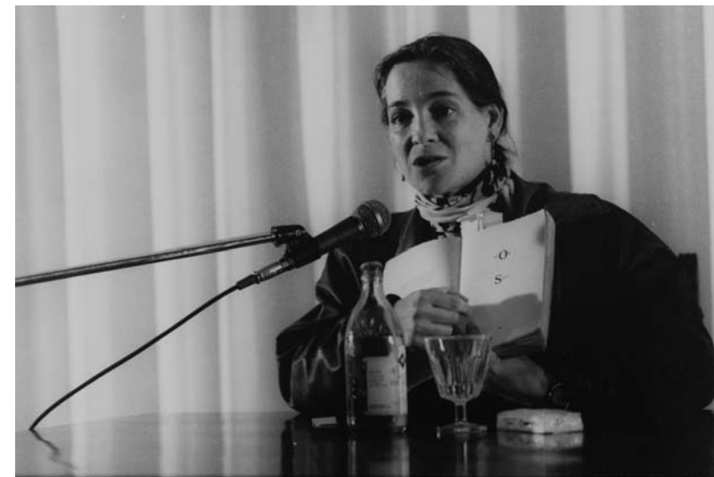
Maria Mercè Marçal en una conferència.