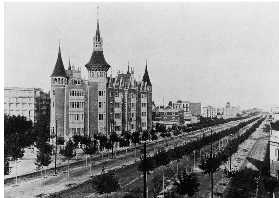
Casa que va fer construir Àngela Brutau, en representació de les seves filles, a la Diagonal, coneguda popularment amb el nom de Casa de les Punxes.

Una d'elles va ser Àngela Brutau, que en representació de les seves tres filles, Rosa, Josefa i Angela Terradas i Brutau, demanà permís a l'Ajuntament de la ciutat, el 8 de gener de 1904, per construir tres cases a l'avinguda Diagonal, coneguda popularment amb el nom de Casa de les Punxes. El 1905, l'arquitecte Puig i Cadafalch començà la construcció de l'e-