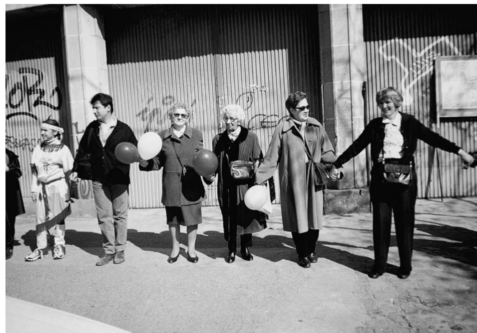
Reivindicació dels terrenys de la fàbrica Myrurgia per al barri.