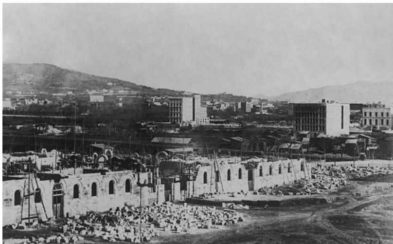
Construcció de la universitat, a la plaça del mateix nom, 1865.

Feminal , des de 1907, va fer una aposta decidida per la professionalització de les dones. D'una banda, per reivindicar l'accés a totes les professions, trencant els prejudicis que les condemnava a reduïts àmbits d'actuació. De l'altra, per tal de denunciar les deplorables condicions laborals en què vivien immerses amplis sectors de dones, especialment aquelles que treballaven a domicili.