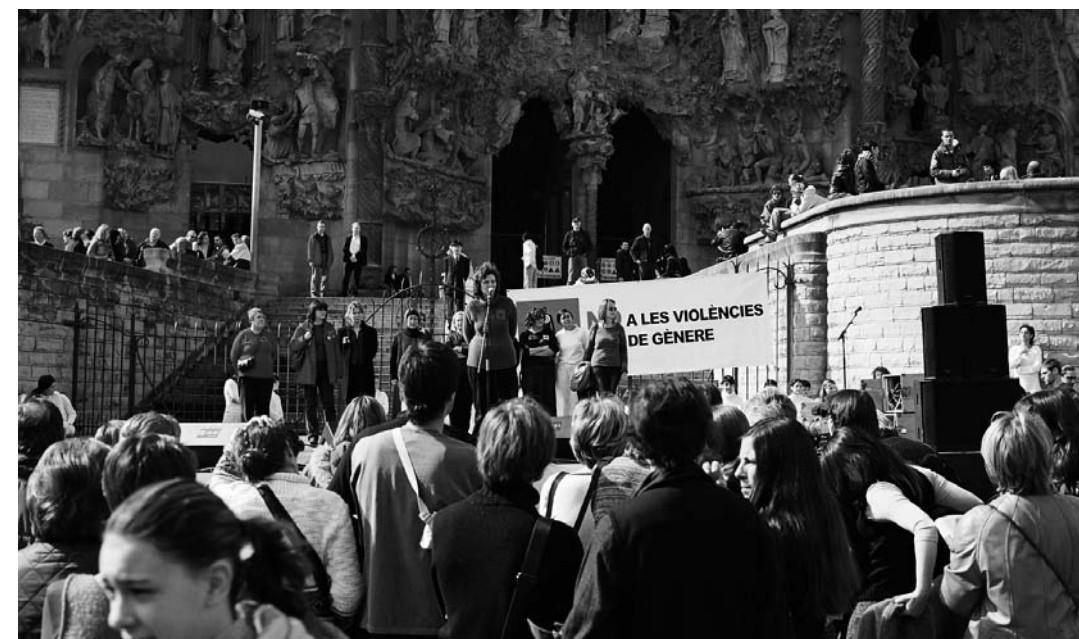
Acte de la Plataforma contra la violència davant la Sagrada Família, 2002.

Vam encetar formació per a les voluntàries, per tal d'aprofundir en el tema; emmirallant-se en altres experiències com les companyes de Nou Barris d'Acció contra la violència domèstica; sensibilització als cinc barris amb un cicle específic sobre la violència vers les dones; projectes de prevenció entre la joventut; consoli-