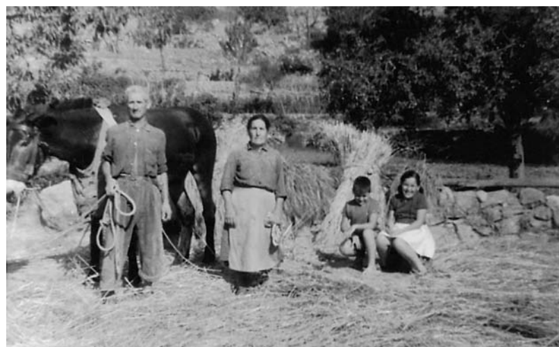
Criatures residents a l'Eixample visiten àvia i avi a la població aragonesa de Los Lucas-Olba, Terol, 1966.

construcció de l'Esquerra de l'Eixample, però, va ser molt més lent. En el paisatge de principis de segle XX, encara hi havia camps, enmig de les construccions. Amb el pas dels anys, però, habitatges i magatzems, cobriren tota la superfície urbanitzable.