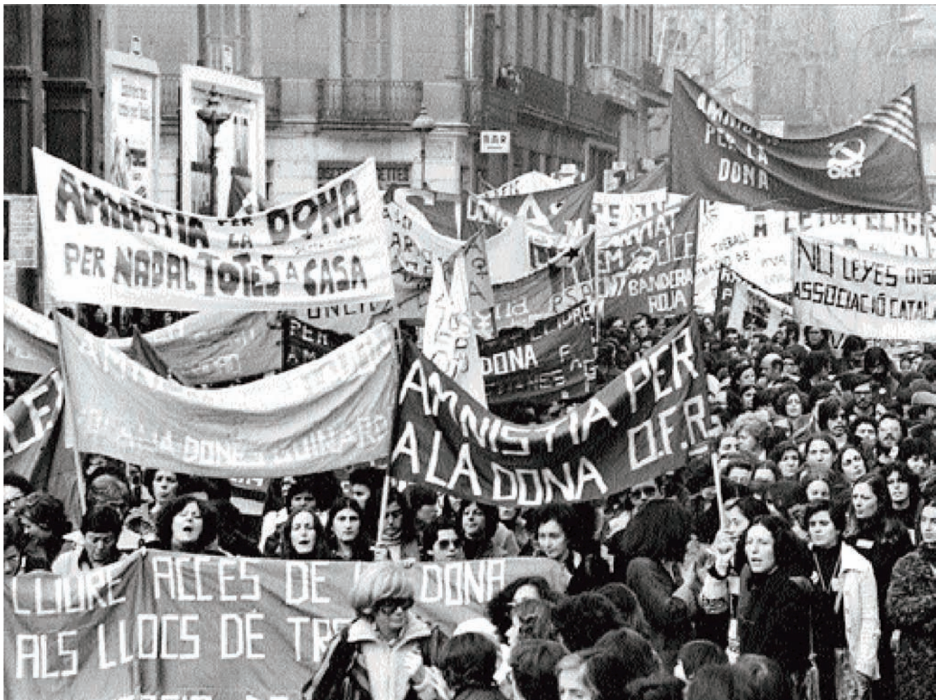
Manifestació de dones pels carrers del centre de la ciutat en demanda de l'Amnistia per la dona i lliure accés als llocs de treball, 1978.