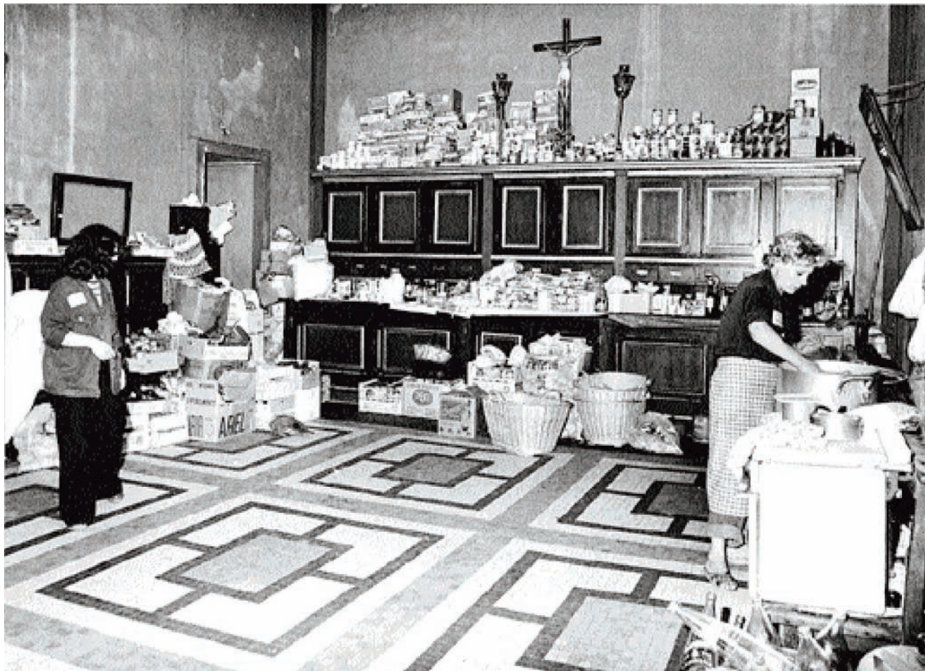
Les dones de Motor Ibèrica a la sagristia de la parròquia de Sant Andreu, juny del 1976.

ordinari. Les dones, malgrat els vint dies de tancament que ja portaven i la preocupació pel que els passaria als seus marits a la feina i a elles i a les seves criatures allà tancades, l'ambient era agradable, gairebé festiu. Les dones estaven molt satisfetes de com s'havien organitzat i contentes de viure en comunitat i haver parlat entre elles. Explicaven anècdotes divertides i els que més ganes tenien que es posés fi a la tancada eren els marits perquè "les cases estaven abandonades, deixades".