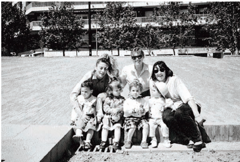
Grup d'amigues de la Sagrera que es reunien cada dia a la plaça del General Moragues i que fartes de que les seves criatures haguessin de conviure amb l'empastifada de les caques dels gossos van iniciar una campanya pel civisme dels propietaris dels gossos. Maig del 1993.