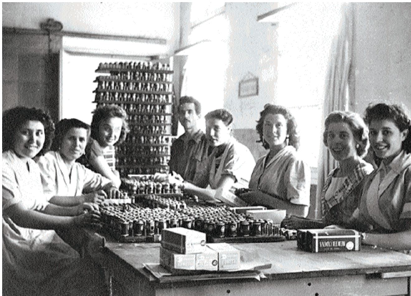
Treballadores i Treballadors de Can Fabra, 1956.

tant, a partir d'aquestes anotacions els pagaven el salari." Treballava de sis del matí a dues del migdia i el seu primer salari va ser de 29,30 pesetes mensuals. "Teníem mitja hora per esmorzar i aquest temps (l'entrepà ens l'havíem menjat entre feina i feina) l'aprofitaven per anar a comprar o fins i tot per pujar als cavallets que es posaven al davant de la fàbrica quan era la festa major. Aquest aprofitar per anar a comprar posa de relleu la diversitat d'accions que les dones