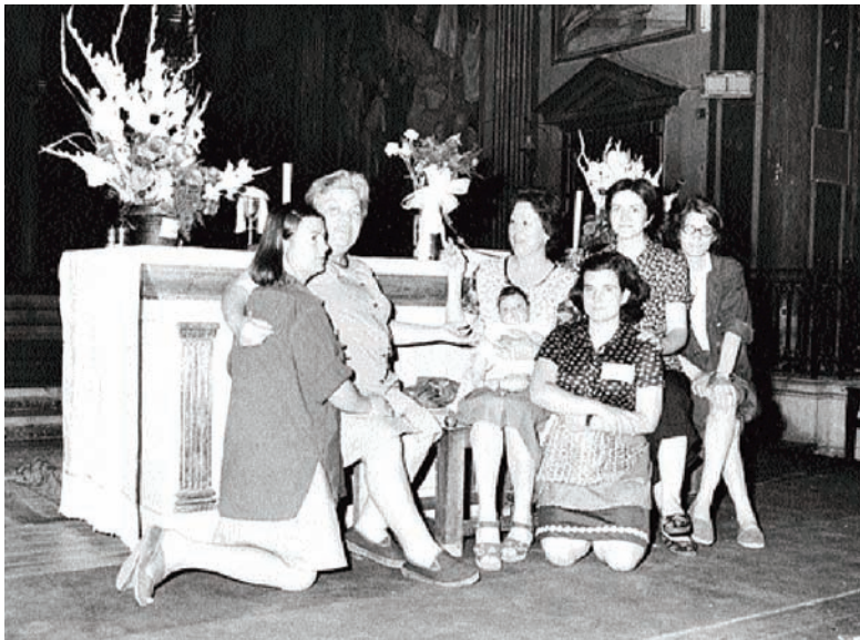
Tancada de dones de Motor Ibérica a la parròquia de Sant Andreu, juny del 1976.