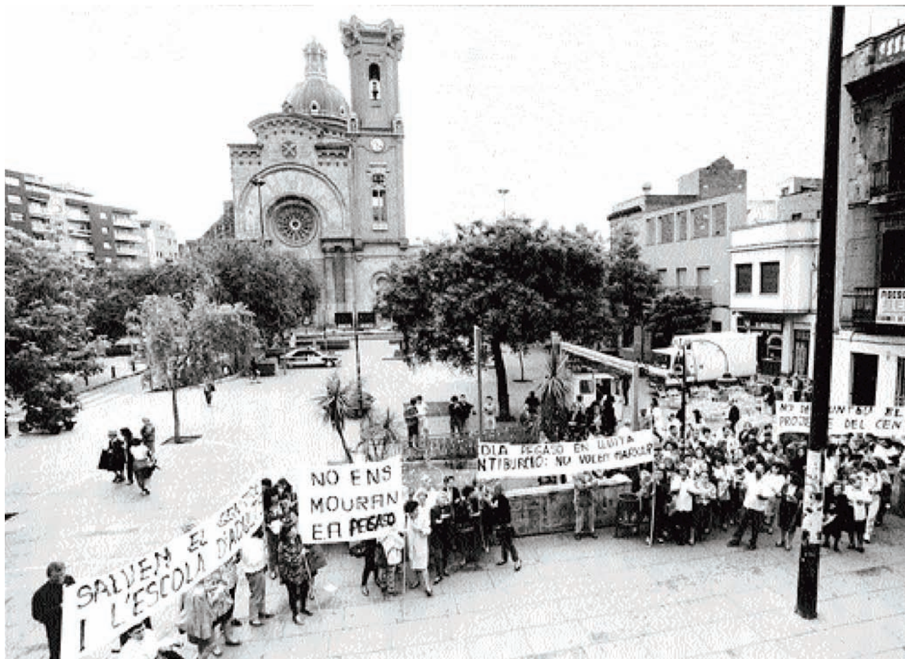
Manifestació a la Plaça Orfila de Sant Andreu, el maig del 1992.