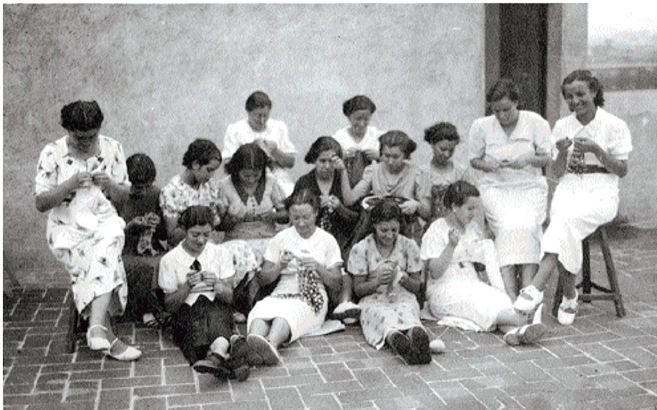
Dones fent costura i labors.

l'assistència a classe de les filles grans que, en cas contrari, sovint es veien obligades a quedar-se a casa per vigilar els germans i germanes més petits, tal com ja hem dit. En definitiva, impulsaren la creació de serveis que podien millorar les condicions de vida de les dones. Leonor Serrano escrivia: "Vuestras hijas y discípulas deben tener, bajo la égida de la República, un porvenir más esplendoroso que el pasado y el presente del que habéis gozado -o sufrido- vosotras. La niña actual, la mujer de mañana, se