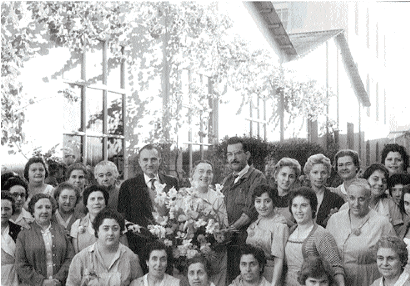
Treballadores i treballadors de Can Fabra, 1960.

esmentat i el seu gendre Camilo Fabra i Fontanils. La societat fabricava fils de cotó en troques i, posteriorment, rodets i troques. Anys a venir van diversificar la seva producció amb xarxes de pesca i cintes de fil i cotó, fabricades a la factoria de Salt, Girona. El 1903 es crea la Compañia Anónima Hilaturas de Fabra y Coats, que procedeix de les anteriors i la fusió amb Barcelona Manufacturing Co., Ltd, (el marquès d'Alella era propietari de Can Fabra) que arribà a concentrar 1.500 operaris, entre la factoria de Sant Andreu i