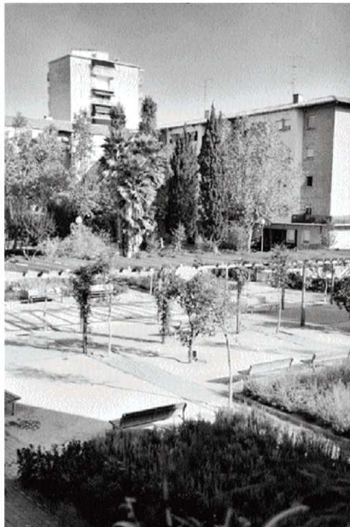
◀ ▶ Plaça Massana, aconseguida per la pressió popular després de treure el camp de futbol.