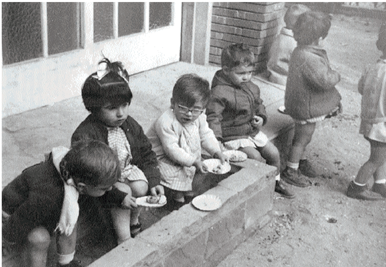
Guarderia de l'escola Pompeu Fabra, anys setanta.

quotes de pagament, de tal manera que els pagaments per l'escolarització variava en funció dels recursos de cada unitat familiar, les persones que més tenien eren les que pagaven més, i al contrari les que tenien recursos més migrats."