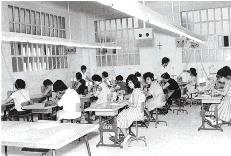
Taller de confecció.