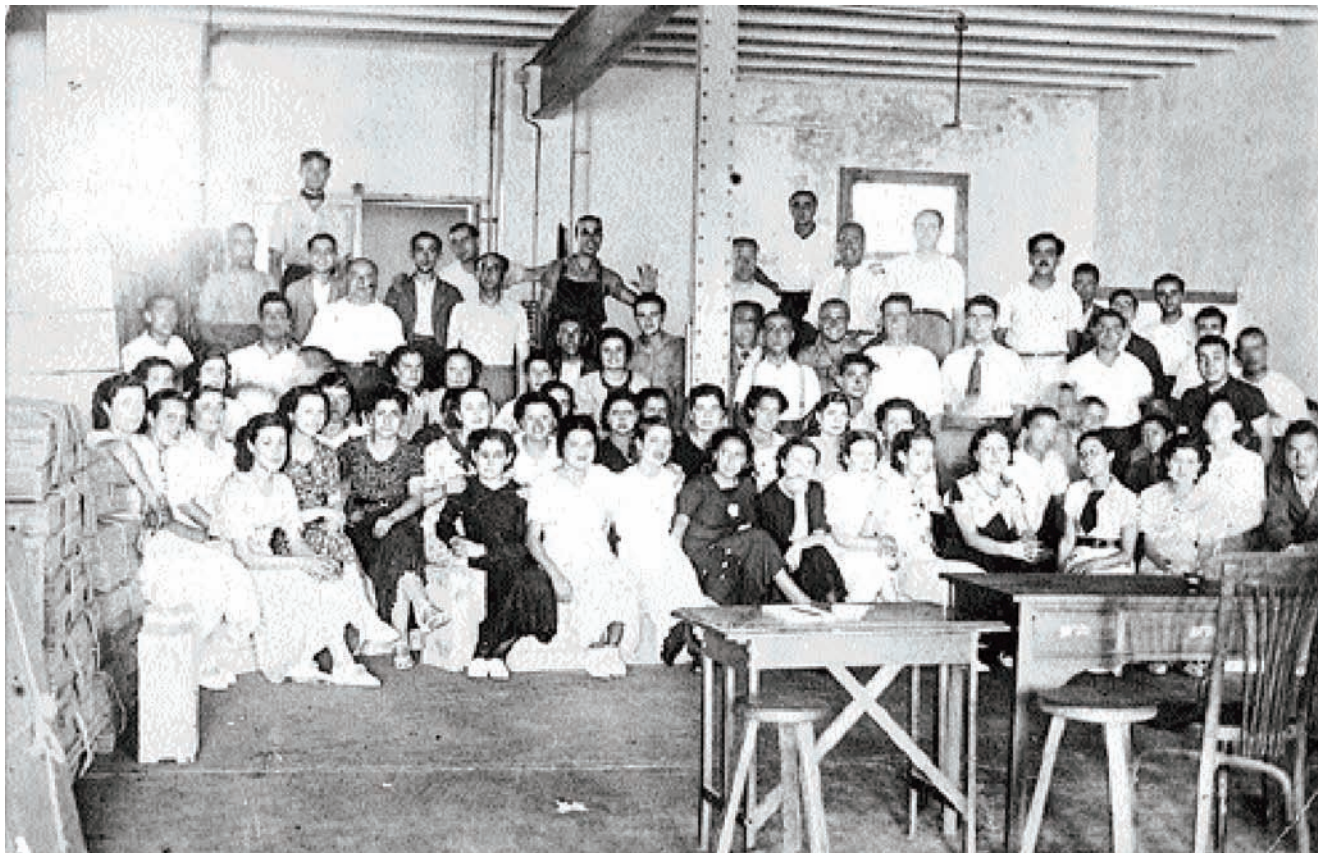
Treballadores i treballadors de Cafés Mrcilla, a principis dels anys trenta.