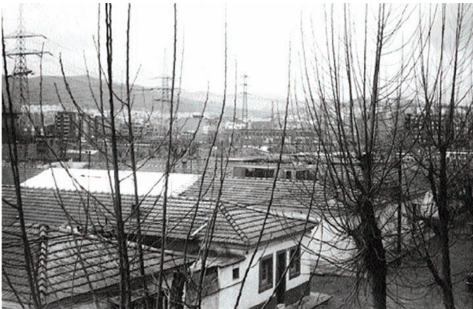
Cases Barates de Baró de Viver, anys seixanta.