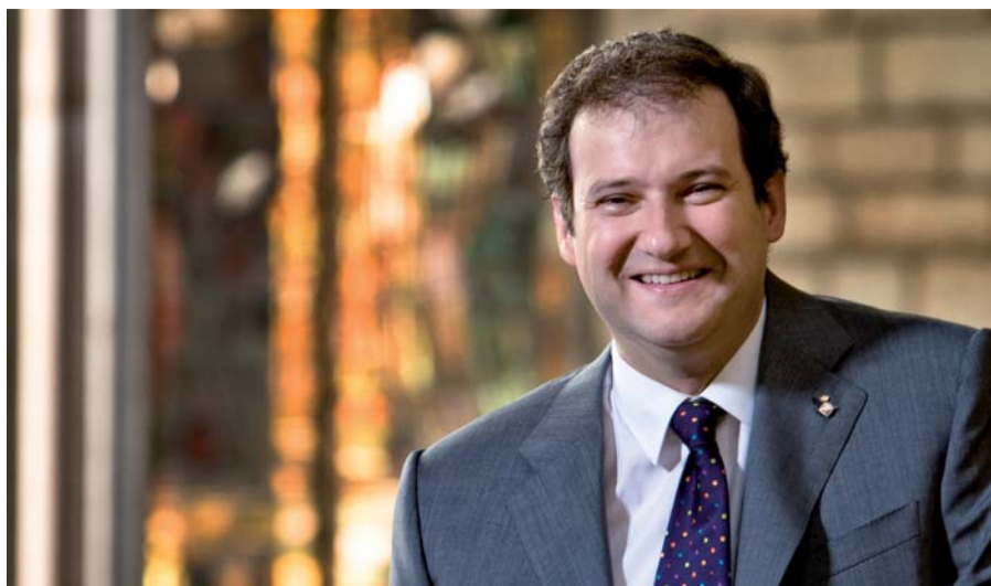
Jordi Hereu Boher, Alcalde de Barcelona

Davant l'esforç que suposa organitzar l'octubre de 2009 el II Congrés de les Dones de Barcelona, és un indicatiu de vitalitat de la nostra ciutat, i més concretament del seu Consell de les Dones, el repte d'impulsar paral·lelament la revista móndonesbcn .