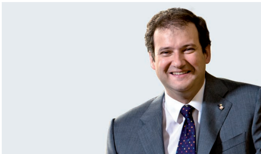
Jordi Hereu Boher, Alcalde de Barcelona

Encarem el darrer any de mandat conscients de la profunditat de la crisi econòmica que colpeja tantes famílies i persones de la nostra ciutat. Des de l'Ajuntament de Barcelona, amb més fermesa que mai, és hora de posar totes les energies, tots els esforços i totes les capacitats per resoldre els problemes quotidians dels barcelonins i les barcelonines. I ho farem barri a barri, sector a sector, col·lectiu a col·lectiu, des de la proximitat.