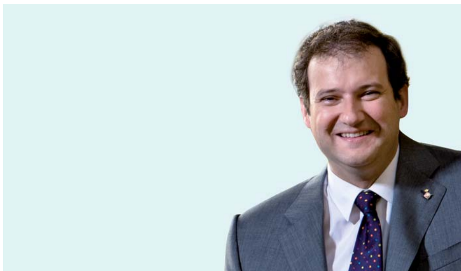
Jordi Hereu Boher, alcalde de Barcelona

Barcelona commemora un any més el 8 de març, Dia Internacional de totes les dones. Un dia ple de reivindicacions i d'esperances.