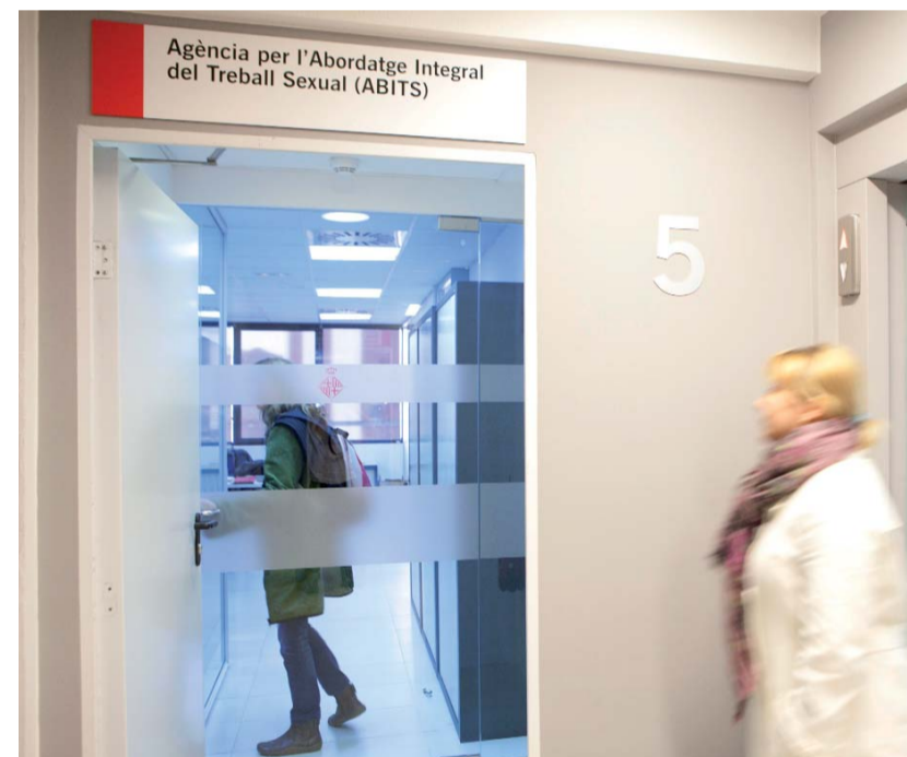
L'Agència per a l'abordatge integral del treball sexual.