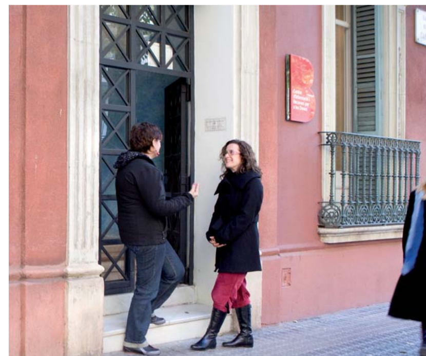
Dones parlant a l'entrada del CIRD.