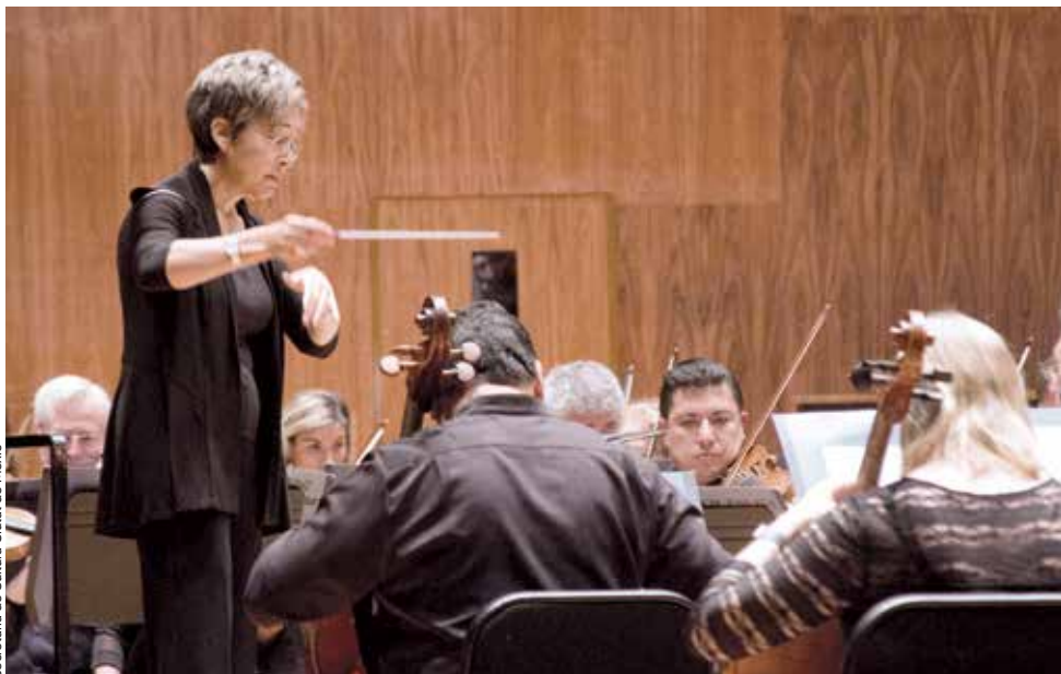
Secretaria de Cultura Ciutat de Mèxic

En relació amb l' accés , aquest ja està força normalitzat pel que fa a la formació, a la pràctica artística i al consum de cultura; de fet, la majoria de públic són dones. 1 Així doncs, les dones gaudeixen de la vida cultural de la comunitat, frueixen de l'art i comparteixen els avenços científics i els seus beneficis. Però en participem en igualtat de condicions? La Declaració de Friburg també esmenta la importància no només de tenir accés a la cultura i “consumir-la”, sinó també de “la llibertat de desenvolupar i compartir coneixements i