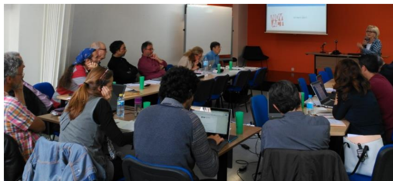
Detall de la Jornada internacional d'experts de moneda social a Barcelona

Durant el 2017 s'han posat les bases per a la presentació pública de la moneda ciutadana en el primer trimestre de 2018. Els elements clau formats pels models monetari, jurídic, tecnològic, de participació, de governança, comunicatiu i d'avaluació s'han anat teixint, donant lloc als conceptes bàsics com: "moneda ciutadana", basada en tecnologia digital, per promoure el comerç de proximitat i