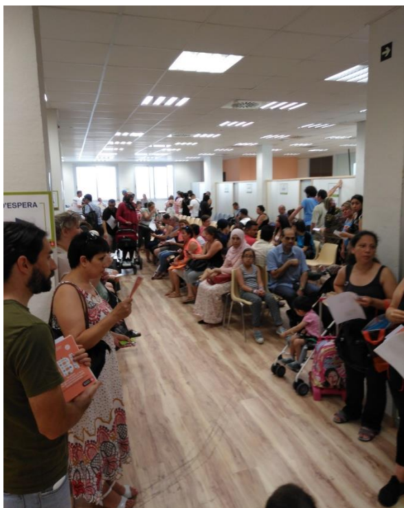
Detall d'una de les sessions informatives del 17 de setembre

A continuació es mostren algunes de les principals dades d'avaluació del procés de sessions informatives