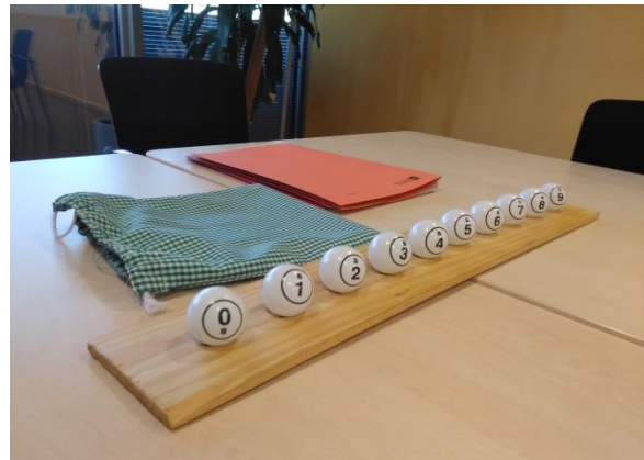
Detall del sorteig realitzat el 17 de novembre de 2017

Reptes: Com qualsevol avaluació d'impacte d'un disseny experimental, l'avaluació presenta alguns reptes importants. Part de la tasca d'Ivàlua ha estat identificar els riscos principals per treball conjuntament amb l'Ajuntament per reduir-los al màxim en el disseny i la implementació. En primer lloc, en qualsevol avaluació d'impacte és important fer un seguiment tant d'aquelles llars que participen del programa, com d'aquelles que han quedat en el grup de comparació. El repte, en aquest cas, és aconseguir que la taxa de resposta a les enquestes sigui elevada en ambdós grups. per tal d'evitar els biaixos derivats d'una manca de respostes.