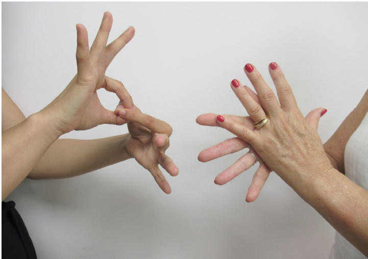
Dues persones comunicant-se amb llengua de signes