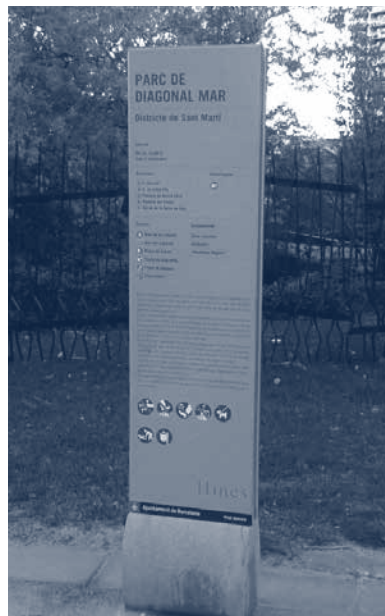
Figura 2.- Senyalística del parc de Diagonal Mar on apareix l'empresa que va urbanitzar la zona, HINES

afectar gairebé 116 hectàrees de sòl industrial, l'equivalent a 120 illes de l'Eixample. El nom 22@ traslladat al territori com a districte provenia de la requalificació d'antics sòls qualificats com a industrials a l'original PGM del 1976, els quals rebien l'etiqueta cadastral 22a. El pla es va emmarcar dins el document de modificació del Pla general metropolità de l'any 2000 (Ajuntament de Barcelona, 2000). Es pretenia que fos flexible, ja que, com ell mateix reconeixia, la complexitat de les transformacions, així com les operacions que pretenia impulsar l'Ajuntament de Barcelona, juntament amb aquelles desenvolupades per la iniciativa privada, així ho exigien. Tal com recollia la seva introducció, la finalitat del pla era enfrontar-se al repte de la nova economia, proposant el Poblenou com “la principal plataforma econòmica i tecnològica de Barcelona, Catalunya i Espanya,