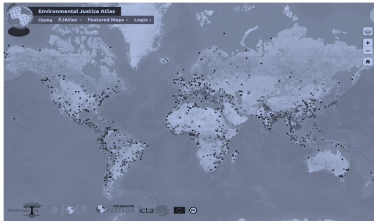
Figura 1. Primera pàgina de l'Atlas de Justícia Ambiental. Els conflictes tenen un codi de color

L'Atlas de Justícia Ambiental és un inventari en línia d'aquests conflictes ecológicodistributius en funció del coneixement acadèmic i activista. Es va iniciar el 2012 i ha arribat a les 3.150 entrades el maig del 2020, cosa que permet un nou