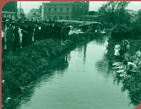
Inauguració de les obres de desviament del Rec Comtal (1916).

Amb la finalitat de preservar la memòria col·lectiva d'aquesta gran infraestructura hidràulica de la nostra ciutat, l'Ajuntament de Barcelona i l'Ajuntament de Montcada i Reixac impulsen conjuntament un Pla Director per recuperar el traçat del Rec Comtal en 33 punts de l'espai públic, així com en excavacions en sòl privat, repartits al llarg dels seus gairebé 13 quilòmetres de longitud.