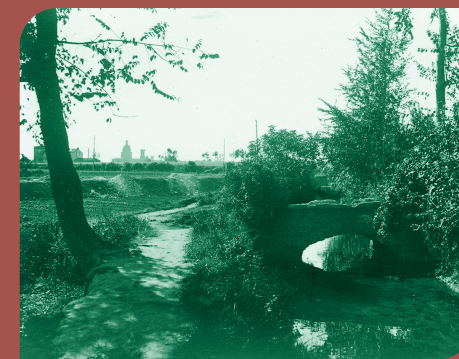
El Rec Comtal amb el pont del Paixeret (1928).

El Rec Comtal era un gran canal hidràulic obert que va abastir d'aigua la ciutat des del segle X fins a mitjans del segle XX. Va ser una artèria vital a Barcelona i un important motor econòmic, productiu i social. En un primer moment, va proporcionar energia hidràulica als molins fariners de propietat comtal. I més endavant, va ser clau pel que fa a la industrialització, especialment en les fàbriques tèxtils de Sant Andreu i Sant Martí.