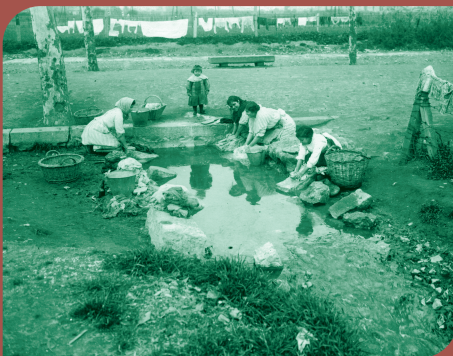
Plaça de les Glòries, a prop dels Encants (1917).

Aquesta iniciativa vol dignificar i donar a conèixer el valor patrimonial i social de la sèquia medieval, que va esdevenir espai de socialització de les classes populars barcelonines. El canal cobrarà vida de nou a través d'espais públics, de repòs i d'interpretació de les restes arqueològiques, amb la creació d'un eix interurbà naturalitzat que garantirà la protecció dels vestigis d'una infraestructura clau per entendre el creixement i l'evolució de Barcelona en els darrers segles.