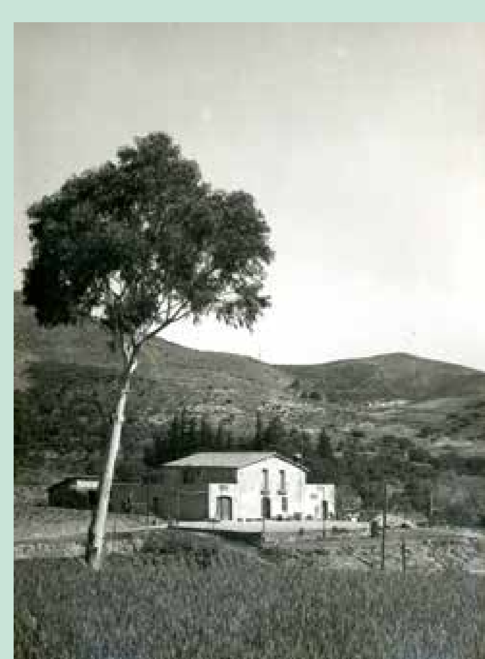
A l'esquerra, Can Guineueta, una de les masies més antigues de la zona. A la dreta, el plànol del Polígon de la Guineueta de l'Obra Sindical del Hogar —el parc n'esdevindria frontera, a l'altra banda del carrer del Castor— i una vista aèria del barri als anys seixanta, quan començaven a construir-se els primers blocs.

L'origen del parc es remunta al d'enllaços de Barcelona ciutat (1917), dels arquitectes Romeu i Porcel. Però caldria esperar al Pla comarcal del 1956 perquè el projecte prengués volada. La Comissió d'Urbanisme va treure a concurs el seu disseny el 1962, i es va enllestir el 1968. Ocuparia 6,2 hectàrees. El parc de la Guineueta va donar resposta a la necessitat de zones verdes a la barriada, que durant el desenvolupisme va acollir gran quantitat d'immigrants de la resta de l'Estat.