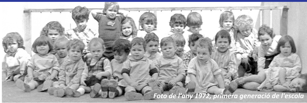
Foto de l'any 1972, primera generació de l'escola

L'any 1972 tres educadores van obrir l'Escola Bressol El Cargol en un petit entresol del carrer de Sant Alexandre, a Horta. L'objectiu va ser oferir un espai educatiu per a famílies treballadores del barri amb infants de 0 a 3 anys i cobrir una nova necessitat social: les mares que treballaven o s'incorporaven al món laboral podrien deixar-hi amb tranquil·litat els seus infants, sabent que se'ls atendria i educaria.