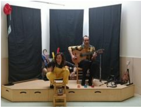
Tal com sona, setmana de la música