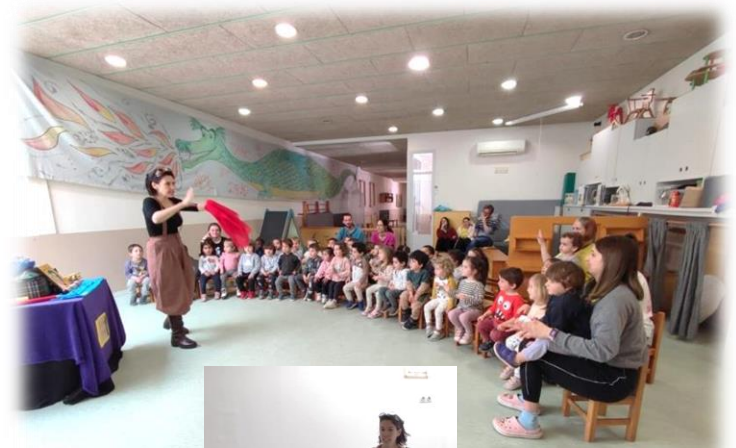
Conta Contes, setmana del conte