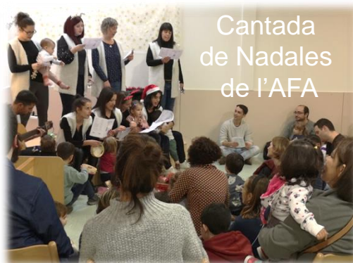
Cantada de Nadales de l'AFA