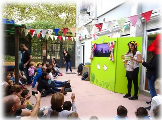
Representació del Patufet per famílies de l'Associació de Famílies d'Alumnes (AFA)