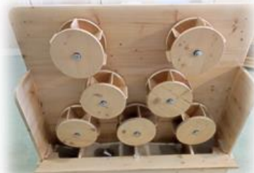
LAB sobre rodes