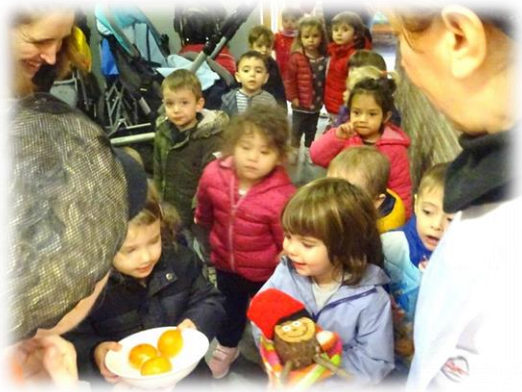
El Tió de nadal