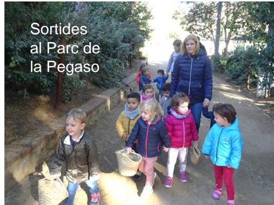
Sortides al Parc de la Pegaso