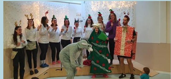
Cantada de Nadales