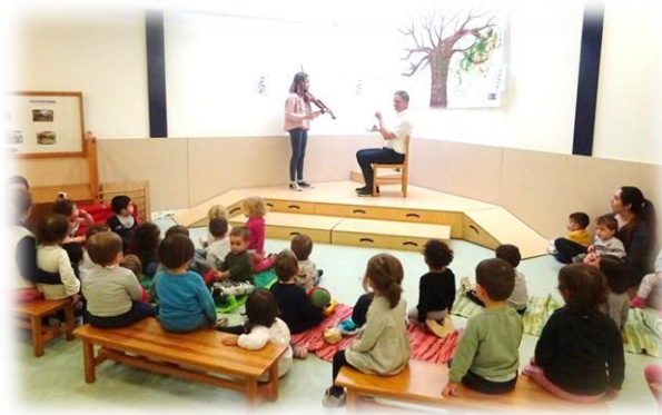
Santa Cecília: Setmana de la música