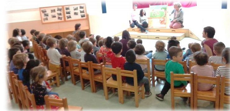
Setmana del conte, Sant Jordi.