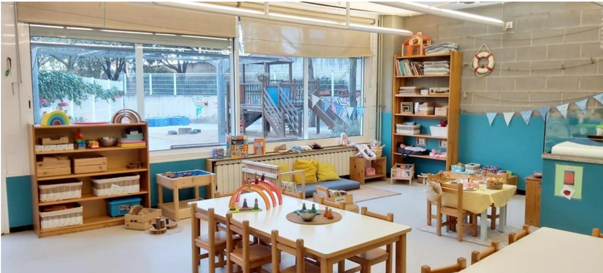
Estança 2-3 anys "Petxines"