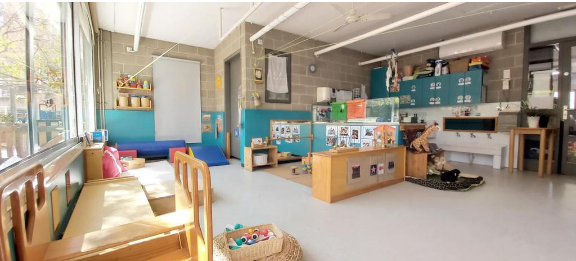
Estança 1-2 anys "Balenes"