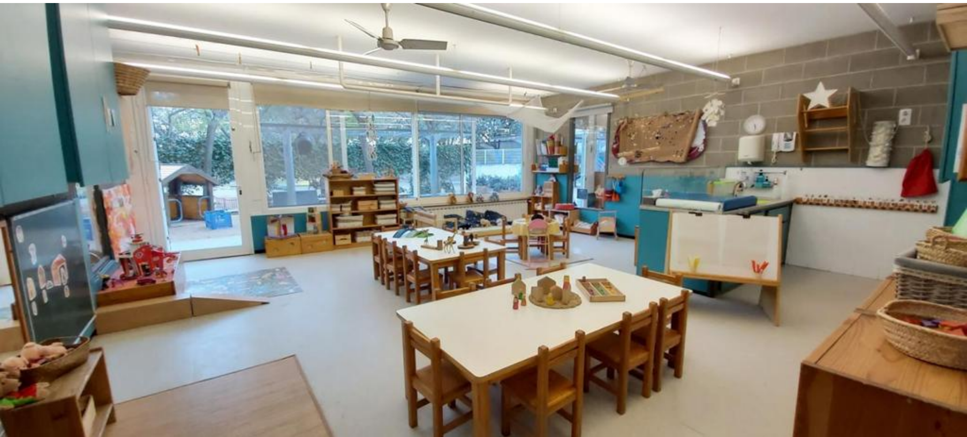
Estança 2-3 anys "Pops"