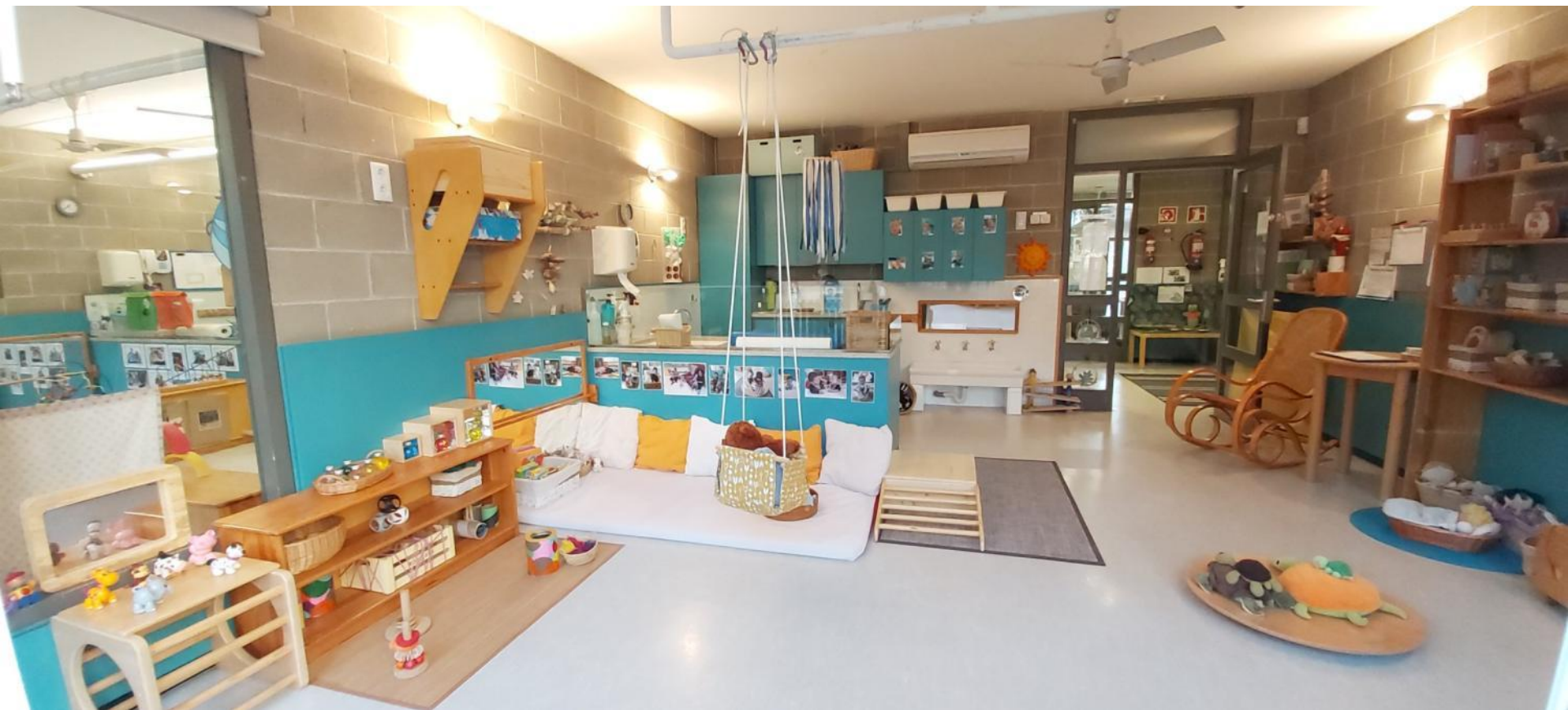
Estança Lactants "Tortugas"