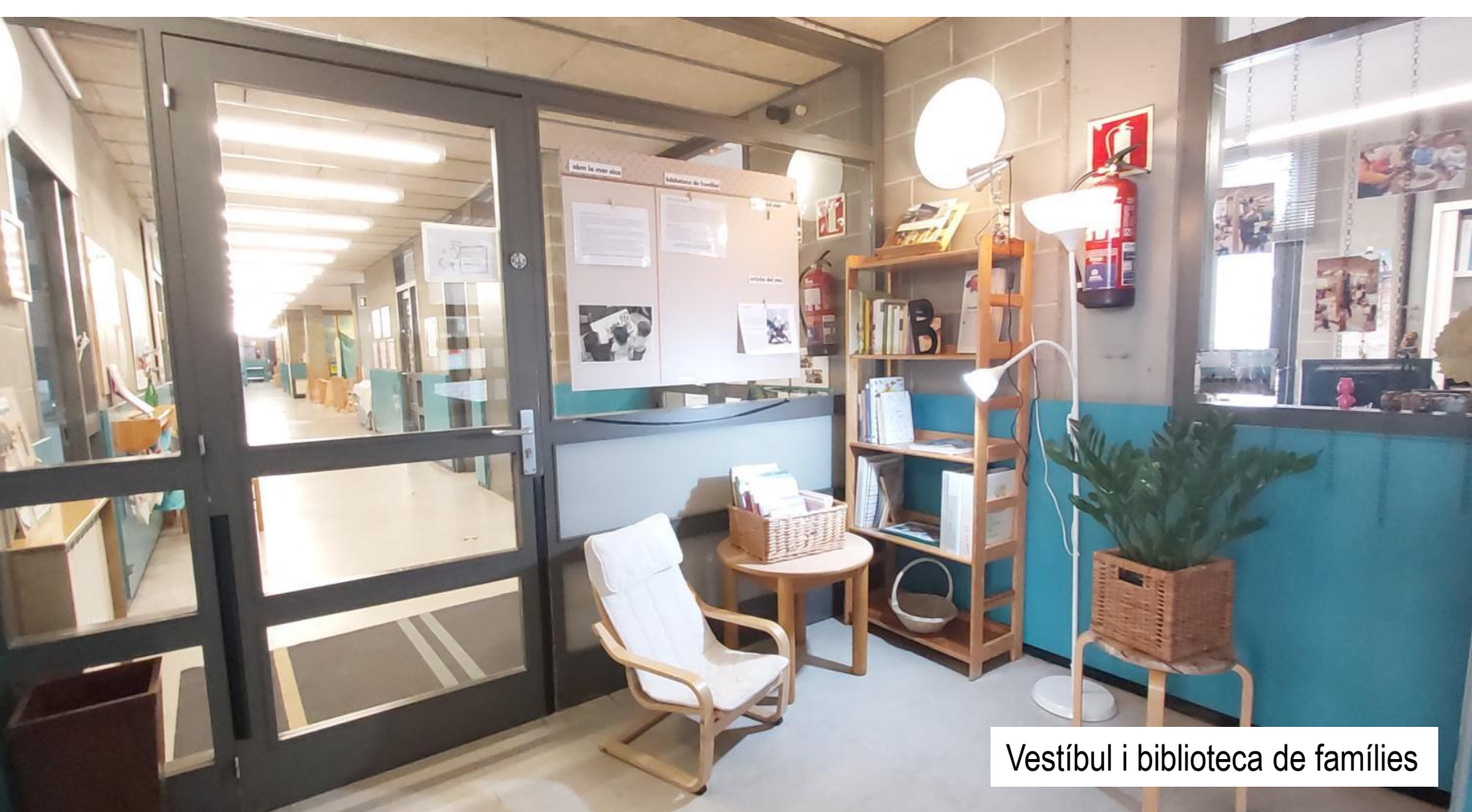
Vestíbul i biblioteca de famílies