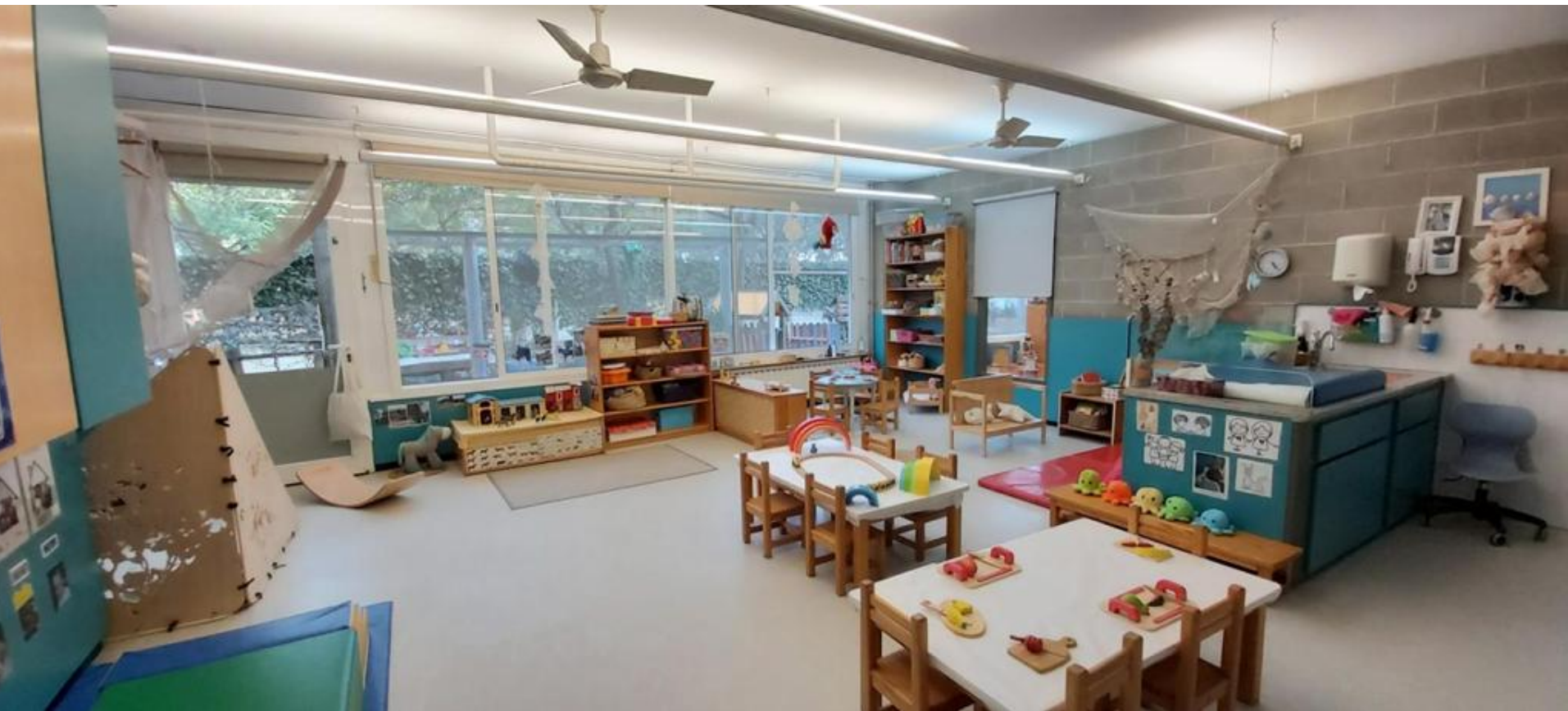
Estança 1-2 anys "Crançs"