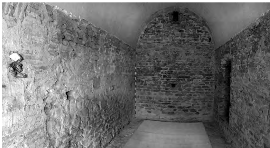
Vista interior de la planta baixa de la torre romànica.

A la planta inferior, els murs de la torre romànica tenen una amplada d'1 m i configuren un espai interior de 20 m 2 . Les plantes inferiors de les torres de defensa eren espais destinats al magatzem de queviures; en el cas de Can Fargas, en el decurs de la intervenció arqueològica del