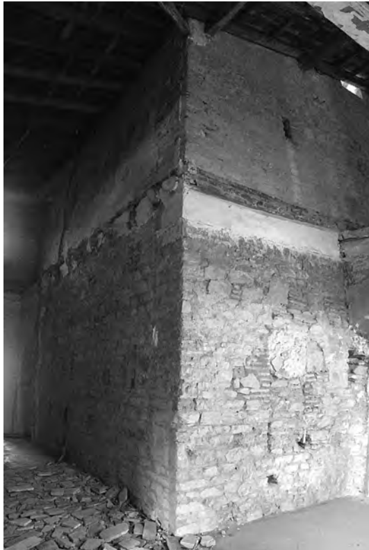
Vista de l'exterior de la torre on es pot apreciar la tipologia constructiva dels paraments i les restes dels enlluïts a les cotes més altes dels murs.