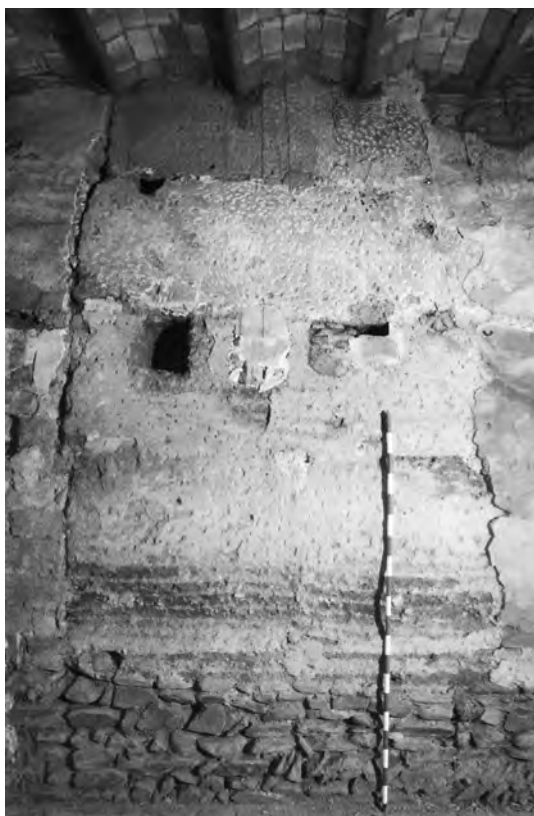
Mur de tàpia que forma part del cos annex datat del segle XIII.

De la fase més antiga de la torre, de finals del segle XI-XII, s'han localitzat alguns dels forats realitzats per aixecar la bastida en el moment de la seva construcció. També s'ha localitzat una obertura d'una finestra per a l'entrada de llum situada en la zona alta del mur occidental, ubicada a uns 4 m d'altura. Aquesta finestra està parcialment tallada i tapiada a l'extrem exterior per la volta de la sala annexa datada del segle XVII. Presenta restes de l'enlluït de finals del segle XVIII o principis del segle XIX, com també passa en altres obertures medievals reaprofitades amb altres finalitats en èpoques més recents.