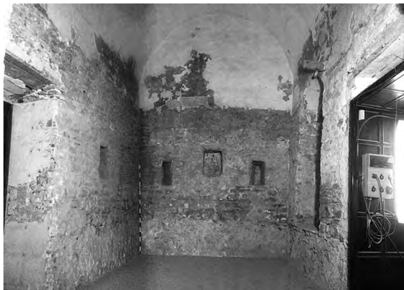
Interior de la torre a la planta primera.

La porta d'accés a la torre era al mur nord, a uns 5 m per sobre del nivell del terreny geològic. Aquesta porta es conserva parcialment, en queden cinc dovelles i part dels dos muntants; també s'ha pogut documentar part del paviment de maons, possiblement relacionat amb les darreres fases d'ús. La