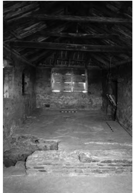
Vista de l'interior de la torre a la segona planta.

porta fou tapiada amb maons al segle XVII, en el decurs de les reformes que va patir la masia quan es construï l'escala d'accés al segon pis, fet que va motivar l'obertura d'una nova porta en el mateix mur septentrional.