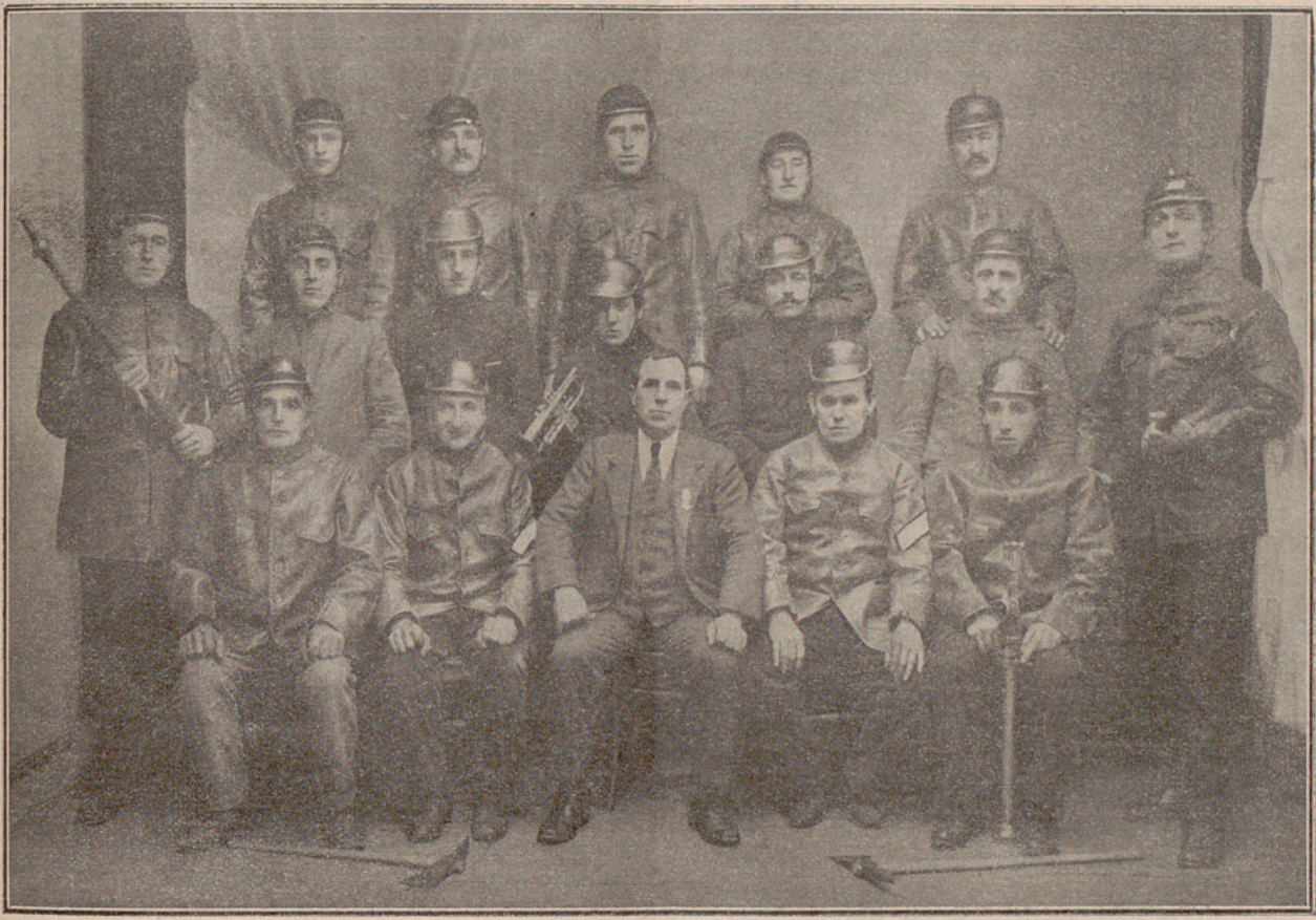
Cuerpo de Bomberos de Eibar

CUERPO DE BOMBEROS BARCELONA 7- 12- 97 BIBLIOTECA