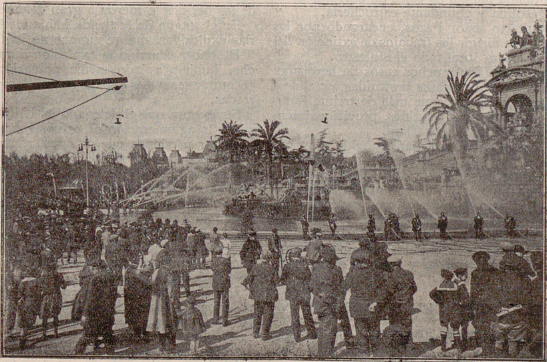
Pruebas del material de incendios adquirido por el Ayuntamiento de Barcelona.

GUERPO DE BOMBEROS BARCELONA 7-12-97 BIBLIOTECA