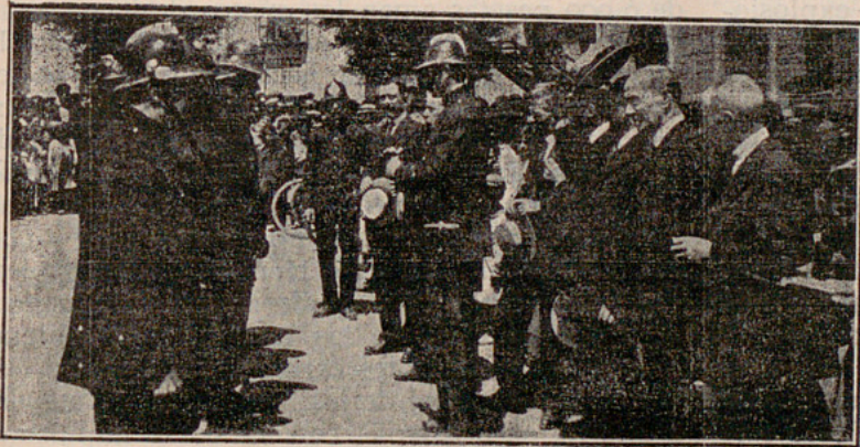
El alcalde pronunciando un discurso delante de los que se les ha de imponer la medalla del Ayuntamiento.