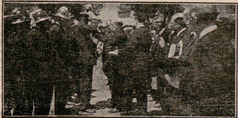
El alcalde imponiendo la medalla a uno de los Jefes.