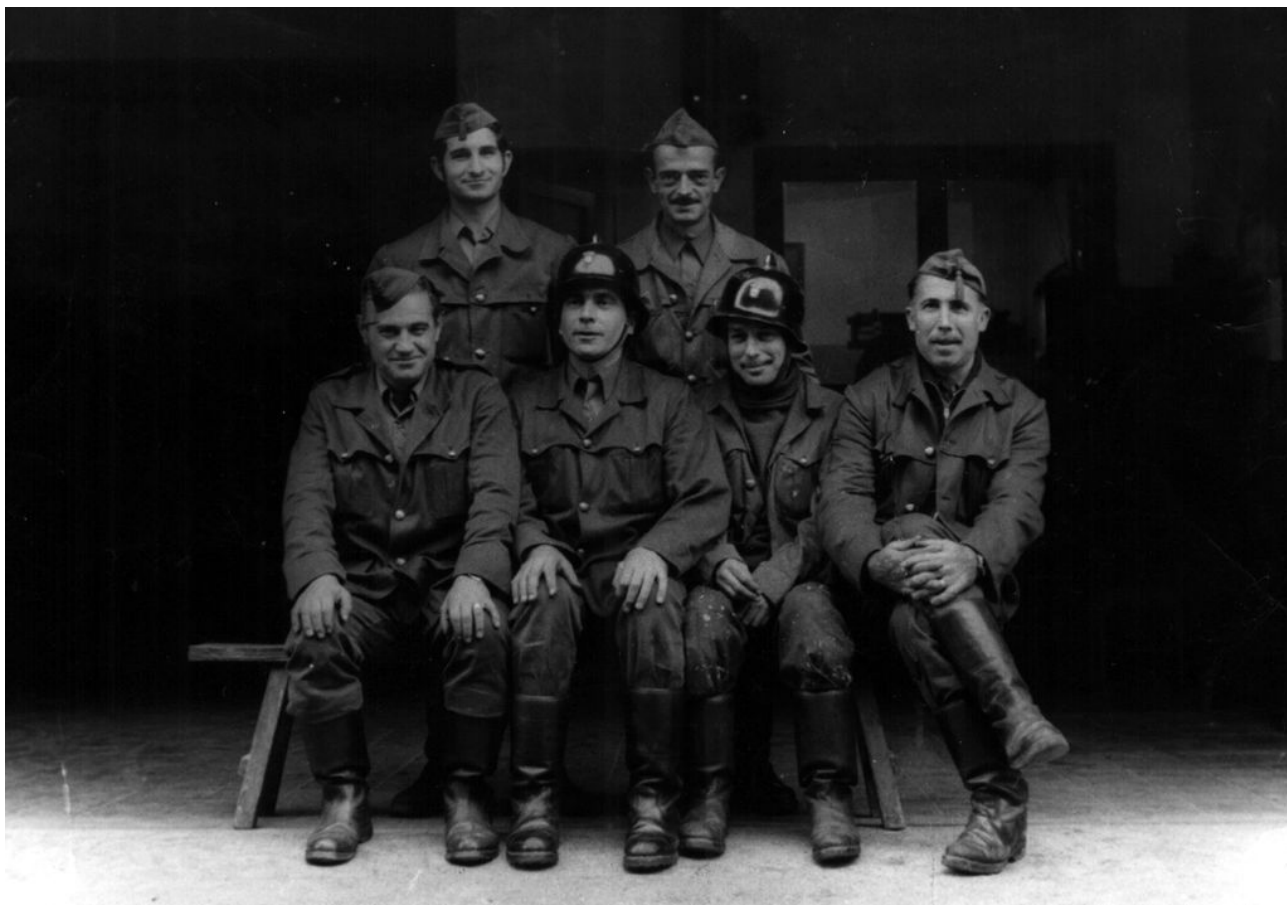
Bombers de Terrassa l'any 1968.