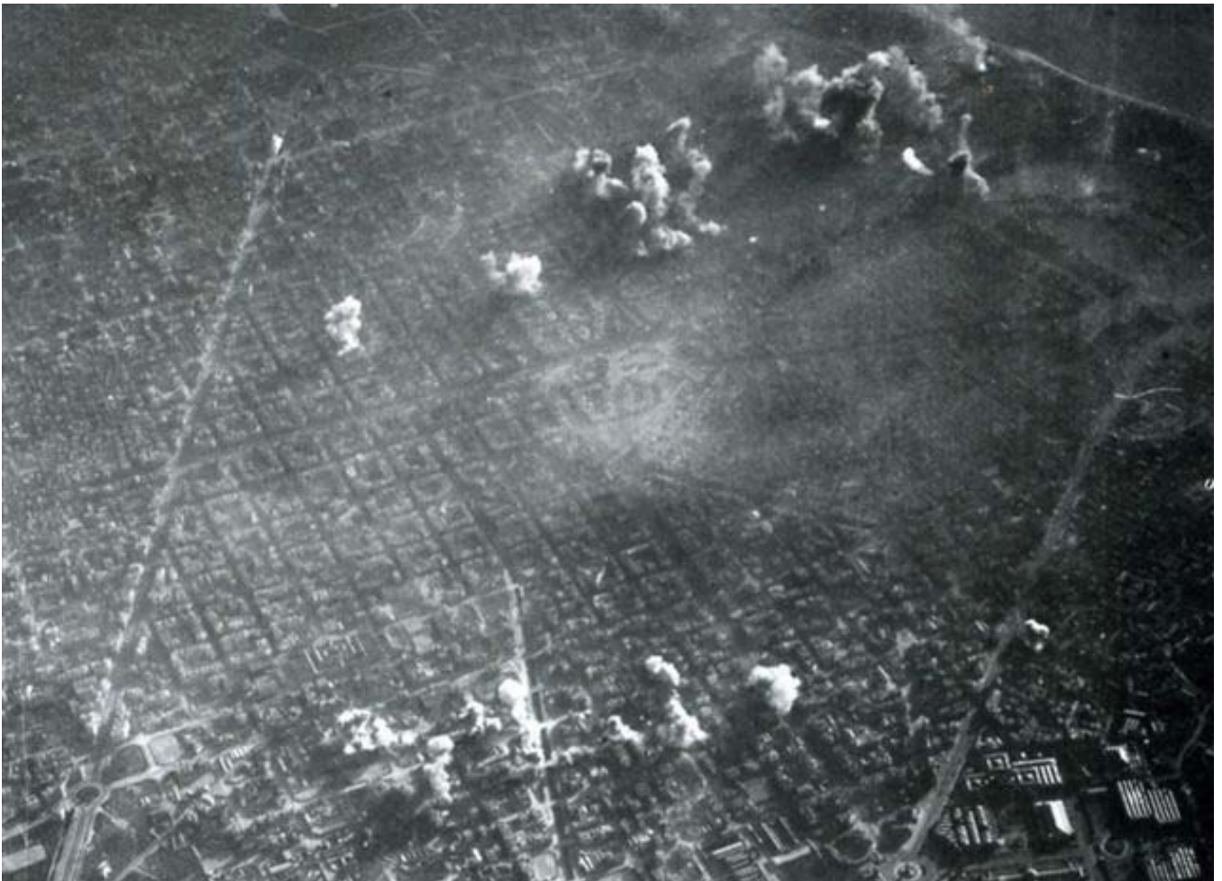
Barcelona bombardejada el març de 1938

* Silvia Marimón és periodista