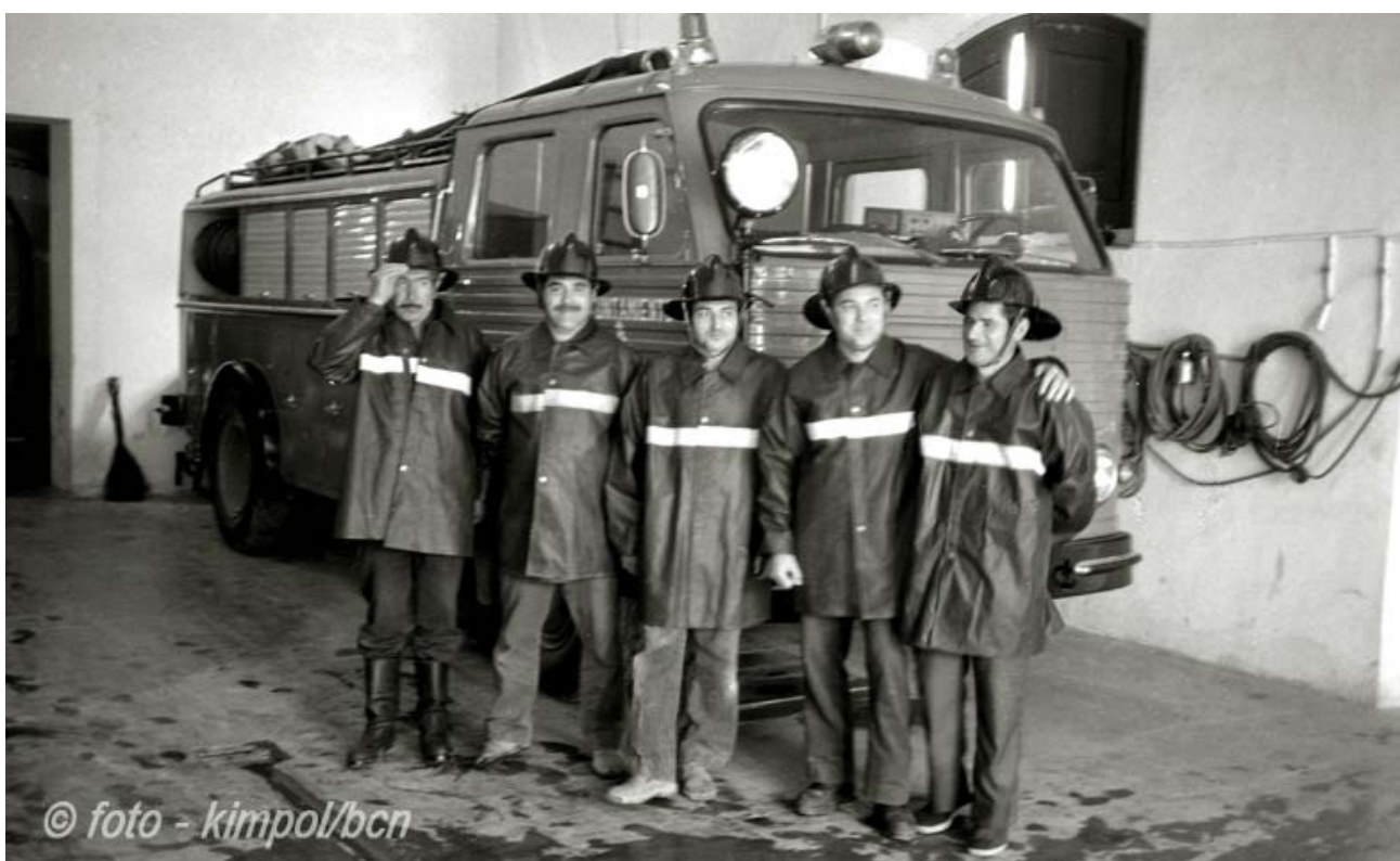
Bombers de Girona l'any 1975.