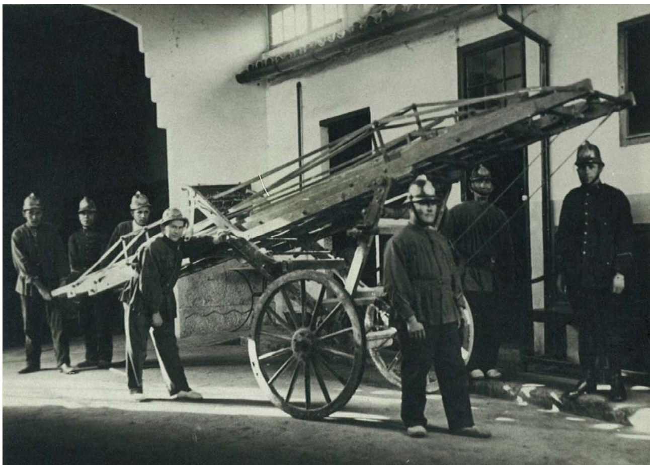
Bombers de Sabadell l'any 1927.