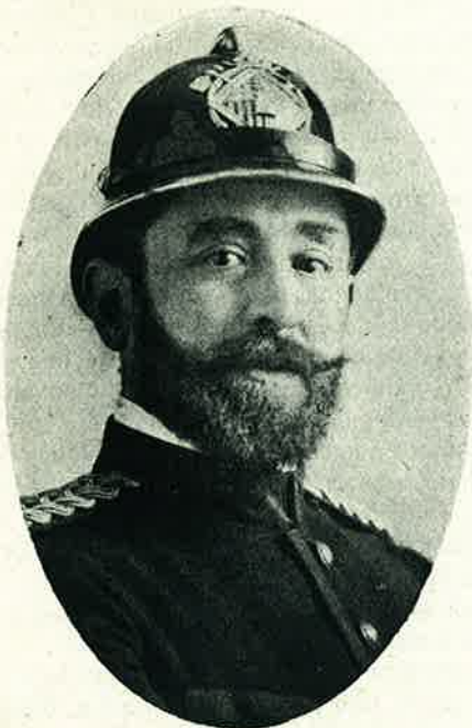
Ilustre Arquitecto, Jefe de bomberos de Barcelona