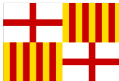
Bandera de Barcelona