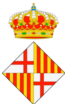
Escut de Barcelona