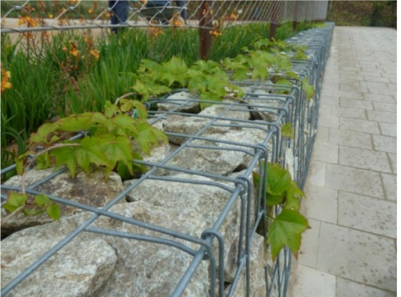
Jardí de Torrent Maduixer