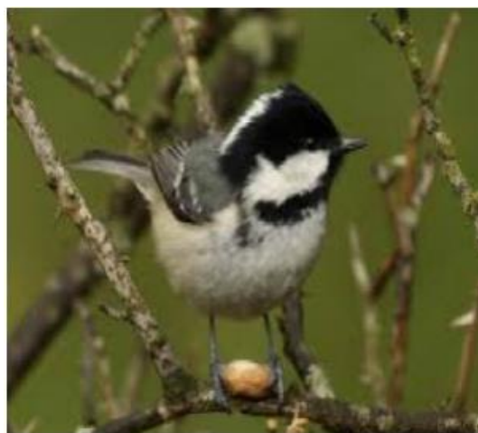
Mallerenga petita ( Parus ater )