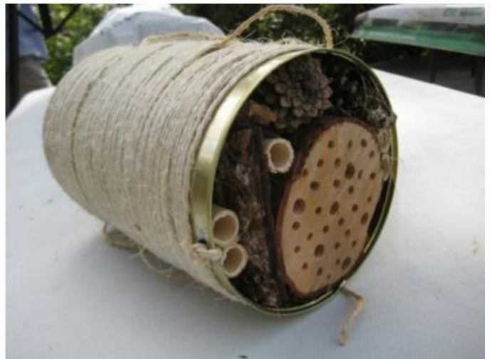
Refugi d'abelles casolà fet al Taller "Fes de casa teva un jardí"