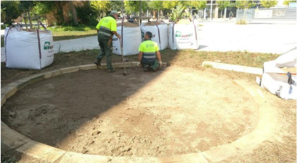
Fangar d'orenetes Carrer del Perelló

Són espais de superfície i forma variable que es mantenen lliures de vegetació espontània, en els quals hi ha disponibilitat de substrat argilós.