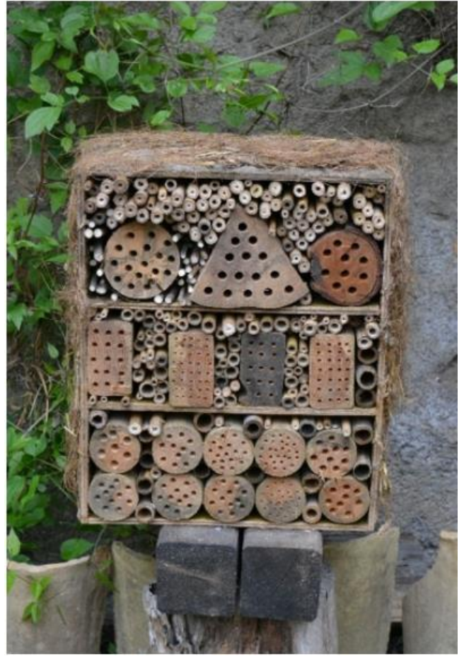
Refugi d'abelles casolà