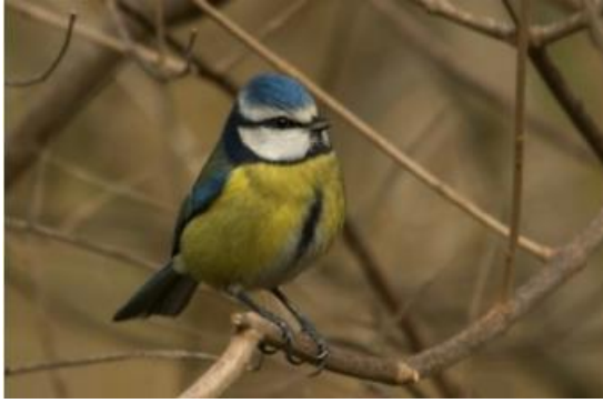
Mallerenga blava ( Cyanistes caeruleus )