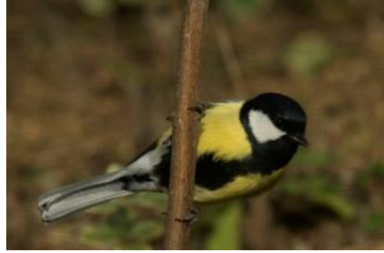
Mallerenga carbonera ( Parus major )