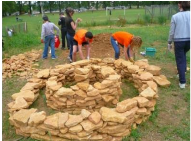
Construcció del mur de pedra en espiral