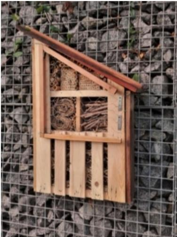
Refugis d'abelles de l'hort de la Trinitat