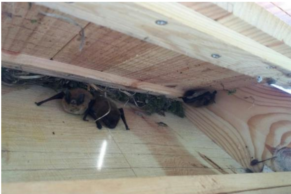
Pipistrel·la comuna ( Pipistrellus pipistellus ) Hort de Can Soler

La manca de boscos madurs i els nous sistemes constructius suposen una dificultat important perquè aquests mamífers trobin refugis adequats, en forma de forats i escletxes, en un context urbà. Podem, doncs, instal·lar nius artificials o caixes niu per oferir-los substrats de cria.