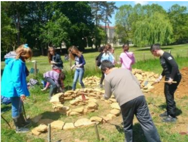
Disseny en planta de l'espiral