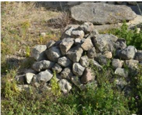
Roquissar de jardí privat

Acumulacions de pedres de diferents grandàries.