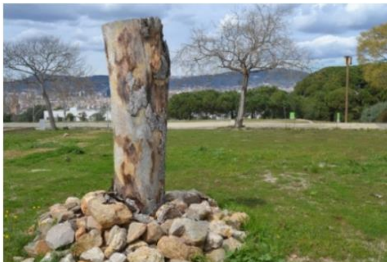
Biotroncs Jardí de Petra Kelly