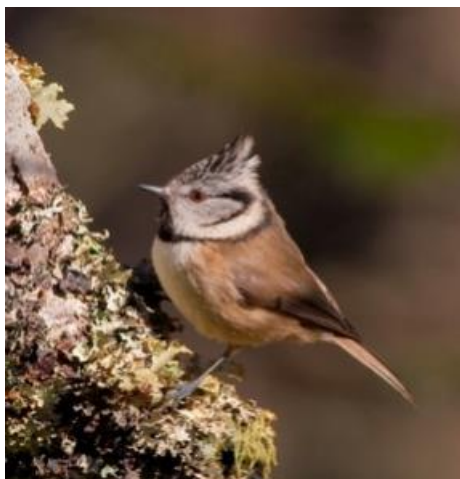
Mallerenga emplomallada ( Lopophanes cristatus )