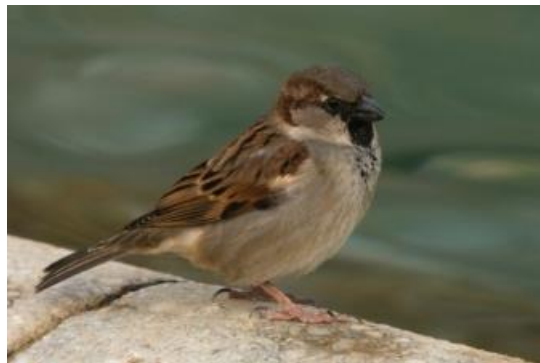
Pardal comú ( Passer domesticus )

Constitueix una bona pràctica a favor de la biodiversitat i un exemple de gestió ecològica dels espais verds de la ciutat.