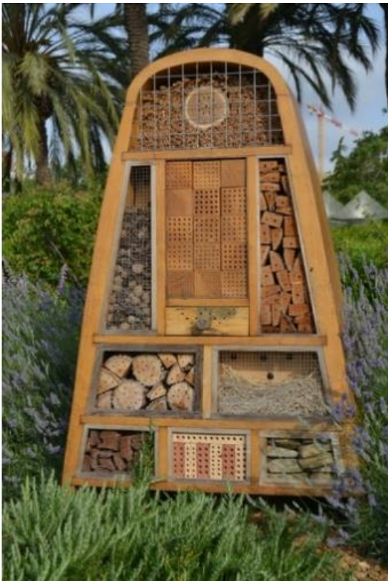
Refugi d'abelles del Roserar de Cervantes

Les abelles i vespes solitàries desenvolupen funcions ecològiques de primer ordre, com la pol·linització i el control biològic de les plagues que afecten la vegetació dels parcs i jardins. Potenciar-ne la presència contribueix a promoure la biodiversitat urbana i és una alternativa a l'ús de productes químics, en benefici de la salut de les persones.