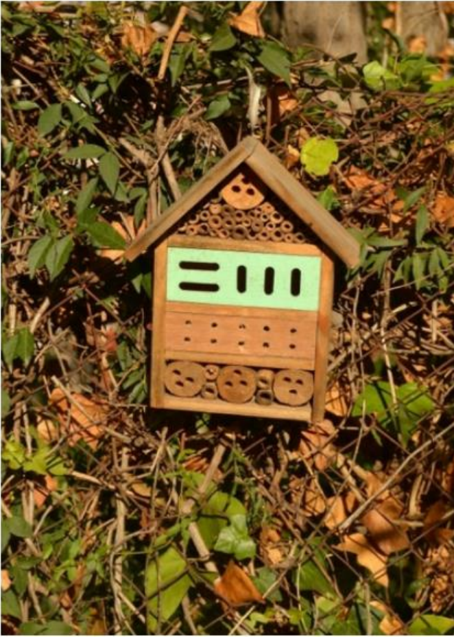
Refugi d'abelles prefabricat Escola del Bosc (Montjuïc)