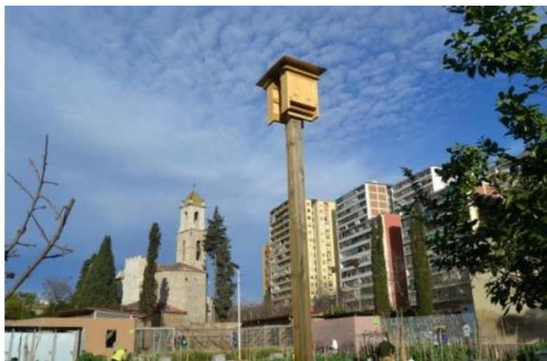
Torre de ratpenats Hort de Can Cadena

Són caixes niu elevades mitjançant un tutor (3 metres, aproximadament), que ofereixen llocs adequats per allotjar colònies de cria de ratpenats.