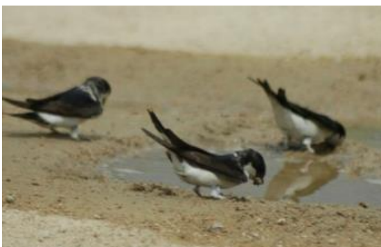
Oreneta cuablanca ( Delichon urbica )

A les ciutats les orenetes tenen dificultats per obtenir fang per construir els seus nius, que solen situar sota ràfecs i balcons dels edificis. Tant l'oreneta vulgar ( Hirundo rustica ) com l'oreneta cuablanca ( Delichon urbica ) són especialistes a alimentar-se d'una gran quantitat d'insectes voladors, entre ells els mosquits, i per tant, ajuden a disminuir les poblacions d'aquests insectes molestos. De fet, es calcula que una parella d'orenetes pot consumir de l'ordre de 2.500 insectes al dia i, per tant, actuen com a autèntics insecticides naturals. Amb aquest fangar afavorim la presència d'orenetes a la ciutat.