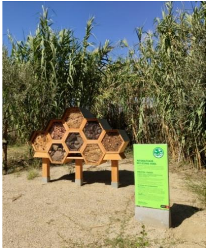
Refugi d'abelles de l'hort de Baró de Viver