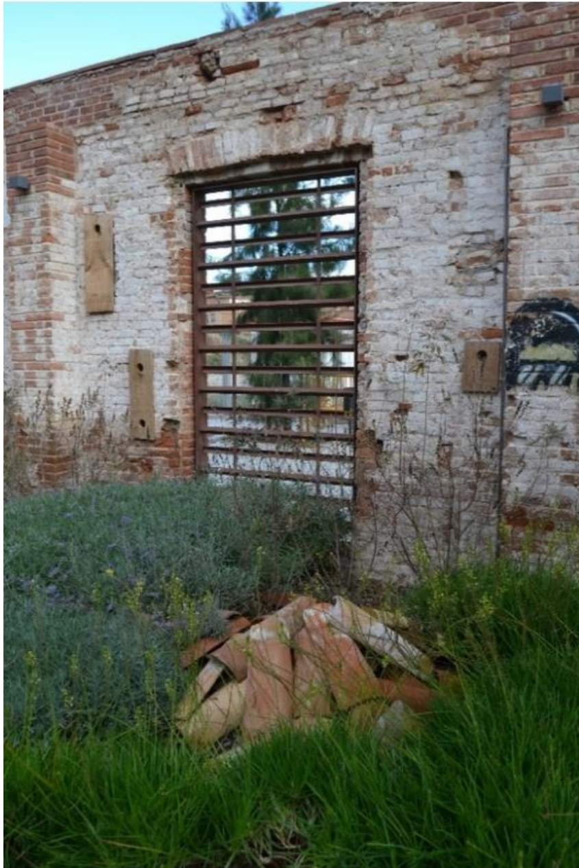
Refugi de biodiversitat. Fàbrica de Ca l'Alíer