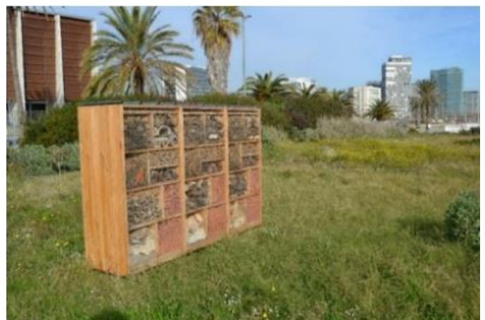
Refugi d'abelles del pg. Marítim del Bogatell