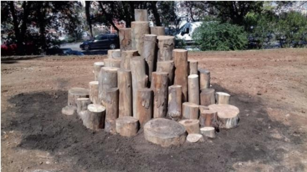
Piràmide de fusta del Polvorí Montjuïc

Els troncs de major longitud se situen al centre de l'estructura, i al voltant d'aquests es col·loquen troncs de longitud menor. En qualsevol cas, la forma piramidal de l'estructura respon a qüestions estètiques i es pot experimentar creant altres formes geomètriques o més desorganitzades. Cal tenir en compte que són estructures efímeres que s'aniran consumint amb el pas del temps.