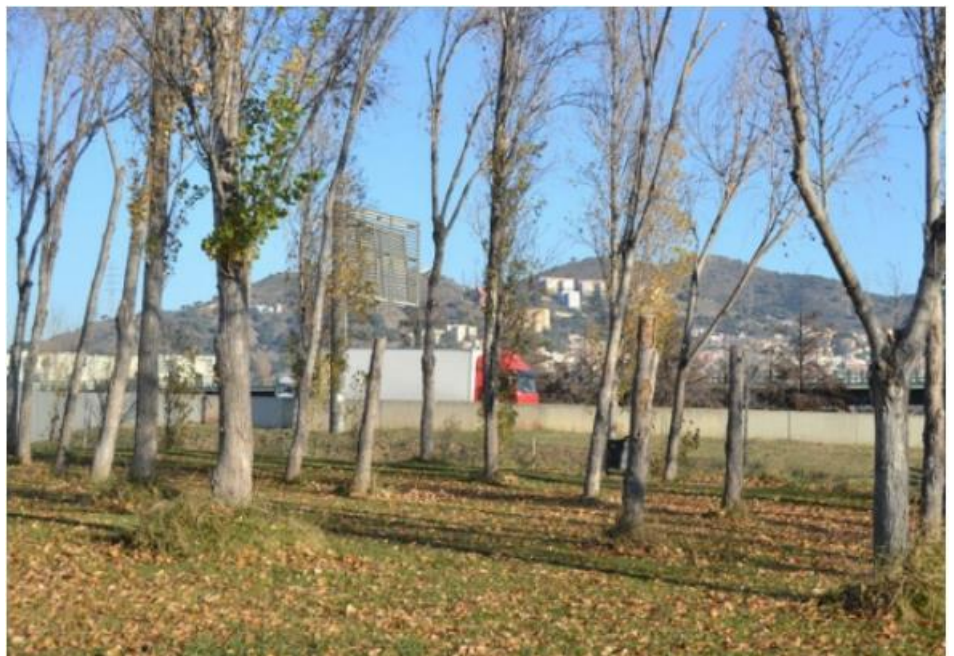
Biotrons Parc de la Trinitat