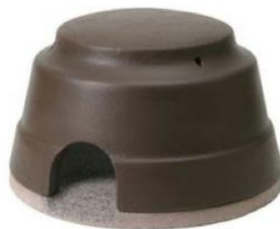
Niu prefabricat per eriçó