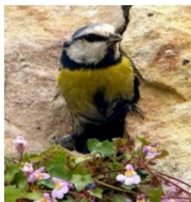
Mallerenga blava ( Cyanistes caeruleus )