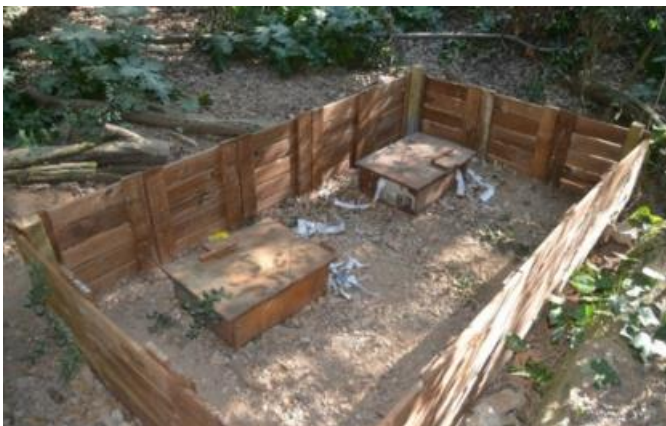
Tancat per eriçons amb caixes niu de fusta Parc del Laberint d'Horta

Són caixes que permeten oferir possibilitats de refugi i cria a les poblacions d'eriçons de la ciutat.