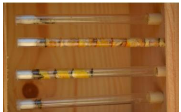
Sistema de nidificació utilitzat per les abelles i vespes solitàries