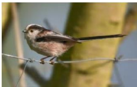
Mallerenga cuallarga ( Aegithalos caudatus )