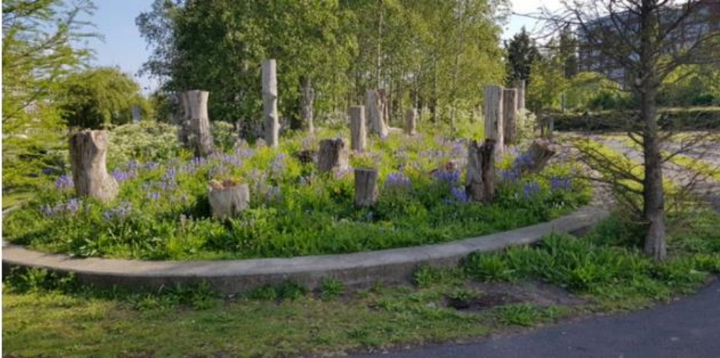
Exemple d'agrupació de biotrons Park Schinkeileilanden. Amsterdam