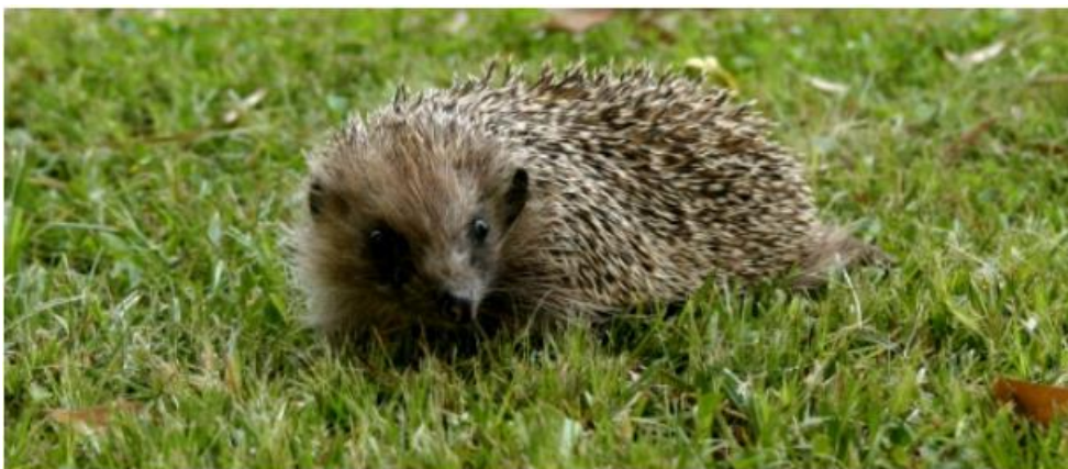
Eriçó europeu ( Erinaceus europaeus )

L'eriçó no excava el terra per fer caus, sinó que busca forats d'arbres vells o morts que estiguin al seu abast, espais sota munts de llenya, racons que deixen pedregars o bé a l'interior de masses arbustives denses, amb la condició que romanguin secs en dies plujosos. A l'interior d'aquestes cavitats construeix un niu confortable i càlid, de forma esfèrica, fet amb branquillons, herba seca, fulles, pals, molsa i altres elements similars que troba pels voltants.