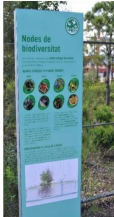
Refugis de biodiversitat Plaça de les Glòries