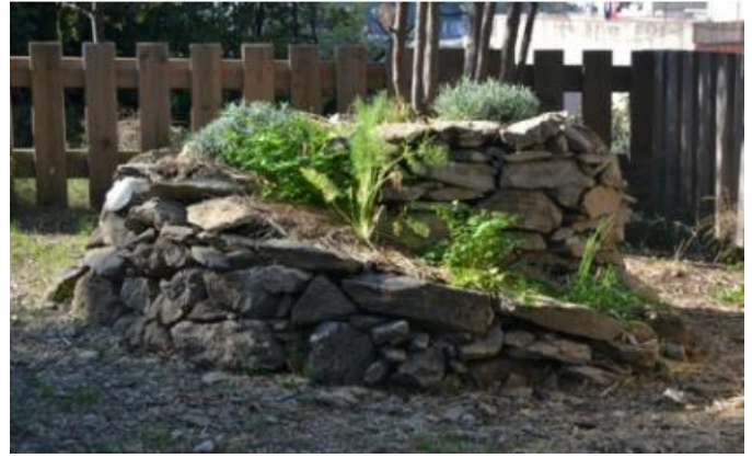
Espiral de pedra seca dels jardins de la UPC