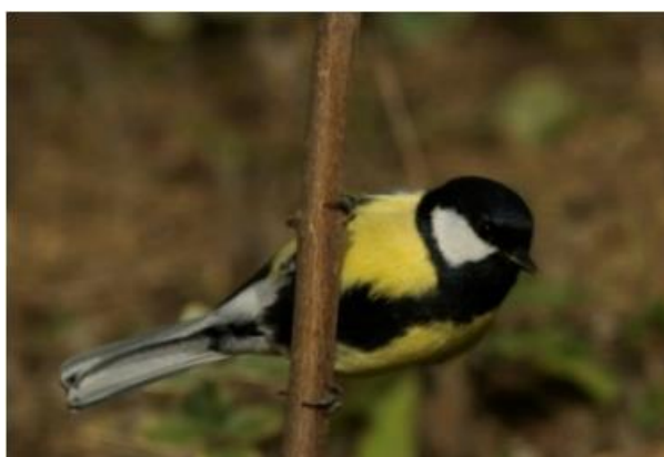
Mallerenga carbonera ( Parus major )

Ocells com la mallerenga carbonera ( Parus major ), la mallerenga blava ( Cyanistes caeruleus ), la mallerenga emplomallada ( Lopophanes cristatus ), la mallerenga petita ( Parus ater ), la mallerenga cuallarga ( Aegithalos caudatus ) i el raspinell ( Certhia brachydactyla ), tots ells presents a la ciutat, són ocells insectívors que participen en el control biològic de la processonària del pi ( Thaumetopoea pityocampa ) en alimentar-se de les erugues d'aquesta plaga.