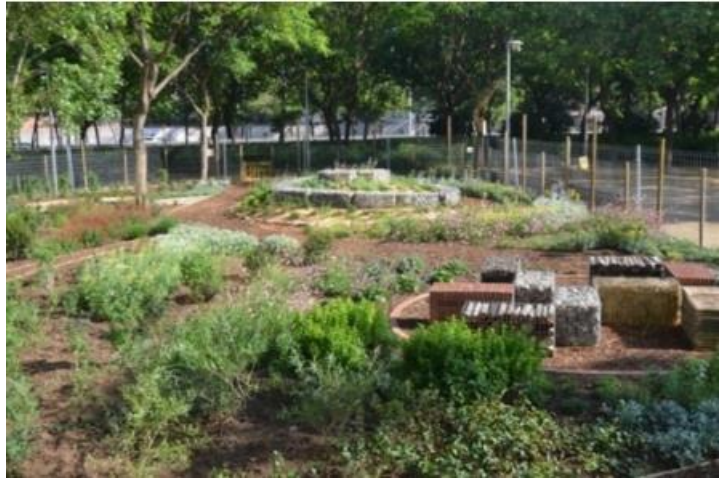
Jardins d'interès per a la biodiversitat de Valent Petit. En segon terme, espiral amb gabions de pedra.