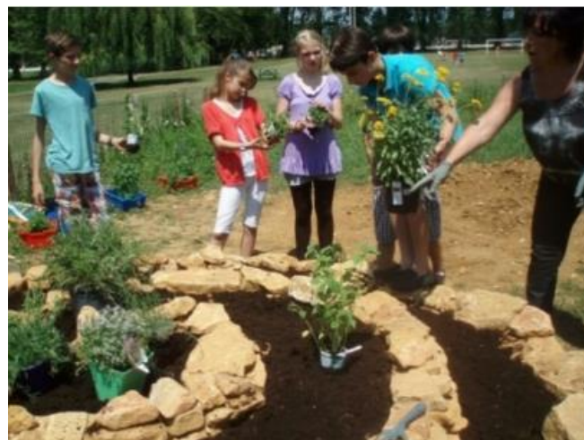
Ompliment amb terra de plantació