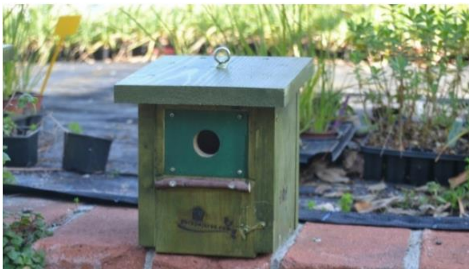
Caixa niu, model prefabricat, per ocells insectívors

Són caixes que ofereixen llocs adequats per a la nidificació d'ocells forestals insectívors.