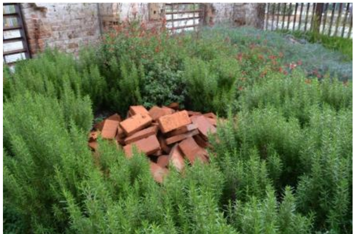
Refugi de biodiversitat. Fàbrica de Ca l'Alier