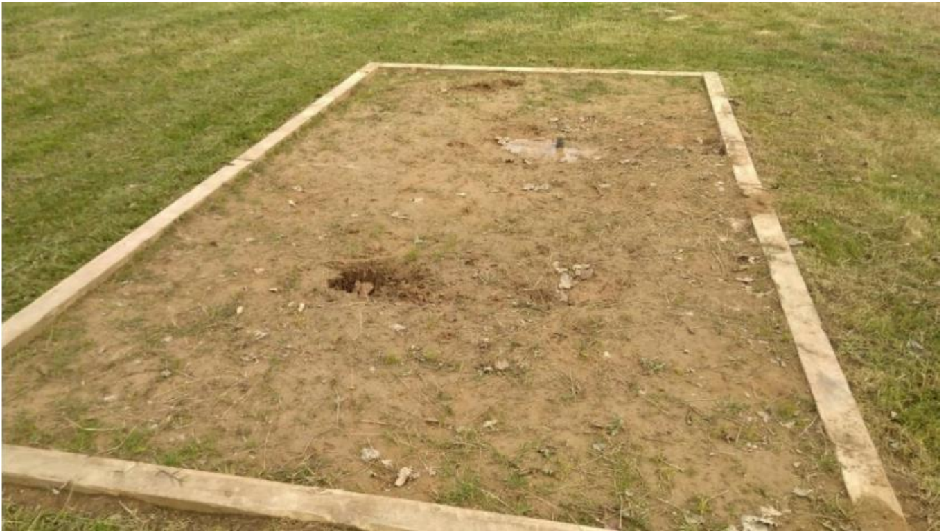
Fangar per a orenetes Parc de la Trinitat