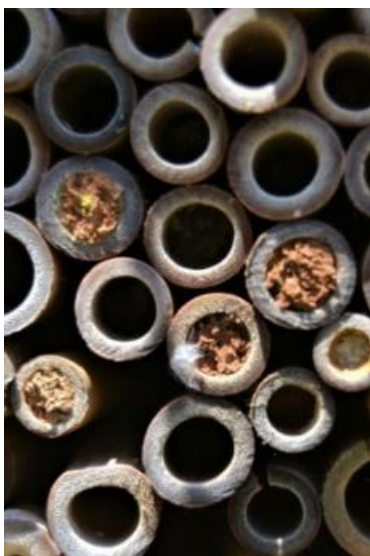
Nius ocupats amb diferents materials