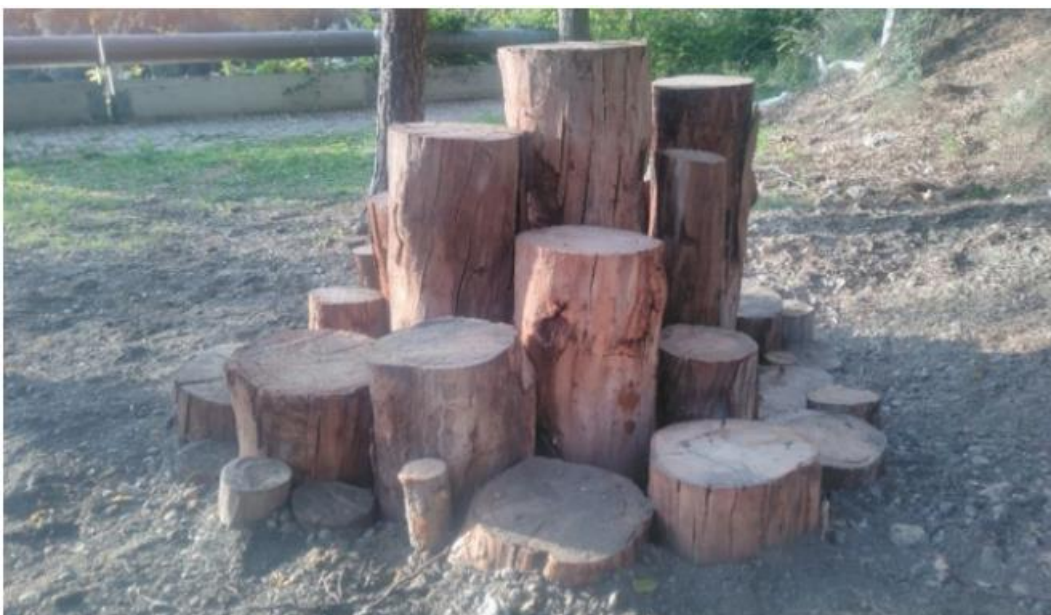
Piràmide de fusta Parc de la Creueta del Coll