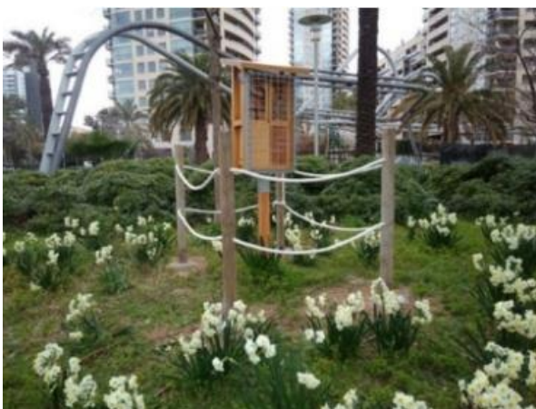
Refugi d'abelles del parc de Diagonal Mar