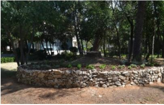
Espiral de pedra seca a l'Aula Ambiental del Bosc de Turull