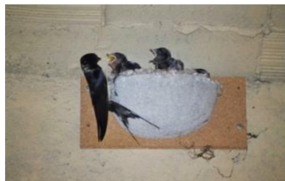
Oreneta vulgar ( Hirundo rustica )