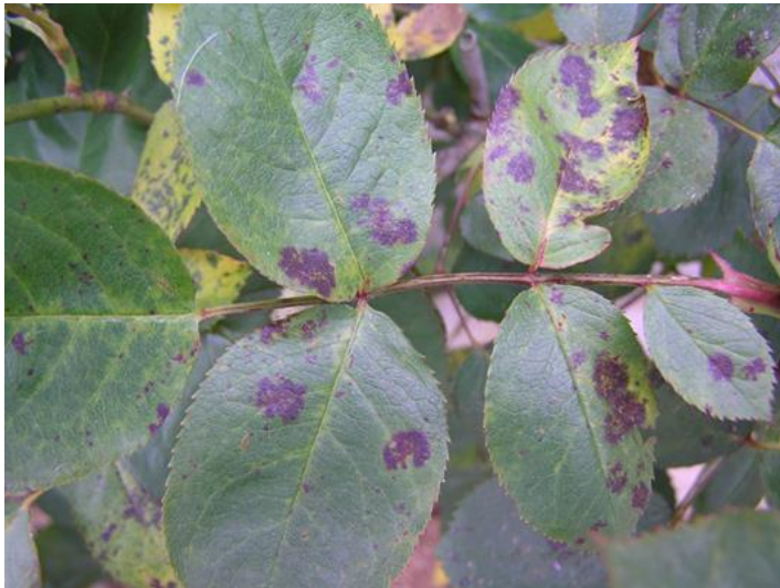
Clapejat en Rosa sp..