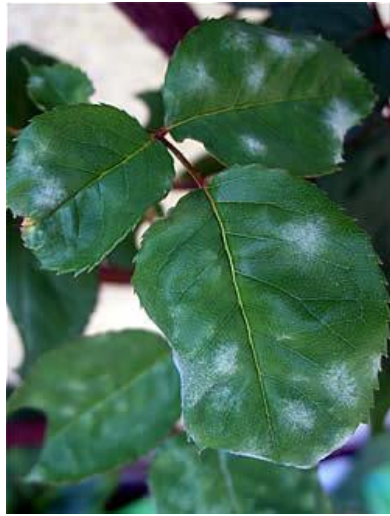
Oïdi en Rosa sp.