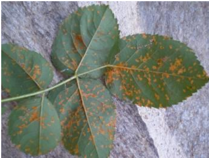
Roia en Rosa sp.