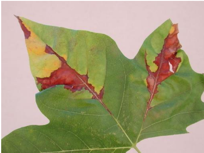
Antracnosi en Platanus sp..