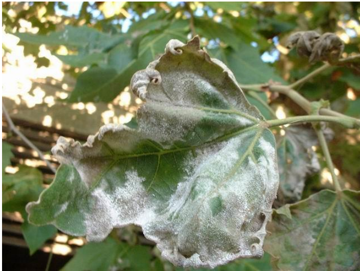
Oïdi en Platanus sp.