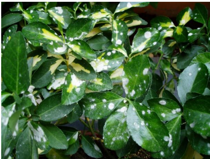
Oïdi en Euonimus sp.