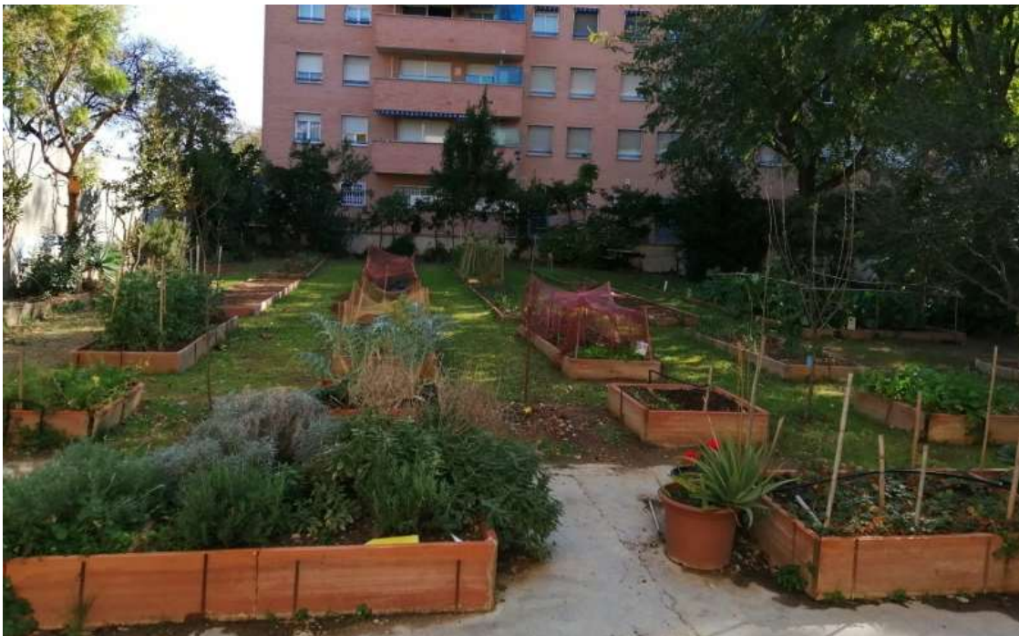
Il·lustració 1. Espai amb bancals elevats