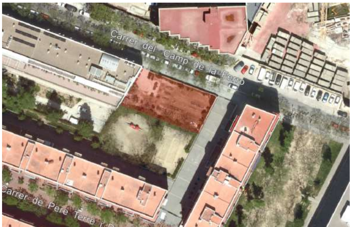
Mapa 1 l'espai és més gran que la part marró arriba fins l'espai 6a