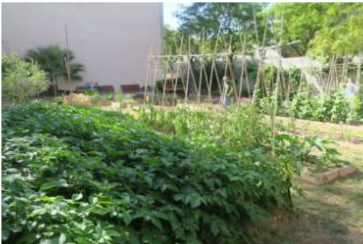
Il·lustració 3. Conreus