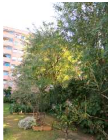
Il·lustració 4. Arbrat (fruiters i ornamental)

Més informació: Mans al Verd, espais en actiu