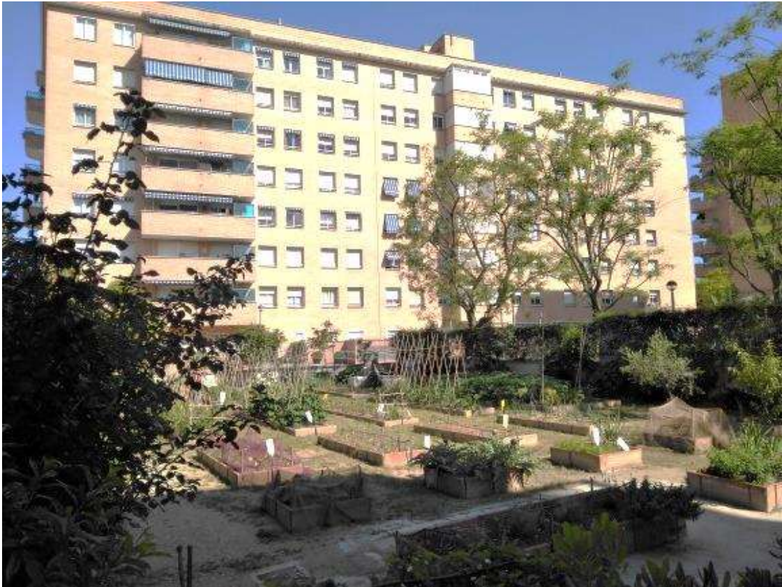
Il·lustració 2. Vista general