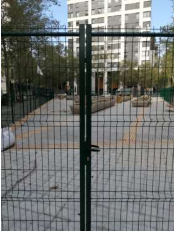
II-lustració 1. Porta d'accés