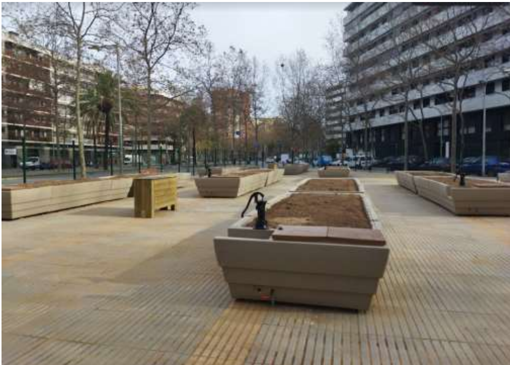
II-lustració 3. Vista general