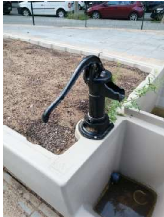
Il·lustració 4 i 5. Detall jardineres