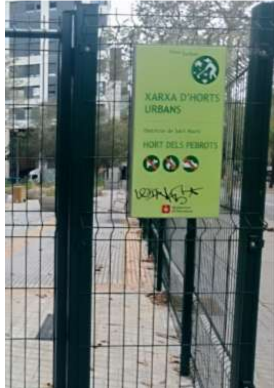
II-lustració 2. Cartell accés a l'hort