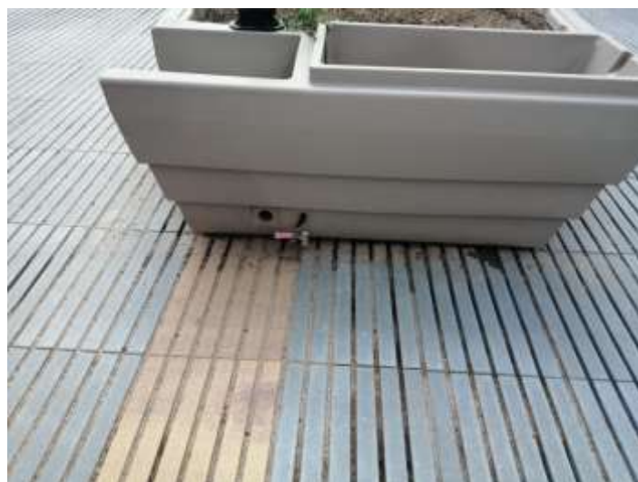
Il·lustracions 5 i 6. Detall jardineres

Més informació: Mans al Verd, espais en actiu