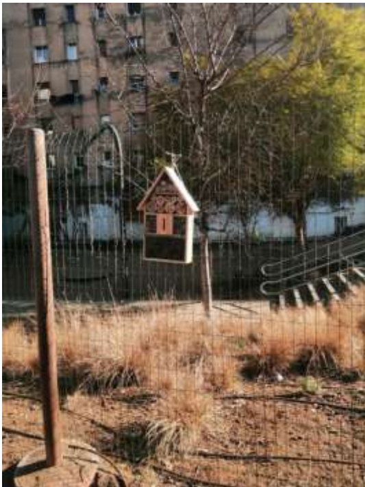
Il·lustració 4 Refugi d'insectes

Més informació: Mans al Verd, espais en actiu