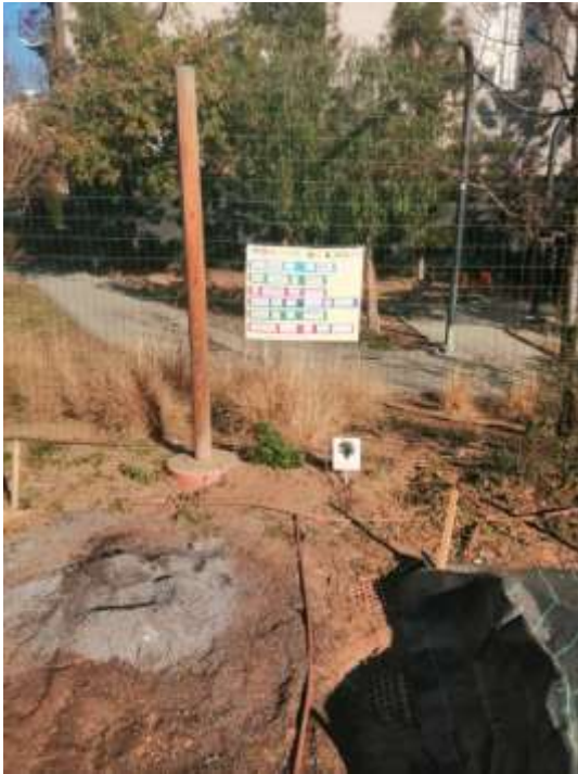
Il·lustració 3. Instal·lació reg gota a gota