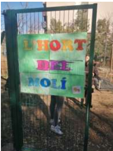
Il·lustració 1. Porta d'entrada