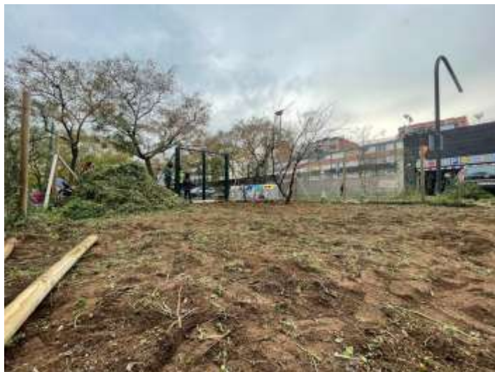
Il·lustració 2. Terreny de cultiu