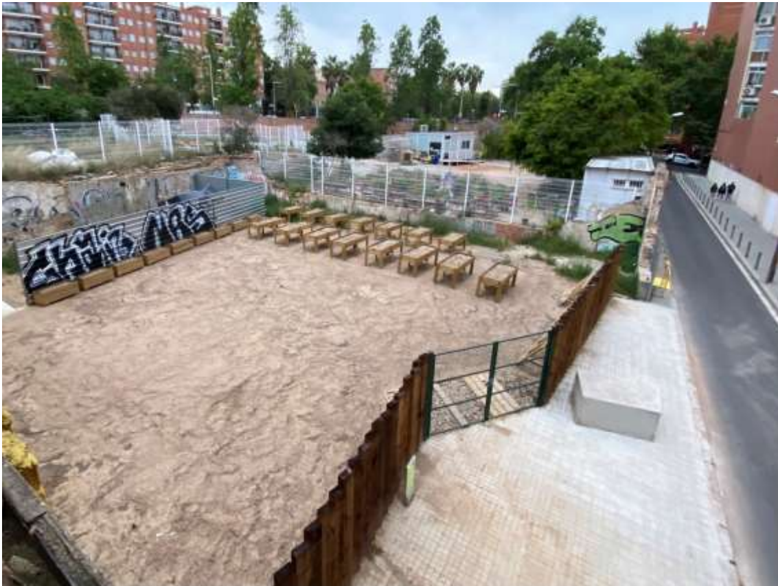
II-lustració 2. Vista general parcel·la