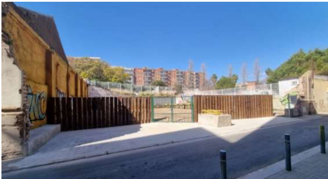
Il·lustració 1. Vista general de l'entrada