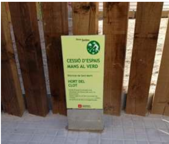
II-lustració 3. Cartell entrada