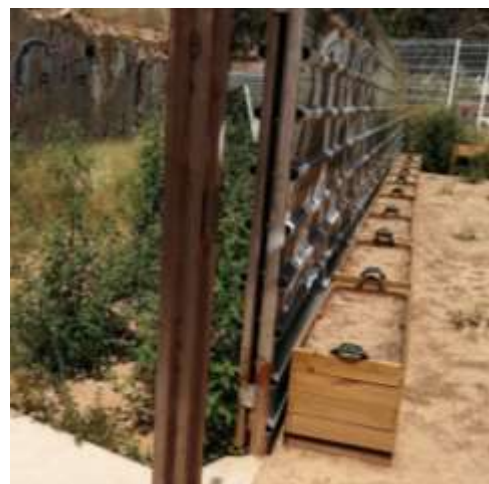
II-lustració 4. Jardineres