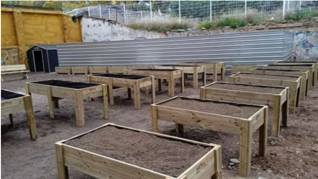
Il·lustració 5. Taules de cultiu i caseta al fons

Gerència de Serveis Urbans i Manteniment de l'Espai Públic Parcs i Jardins de Barcelona, Institut Municipal