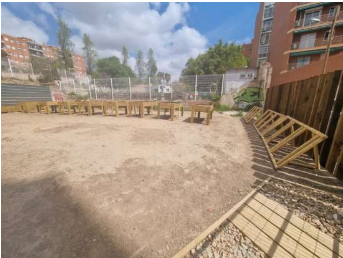
Il·lustració 6. Taules i aparca-bicicletes

Més informació: Mans al Verd, espais en actiu