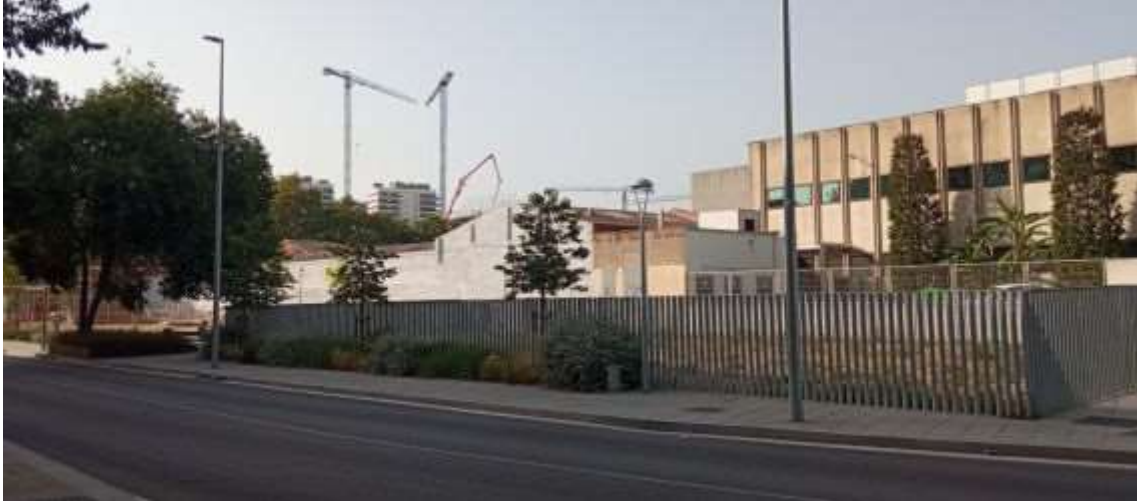
Il·lustració 1. Vista de l'exterior