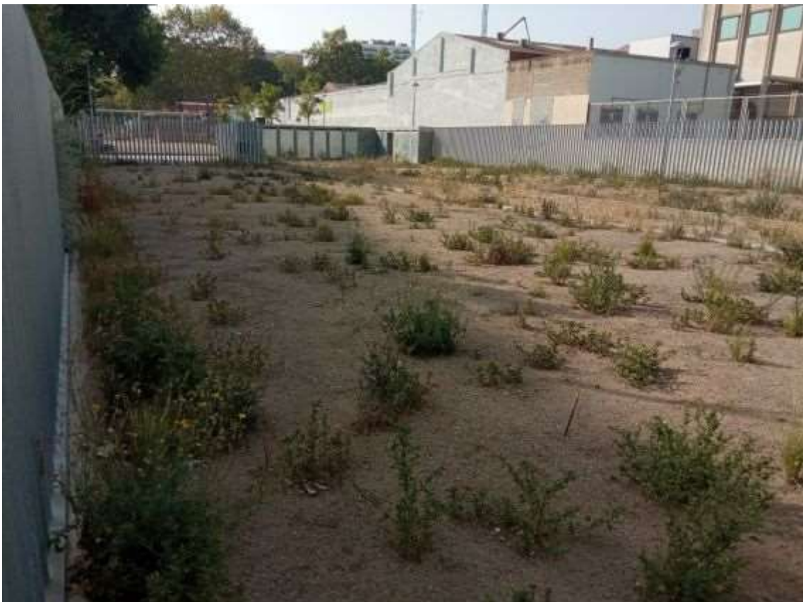
Il·lustració 2. Vista general bancals conreu

Més informació: Mans al Verd, espais en actiu