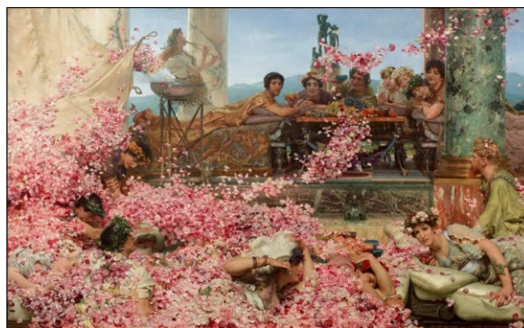
Las rosas de Heliogábalo de Lawrence Alma-Tadema (1888)