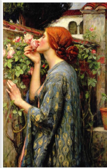
"The soul of the rose" també de John William Waterhouse. Representa una història de desamor d'una dona amb el cor trencat. Pren una rosa i l'olora recordant amb malenconia l'amor perdut.

Si voleu saber més sobre la seva història aquí teniu una petita bibliografia sobre la seva història mil·lenària a través de diferents cultures: