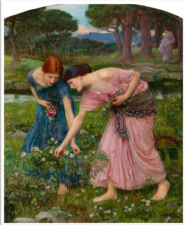
Pintura amb el títol: "Gather Ye Rosebuds While Ye May" del prerrafaelita John William Waterhouse, representa el carpe diem de tota la vida. On situa en una suau i etèria atmosfera a dos joves que, descalces, recullen roses juntes en un rierol.

La "reina de les flors" és el símbol d'amor, poder, reialesa, bellesa i alegria, la rosa ha exercit molts papers, tant literals com simbòlics, a la poesia, l'art, la literatura, la música, la moda, la medicina, els perfums, la decoració, la cuina i més.