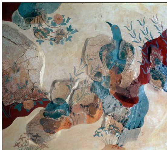
La primera imatge d'una rosa data del segle XVI a. C. i es va trobar a l'illa de Cnosos a Creta (Grècia). Exemple d'Art minoic: ocell blau. Fragment de la fresca que mostra un ocell entre roques, roses silvestres i lliris, de la Casa dels Fres