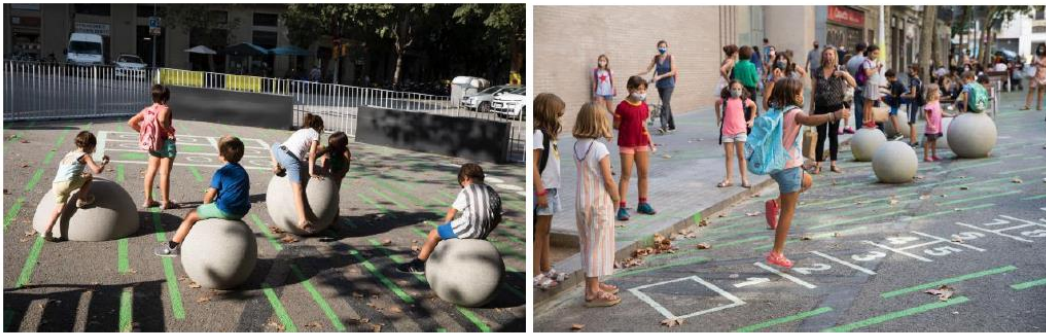
Entorns pacificats de l'Escola Sagrada Família – Sardanya (esquerra) i de l'Escola Univers i l'Escola Bressol Municipal Petit Univers (dreta), a Gràcia.

Les actuacions que ja estan en funcionament han tingut una molt bona rebuda per part de les comunitats educatives. S'han convertit en una extensió de l'escola en l'espai públic, i permeten organitzar millor les entrades i sortides i mantenir la distància de seguretat entre alumnes en l'actual situació de pandèmia. A més, els veïns i veïnes fan ús de les zones guanyades.