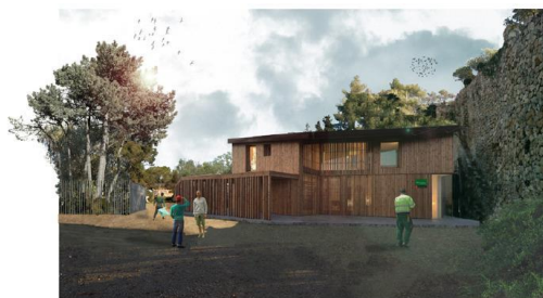
Imaginari del Centre Amics del Parc