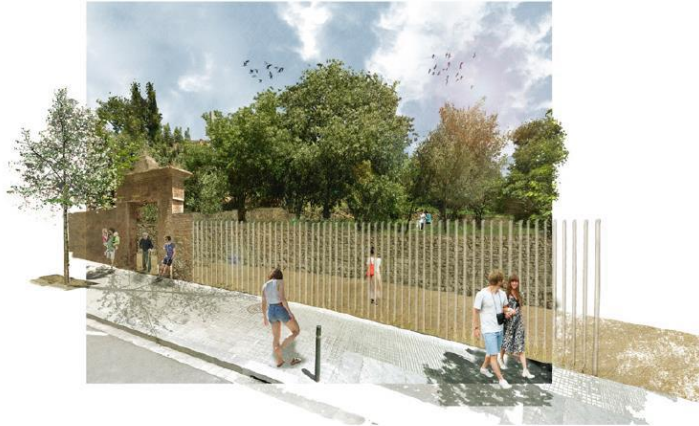
Imaginari d'un parc al carrer Marianao