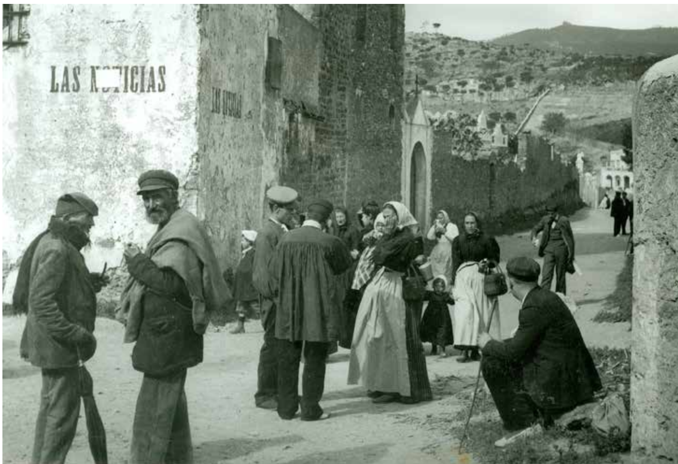
Un grup de persones al mig de l'antic traçat del carrer del Santuari davant de l'ermita de la Mare de Déu del Coll l'any 1897.

E l pas del temps acabà esborrant la memòria col·lectiva. Un exemple d'aquesta desmemòria és el territori on s'ubiquen els barris del Coll i de Vallcarca, que avui administrativament formen part del districte de Gràcia de Barcelona, però que fins a l'any 1904 formaven part del municipi de Sant Joan d'Horta, quan aquest es va integrar a la ciutat i tota la seva superfície va fer més gran Barcelona.