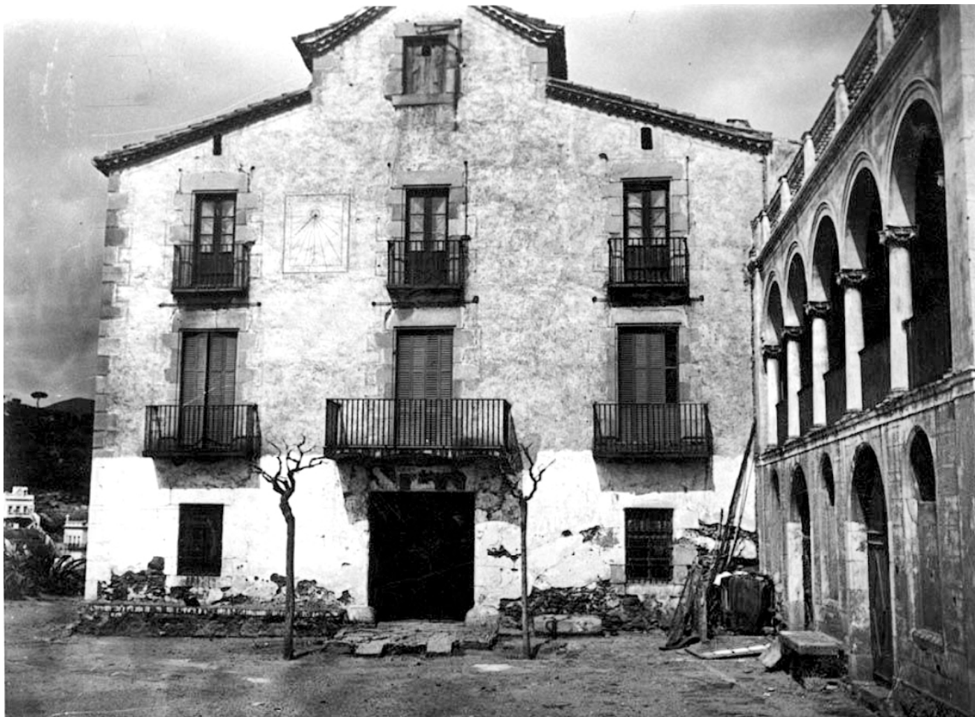
La masia de can Mora, ubicada a tocar l'ermita de la Mare de Déu del Coll, en el tram final del turó del Carmel o muntanya Pelada el 1919.

L a masia de Can Mora està situada damunt del coll del Portell, al final del camí de les Donzelles o de Can Mora, a tocar el cim del turó del Carmel o Muntanya Pelada i a prop del santuari, ara parròquia, de la Mare de Déu del Coll. Segons consta a la llinda de la porta, la seva construcció data de l'any 1730.