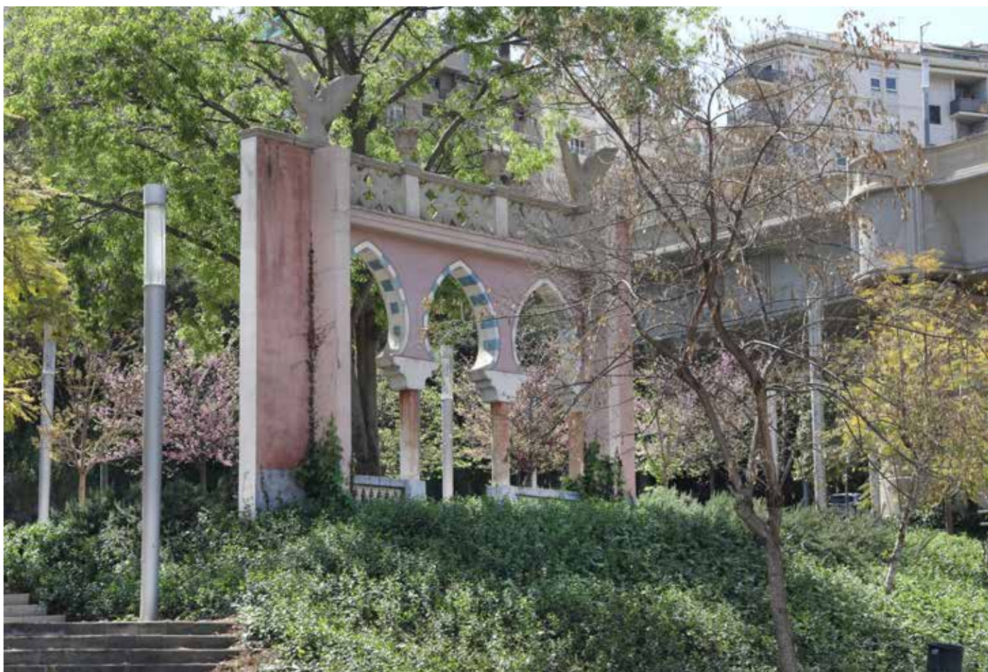
Detall dels arcs de l'antiga Casa dels Arabescos del jardí del mateix nom, el mes d'abril de 2022.

A ntigament, a Barcelona hi havia diferents rieres que baixaven de la serra de Collserola i travessaven el pla de Barcelona fins a arribar al mar. Una d'aquestes era la riera de Vallcarca, que portava les aigües de les pluges de Collserola, de Penitents i de Sant Genís, que fseguia una part del seu recorregut per l'actual avinguda de Vallcarca, fins a arribar a la zona de l'antiga plaça de Lesseps on feia un meandre i seguia per l'actual avinguda de la Riera de Cassoles cap al pla de Barcelona.