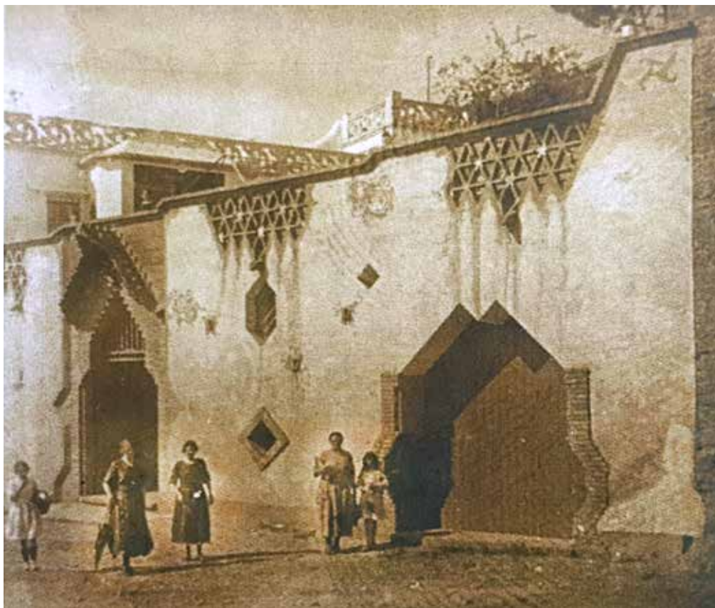
Façana de la Finca Sansalvador, al passeig de la Mare de Déu del Coll, entre 1915 i 1920.