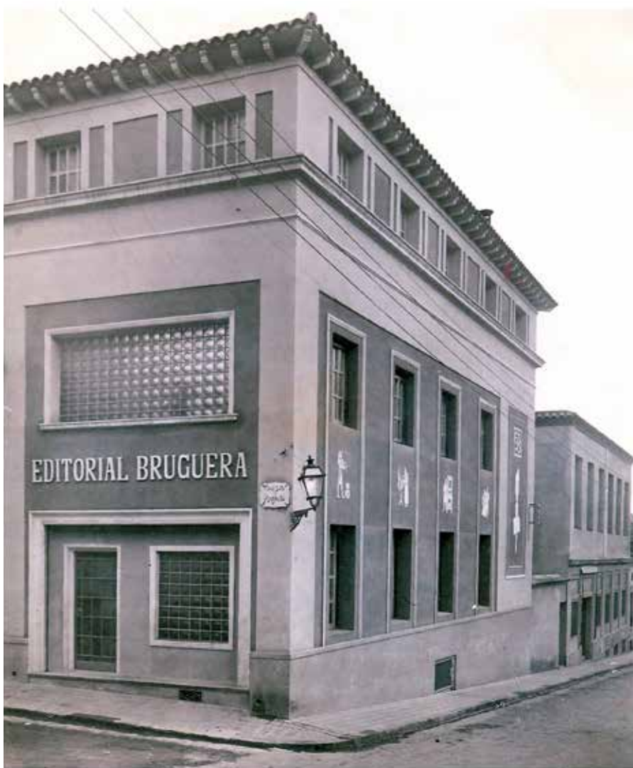
Edifici de l'Editorial Bruguera al carrer de l'Aldea 17, avui, Centre Cívic El Coll - La Bruguera.