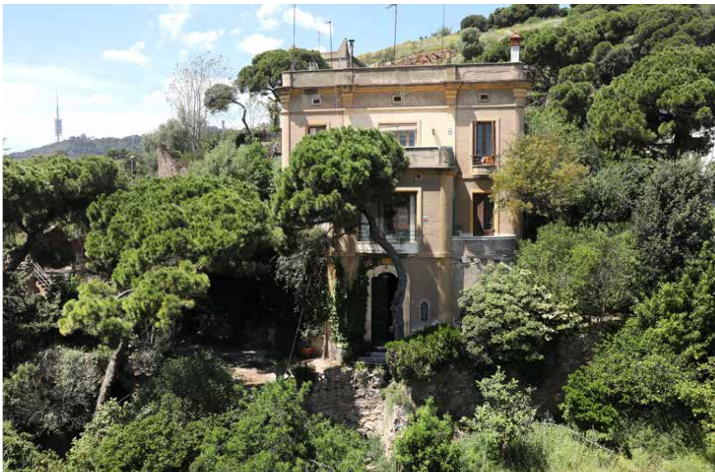
Casa principal de "Villa Conchita" o "Villa Els Metges" el mes de maig de 2022.

V illa Conchita o la Casa dels Metges és una finca, construïda a cavall de les dècades de 1910 i 1920, ubicada entre el passeig de la Mare de Déu del Coll, 81 i el carrer de Pineda, en un terreny d'un fort desnivell, que es va salvar a través d'un jardí de muntanya en terrasses.