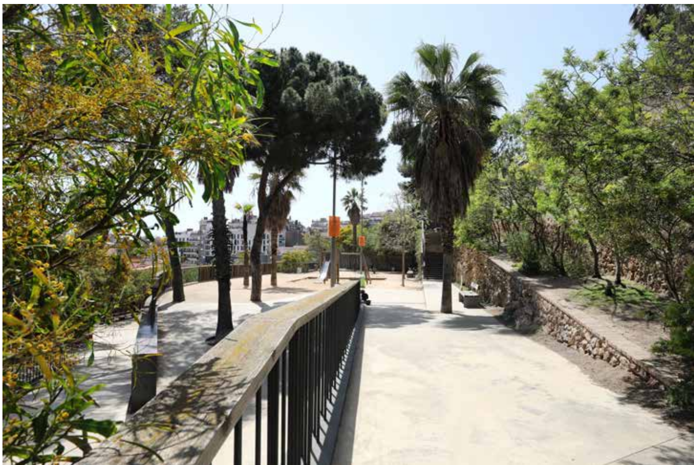
Terrassa superior dels jardins de Maria Baldó, el mes d'abril de 2022.