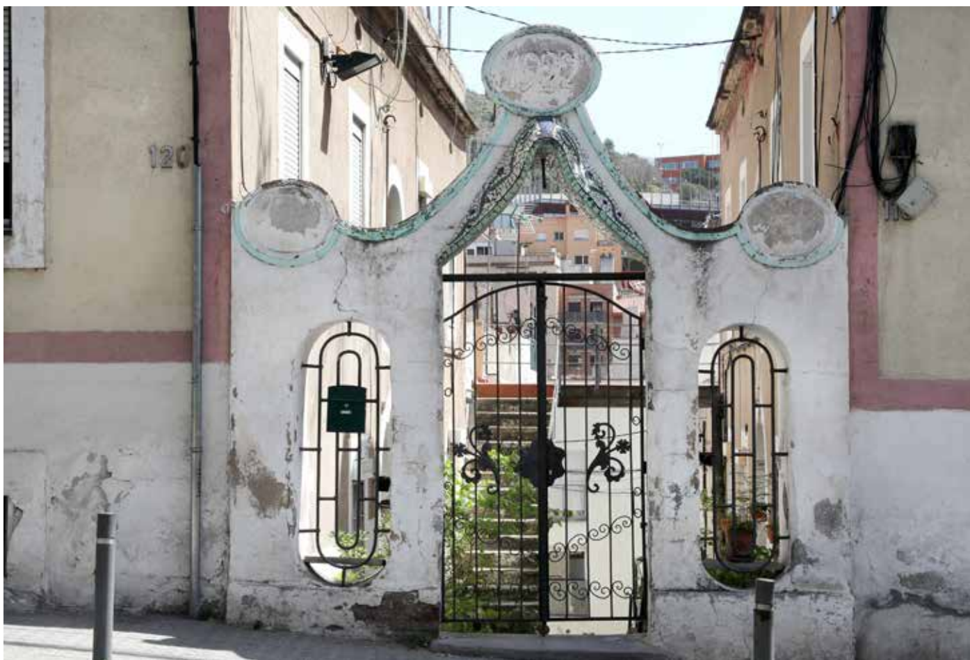
Entrada del passatge Ministral, al passeig Mare Déu de Coll, 120, l'abril de 2022.

E l passatge Ministral es troba entre el passeig de la Mare de Déu del Coll número 118, i el carrer del Beat Almató, 75. Es tracta d'una petita peça muntanyosa del turó del Coll que va urbanitzar el senyor Ministral, constructor d'obres, que la va comprar el 1914 a la senyora Josepa Bellalta Mariné.