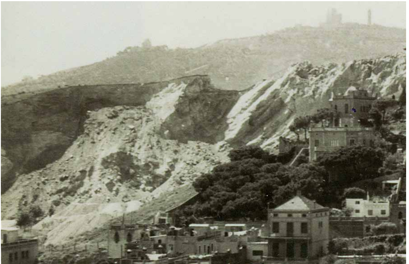
Aspecte que oferia la pedrera oberta al turó del Coll a la dècada de 1960.