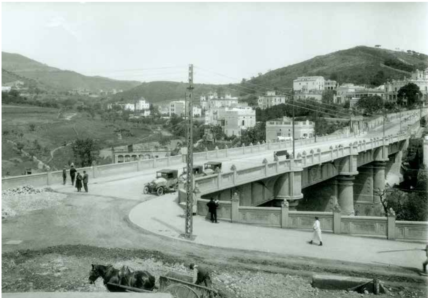
Aspecte que oferia el pont de Vallcarca poc abans de la seva inauguració el 3 de març del 1923.

E l viaducte o pont de Vallcarca és una obra que, després de dues dècades de litigis, va permetre connectar els turons del Putxet amb el Coll, salvant el desnivell de l'antiga riera de Vallcarca i que va unir l'avinguda de la República Argentina amb el passeig de la Mare Déu del Coll, tancant favorablement una vella reivindicació dels veïns de l'entorn, que fins i tot havien fet aportacions econòmiques i donat terrenys per a la construcció d'aquest vial.