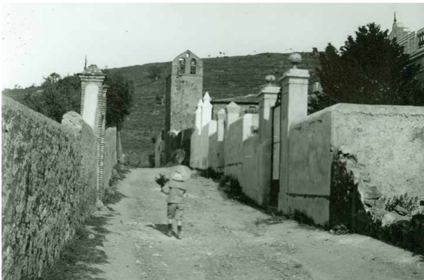
Antic traçat del carrer de Santuari a cavall dels segles XIX i XX.