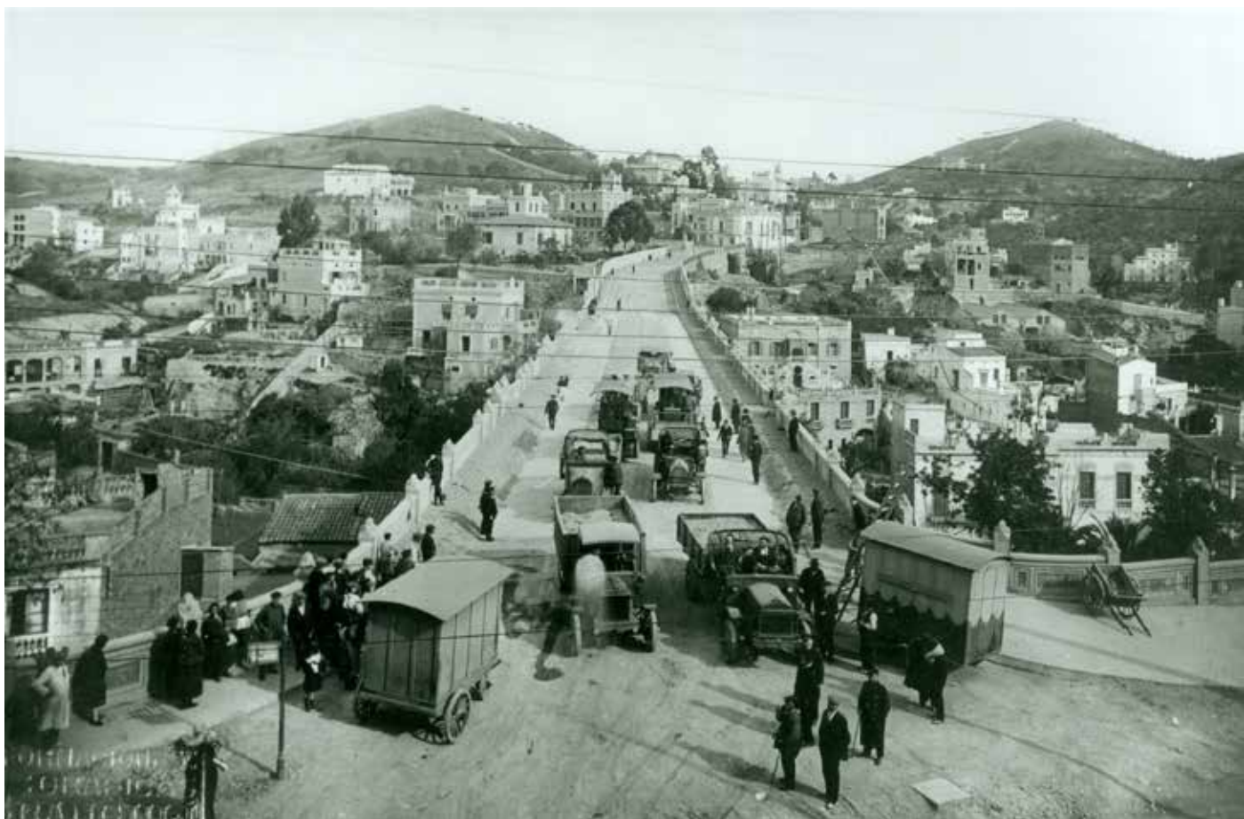
Obres d'asfaltatge del viaducte de Vallcarca poc abans de la seva inauguració l'any 1923. Al fons els turons del Coll a l'esquerra i del Carmel o muntanya Pelada a la dreta.

E n l'actualitat, al Pla de la ciutat de Barcelona hi ha set turons: el Turó de la Peira (138 m), el turó de la Rovira (262 m), el turó del Carmel (266 m), el turó del Coll (245 m), el turó de Putxet (183 m), el turó de Monterols (127 m) i el turó de Modolell (108 m). Històricament parlant, els quatre primers formaven part del municipi de Sant Joan d'Horta, i els altres tres, del poble de Sant Gervasi de Cassoles.