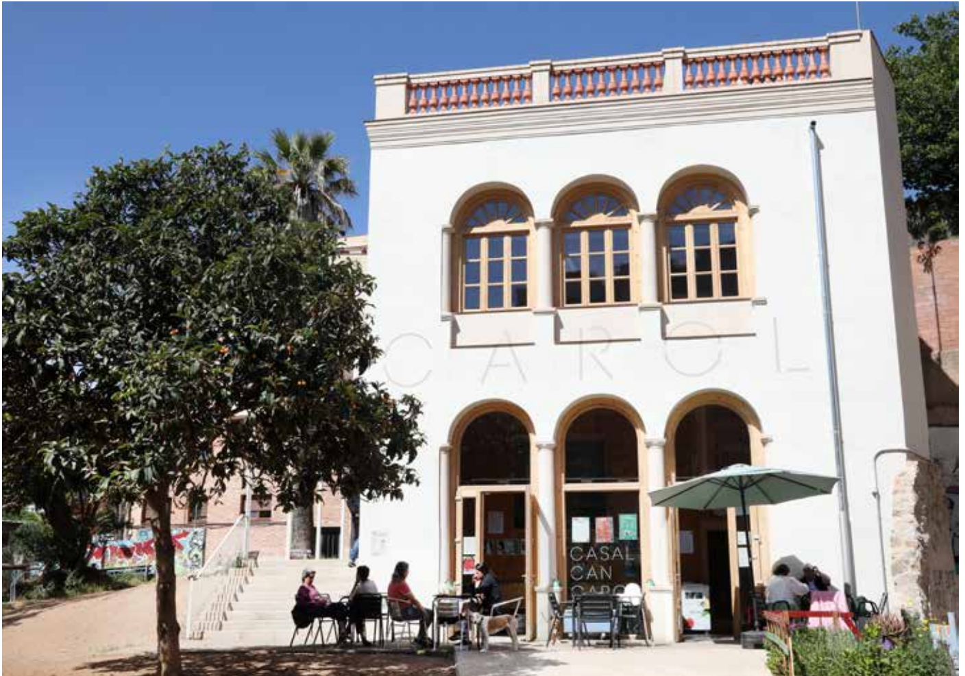
Façana principal de l'antiga masia de Can Carol el mes de maig de 1922.

C an Carol, és una casa de tipologia rural construïda a mitjans del segle XIX, probablement entre 1860-1861. Considerat un dels edificis més antics de la part baixa de Vallcarca, disposa de planta baixa, pis i un terrat. Està ubicat entre els carrers de Cambrils i el de la Farigola, on hi ha la façana principal, formada per tres arcades separades per fines columnes i que es repeteix a la galeria del primer pis.