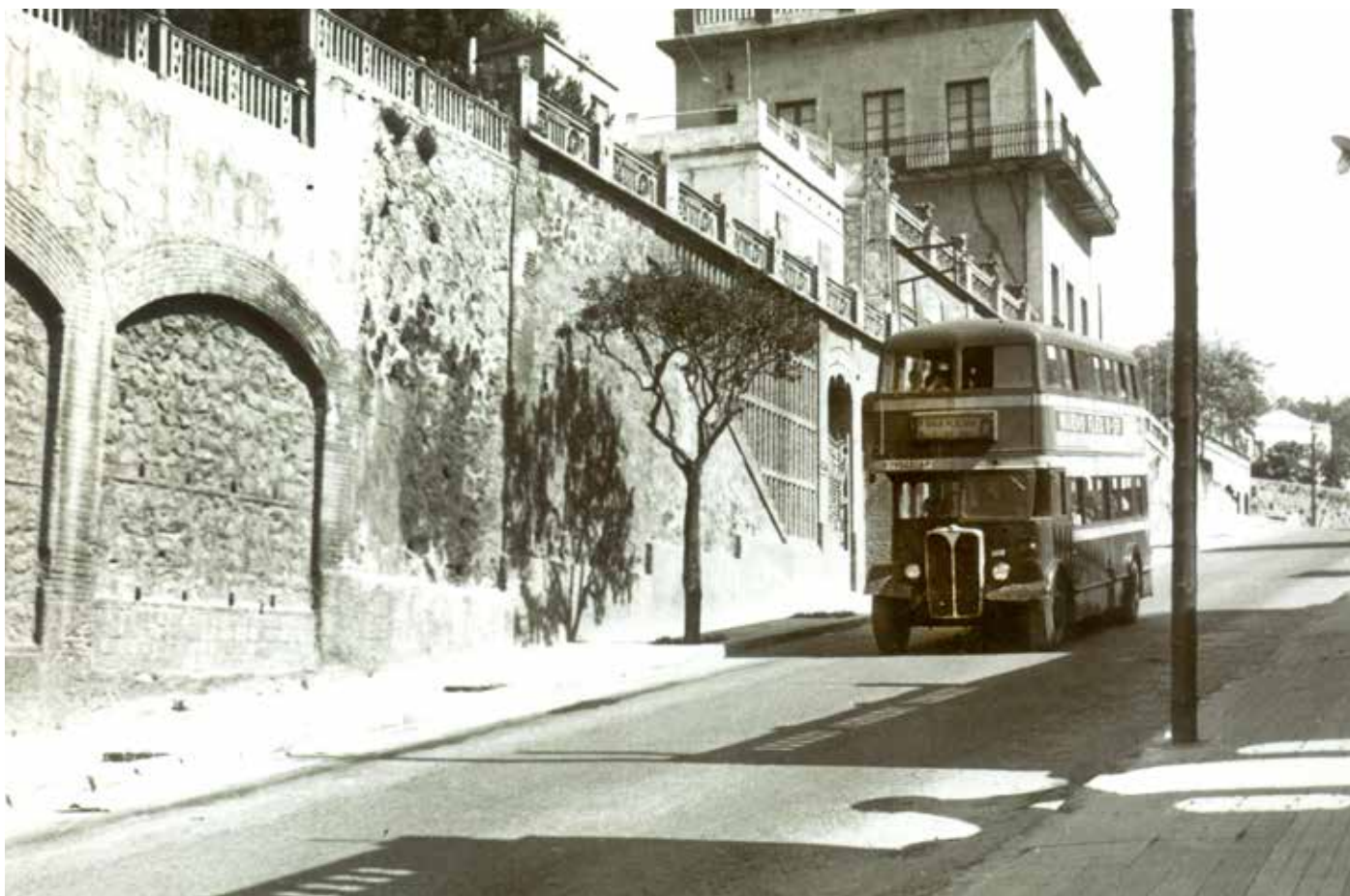
Un autobús de la línia C entre la plaça de la Gal·la Placídia i el santuari de la Mare de Déu de Coll, circulant per davant de Villa Conchita entre les dècades de 1950 i 1960.

G eogràficament, els barris del Coll i Vallcarca estant ubicats entre els turons del Coll i del Carmel, una depressió natural que des d'aquests turons baixa fins a la riera de Vallcarca i que durant dècades ha patit una transformació de rural a urbana imparable.