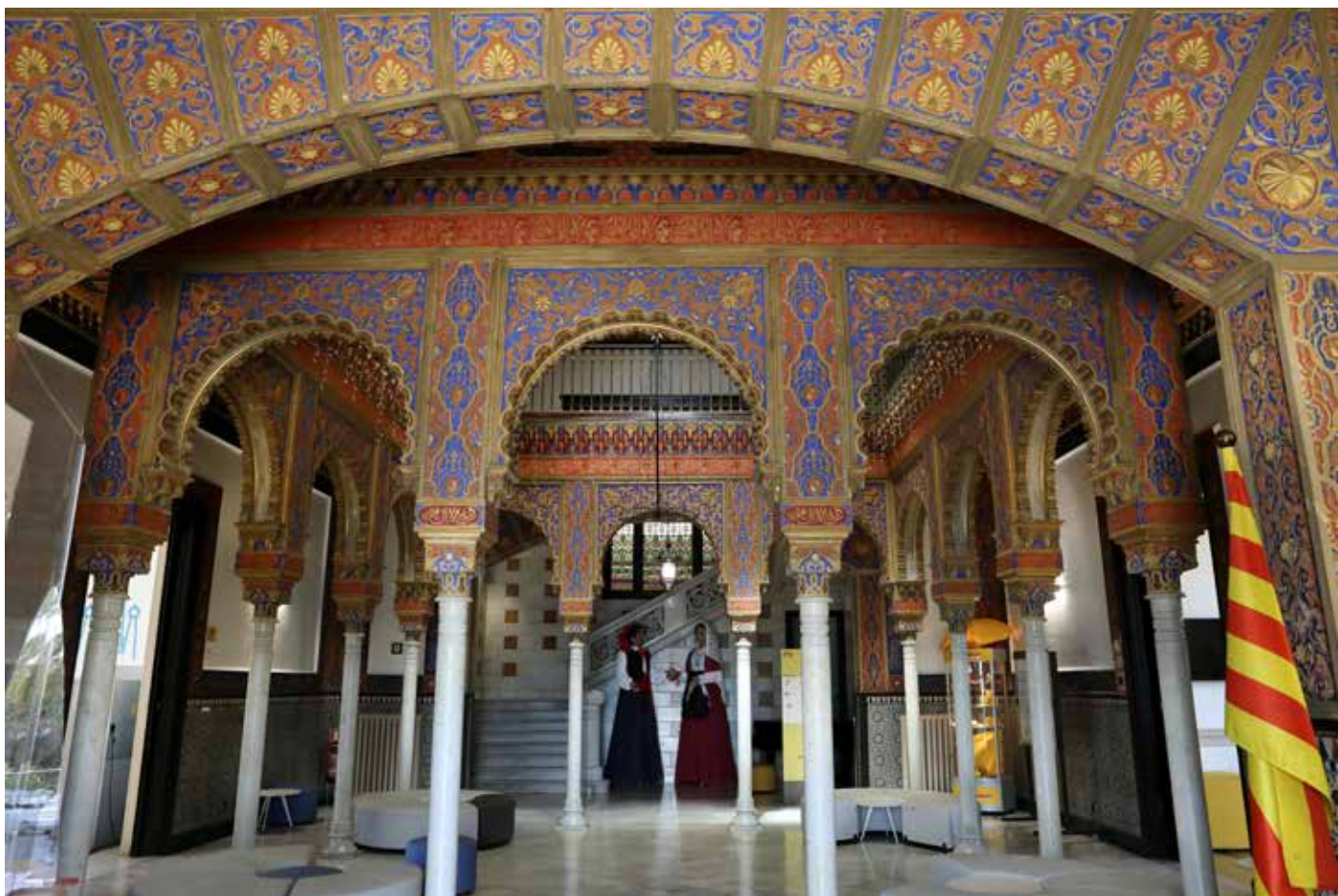
Pati interior neoàrab de la casa Josepa Marsans, l'abril de 2022.