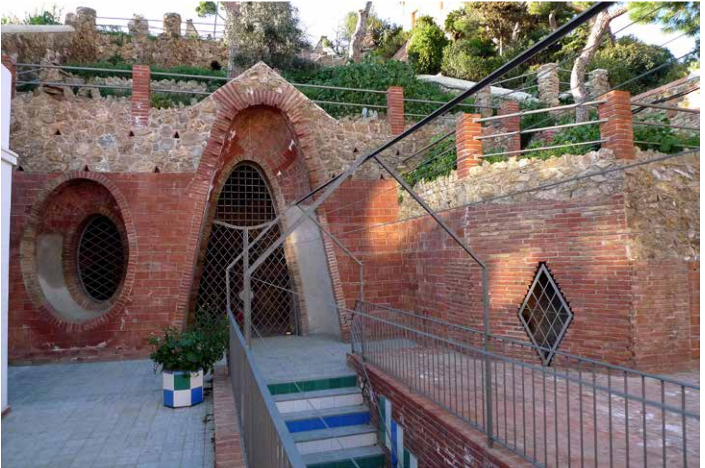
Entrada de les coves de la Finca Sansalvador, de Josep Maria Jujol, poc després de la seva recuperació l'any 2009.