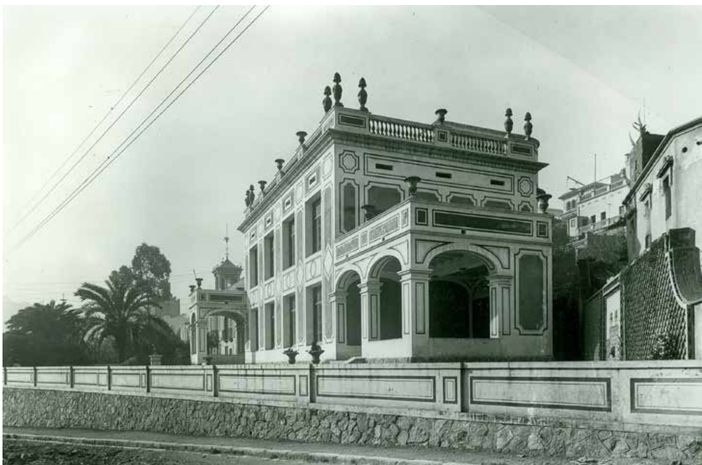
Edifici de l'escola La Farigola de Vallcarca poc després de la seva inauguració el 28 de març de 1923.

A ntigament, en el camí ral de Barcelona a Sant Cugat, al seu pas pel barri de Vallcarca i més concretament a l'actual cantonada dels carrers de la Farigola amb el de Sant Camil, s'aixecava un edifici que acollia l'hostal de la Farigola.