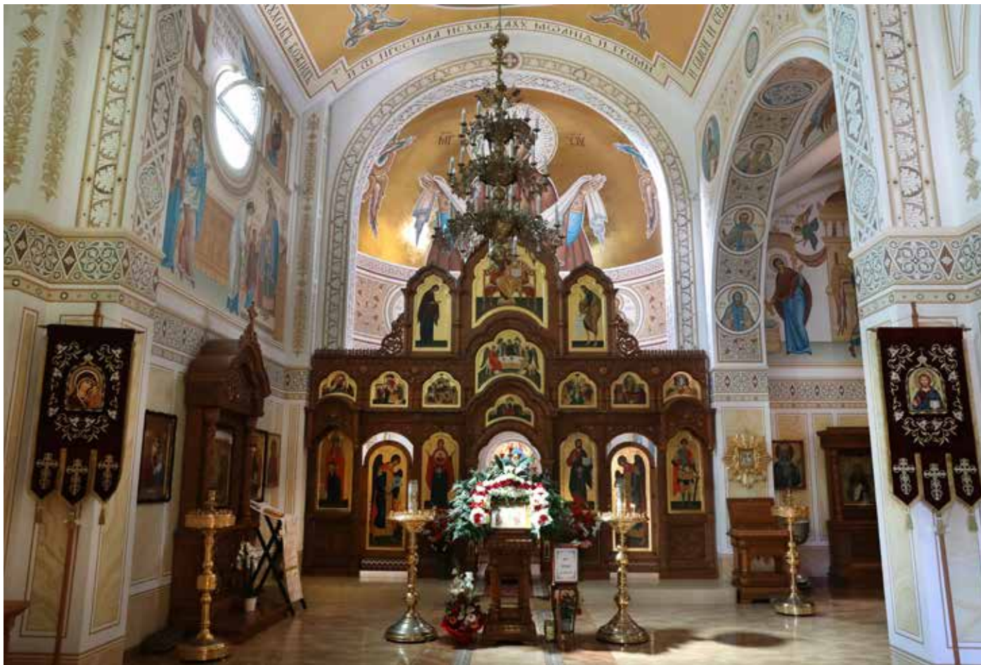
Nau principal de l'església de l'Anunciació, amb el seu iconòstasi que s'alça davant del presbiteri, el mes d'abril de 2022.

A començament de la dècada de 2010, el bisbat de Barcelona va llogar a l'església ortodoxa russa l'antiga capella dels Pares Camils del carrer de la Mare de Déu dels Reis, 12, al barri de Vallcarca, perquè aquesta comunitat l'adaptés a les seves necessitats.