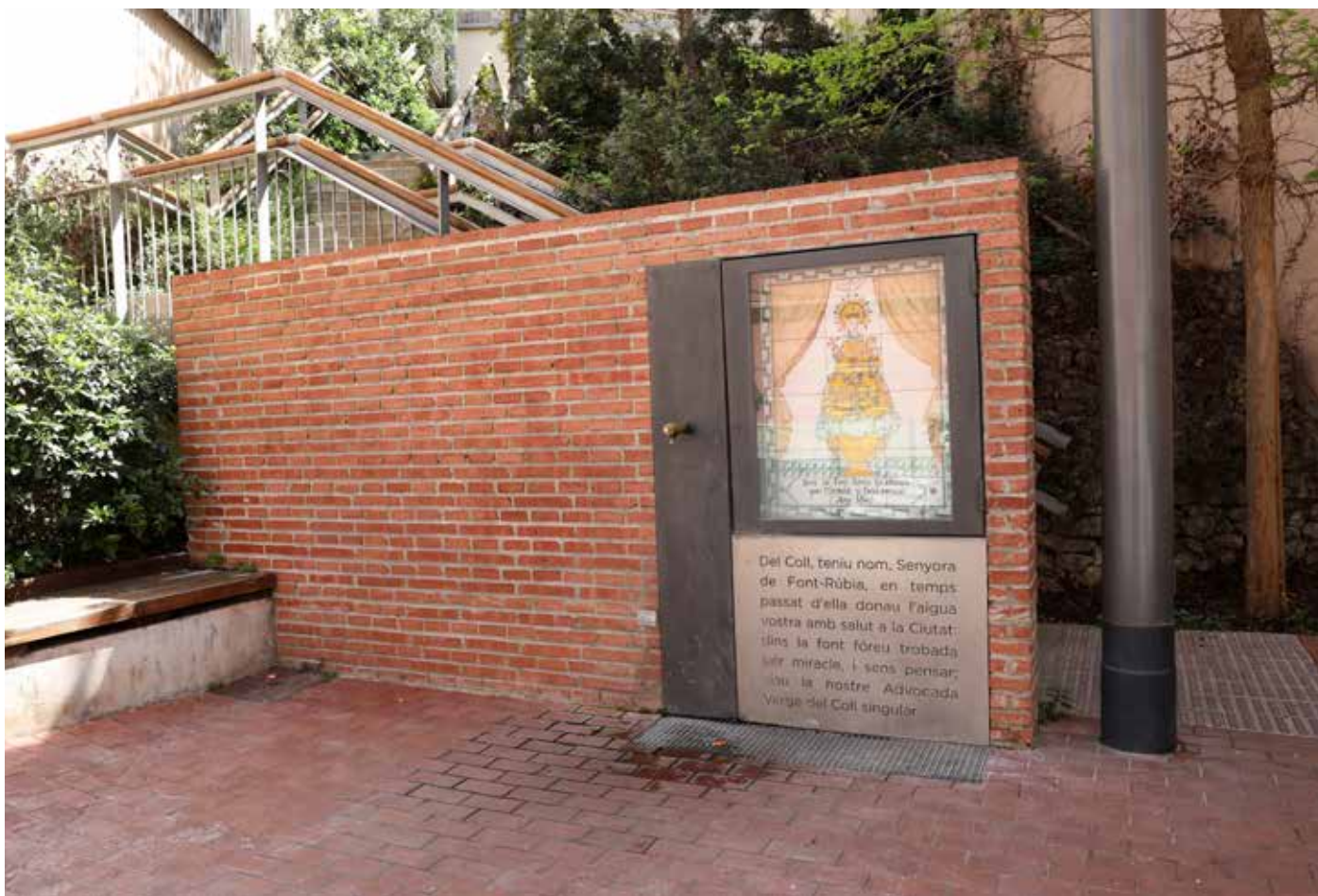
Reurbanització de la nova Font-rúbia ubicada al carrer de Tirso, 44, inaugurada el 29 de març de 2014.

A tocar gairebé el cim del turó del Carmel i del coll que l'uneix al turó del Coll, a l'actual carrer de Tirso, 44, fa segles hi havia una font que, pel color vermellós de l'aigua que brollava, era coneguda com la Font Rúbia, una font que dona nom al santuari que s'erigí a poca distància i que des del segle XVI va subministrar aigua a la ciutat de Barcelona, segons recull Francesc Sociés, mestre fontaner, en el Llibre de les Fonts de 1650 i que s'allargà fins a finals del segle XVIII.