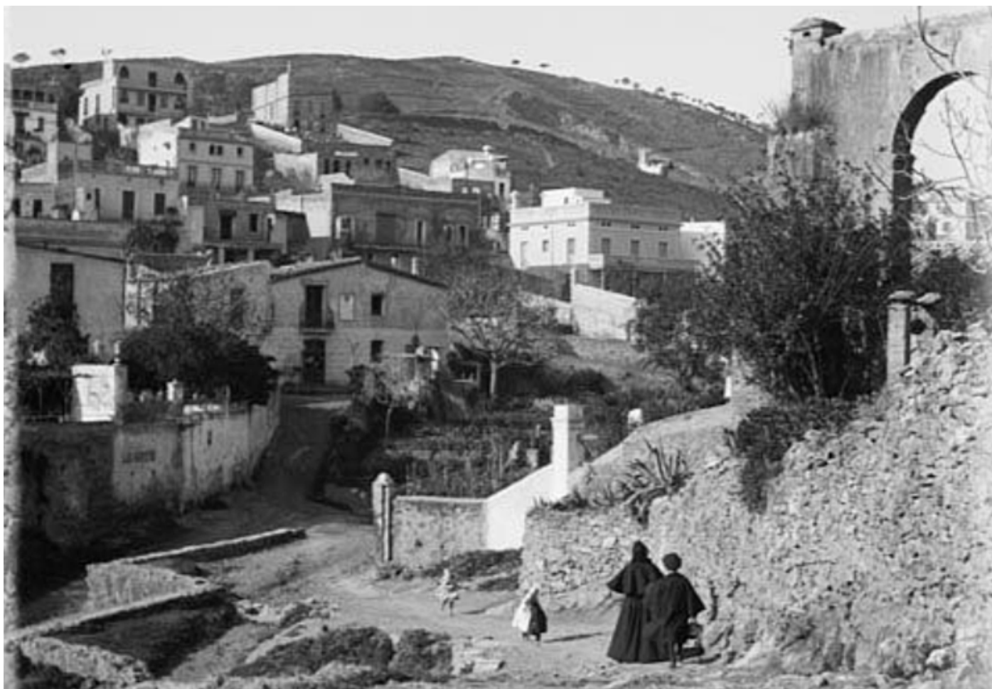
A la dreta, part de l'antic viaducte de Vallcarca, al centre, amb coberta de dues aigües, el desaparegut hostel de La Farigola i, a l'esquerra, els jardins del passatge d'Isabel i de la Casa Francesc Dalmau, a finals del segle XIX.

E l passatge d'Isabel de Vallcarca és un estret carreró datat del 1836, a tocar l'hostal de La Farigola, amb entrada pel carrer de Sant Camil i, malgrat que inicialment i durant dècades no tingués cap sortida, arran de la construcció dels jardins de Maria Baldó, s'obrí un nou pas entre el passatge i el jardí.