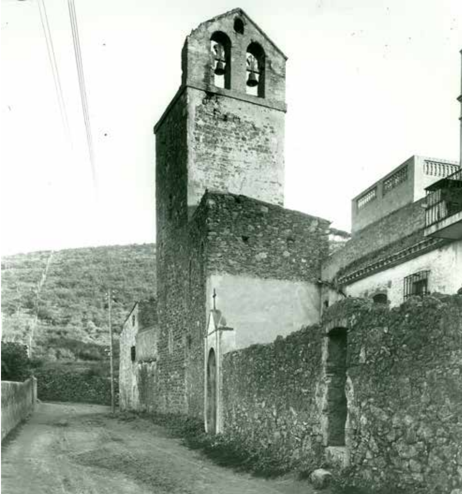
Imatge de l'ermita de la Mare de Déu del Coll, del traçat antic de l'actual carrer del Santuari i del darrer tram del turó del Carmel o muntanya Pelada. AUTOR DESCONEGUT/GRUP D'ESTUDIS COLL-VALLCARCA

E l santuari de la Mare de Déu del Coll o de la Font-rúbia es troba en el coll del turó del Carmel o Muntanya Pelada. És una petita església d'origen romànic, ja referenciada l'any 1098 en els següents documents: