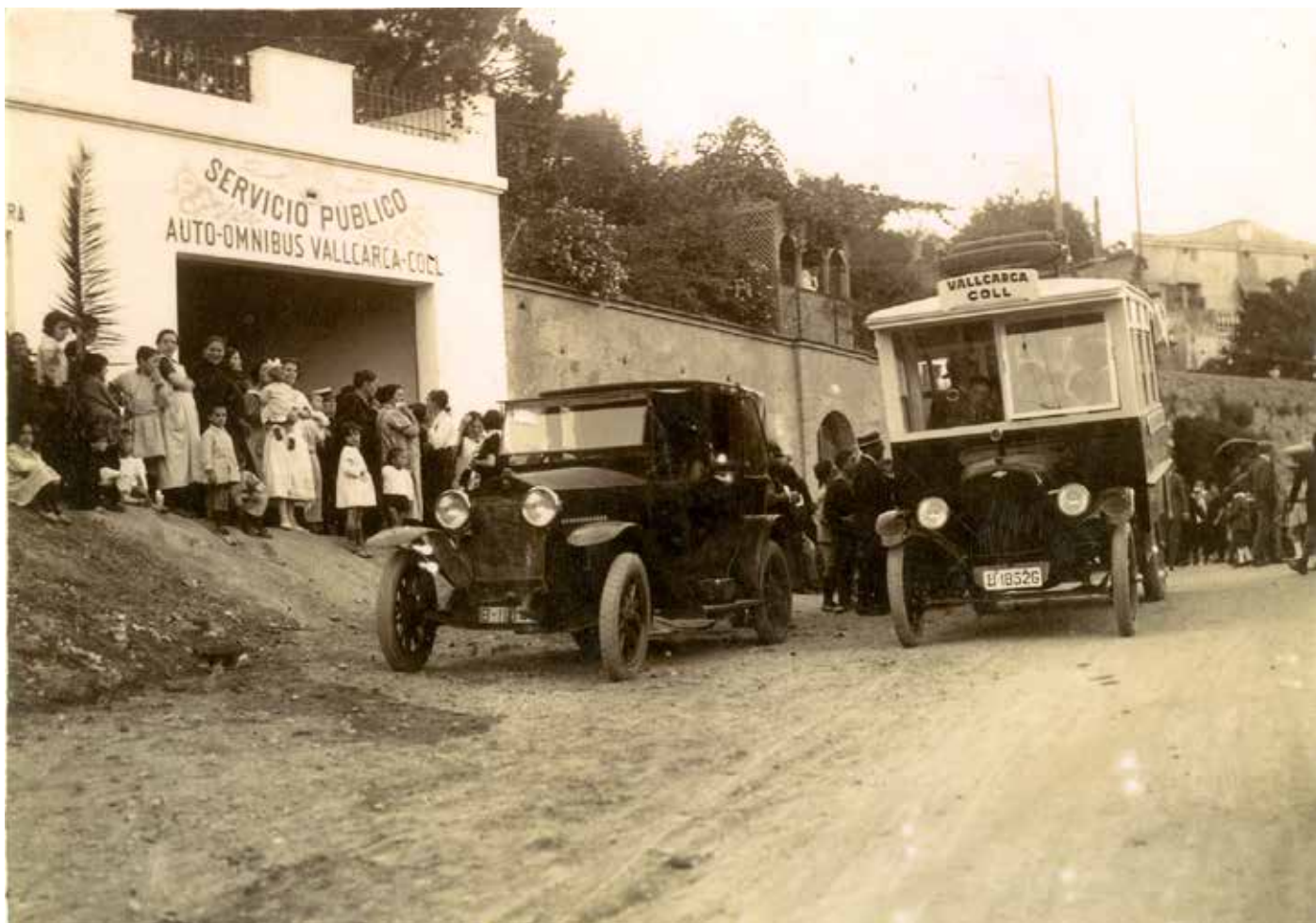
Origen i final de l'Auto- Òmnibus Vallcarca-Coll, al carrer de Funoses Llussa, 2, la tardor de 1925.