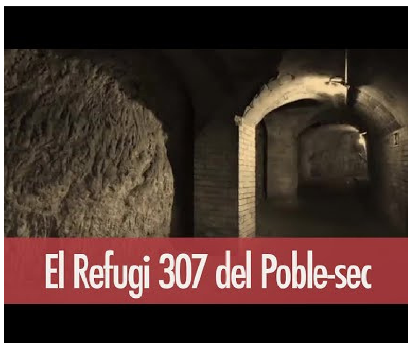
El Refugi 307 del Poble-sec

Els primers llocs que es van habilitar com a defensa van ser els soterranis de les cases i la xarxa de metro però en intensificar-se els bombardejos es va començar la construcció de refugis amb la col·laboració popular. Entre els milers que es van construir, uns 1400, hi ha el refugi 307, el més gran, situat al barri del Poble Sec. Compta amb prop de 400m 2 de túnels de volta de 1'6m d'ample i 2m d'alçada. Al llarg del recorregut es poden conèixer les condicions de vida que es varen donar entre les seves parets i observar les diferents estances com ara els lavabos, una font i la infermeria entre altres.