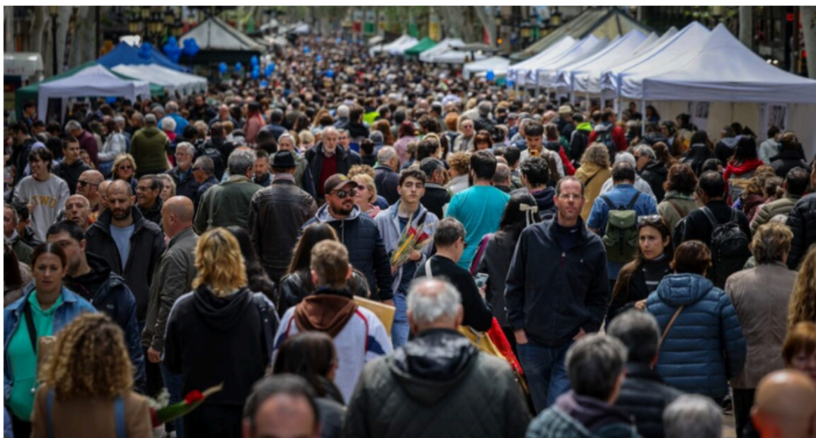
2023. Rambla de Catalunya

Vet aquí un gat, vet aquí un gos i la llegenda ja s'ha fos.