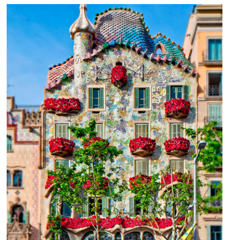
2023. Casa Batlló

"Trenquem Barreres" va omplir l'espai de color amb roses de paper fetes a mà, i "Núvol de lletres" va decorar l'entrada del casal tot donant color i tendresa a la celebració.