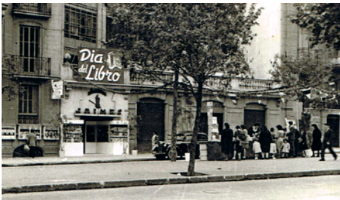
1953. "Dia del libro", llibreria Jaimes

Pienso que esta historia, aparte de trágica para mí, también fue muy bella, pues conseguí tocar su corazón, puesto que ha perdurado hasta el día de hoy.