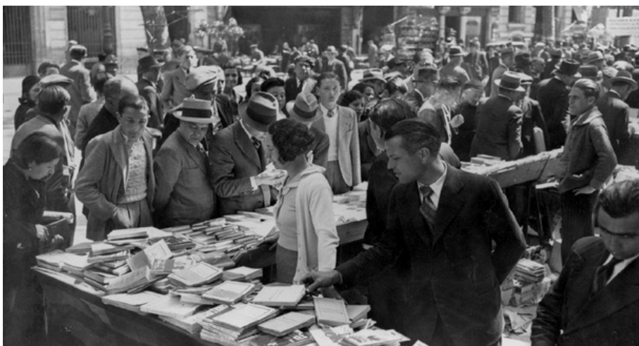
1935. Rambla de Catalunya

Después de dormir aquella noche todos juntos, el día siguiente se despidieron con la esperanza de volverse a ver el siguiente 23 de abril.