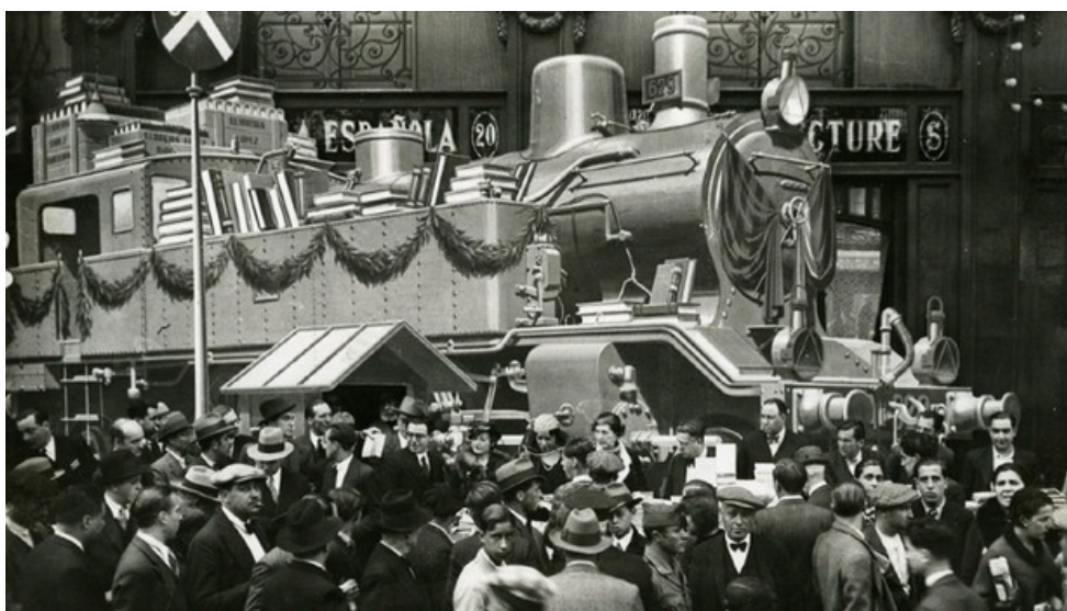
1933. Paradeta de la llibreria "La Española"

Y colorín colorado, este cuento se ha acabado.