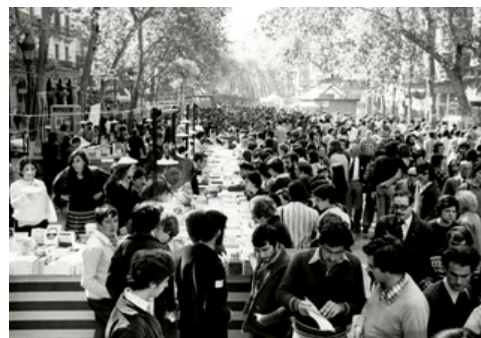
1977. Rambla de Catalunya