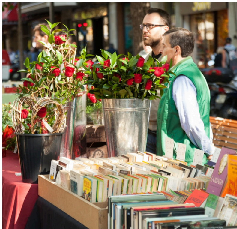
2024. Paradeta de roses i llibres

Llego a la cuarta planta. No me da tiempo a fijarme en qué se vende aquí porque veo otro enorme dragón con unas alitas pequeñas. Ya no me asusta; parece que todo el edificio está invadido por ellos. Pero este tiene en la boca una preciosa rosa entre sus afilados dientes.