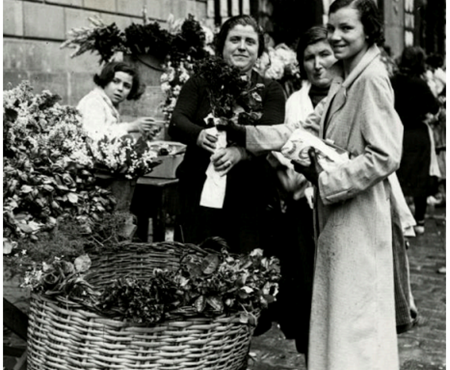
1945. Plaça Sant Jaume

Un dels moments més especials va ser descobrir que alguns dels llibres contien a l'interior les llegendes reescrites durant el taller "Sant Jordi creatiu: Reescriu la llegenda". Aquesta proposta va donar lloc a mirades de sorpresa, curiositat i alegria