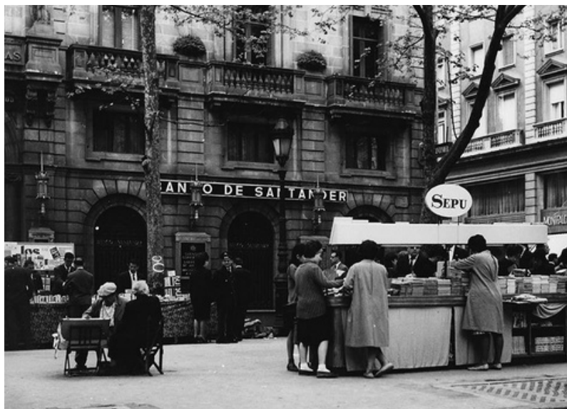
1963. Paradeta davant el Banc Santander