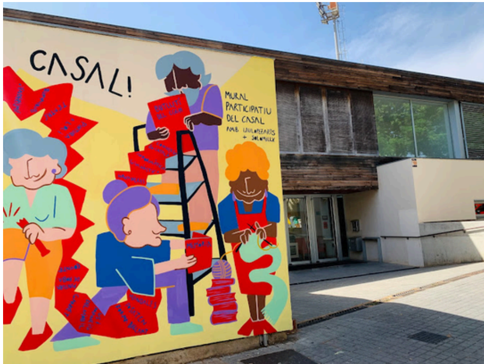
Casal Gent Gran d'Horta. C/ Feliu i Codina 37-43, 08031

Gràcies a totes les participants per fer d'aquest Sant Jordi un dia especial ple de narrativa, emoció i companyia.