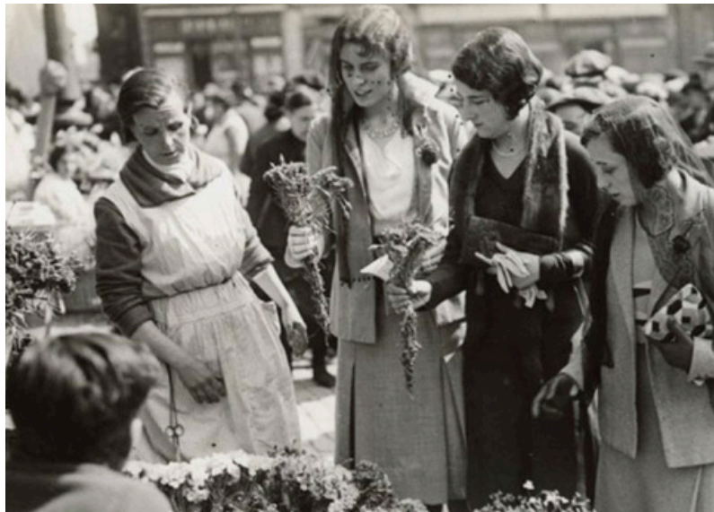
1931. Venta de flors a la Plaça Sant Jaume

La llegenda, ben coneguda, se celebra arreu de Catalunya. És admirada per tot el món pel fet que les dones regalen llibres i els homes, roses de tots colors —símbol que demostra Amor i Pau.