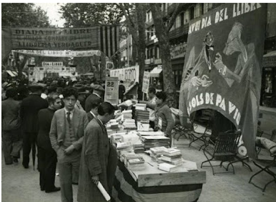
1934. "Dia del llibre"