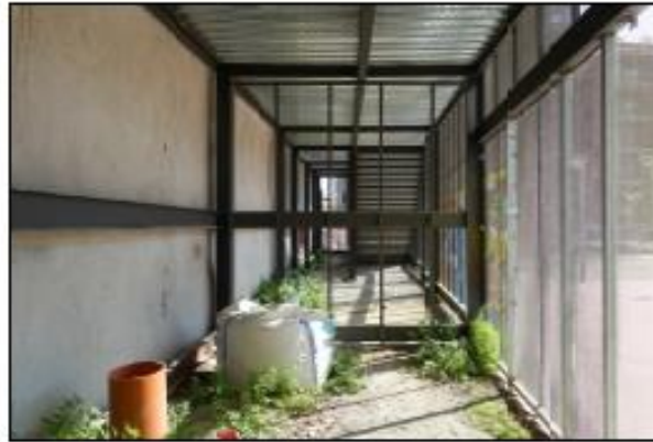
F02 PLANTA TERRATZ, TERRATZ 01