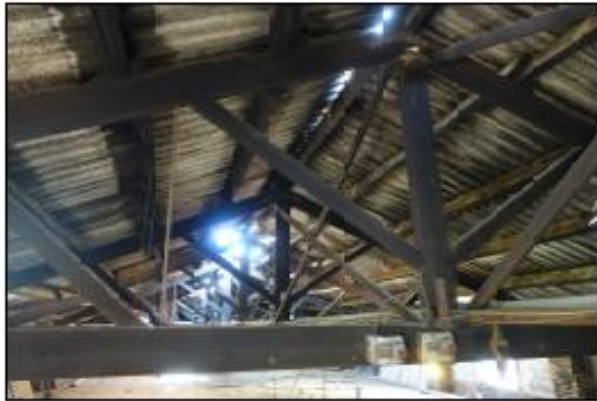
F04 PLANTA TERRATZ, SALA 01