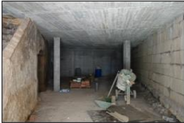
F01 PLANTA TERRATZ, SALA 01