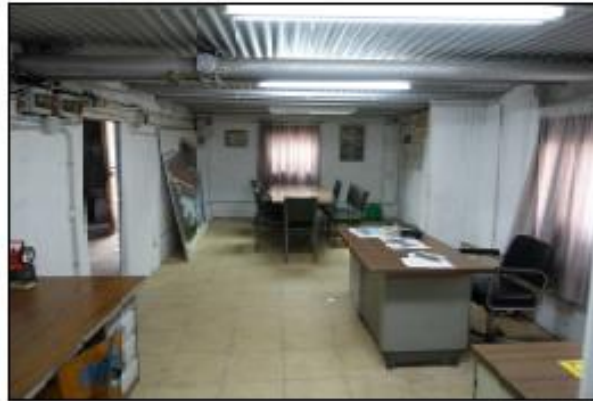
F05 PLANTA TERRATZ, SALA 02