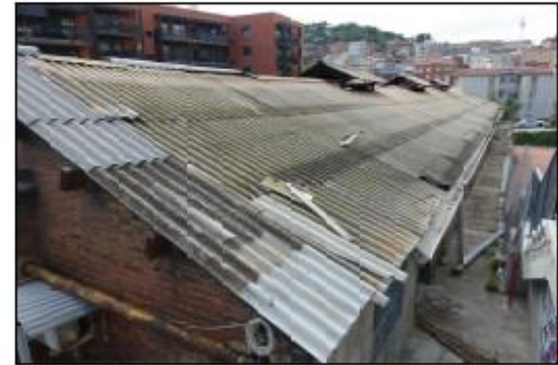
F06 PLANTA TERRATZ, SALA 02