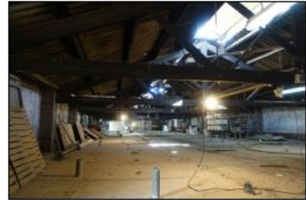
F03 PLANTA TERRATZ, TERRATZ 02